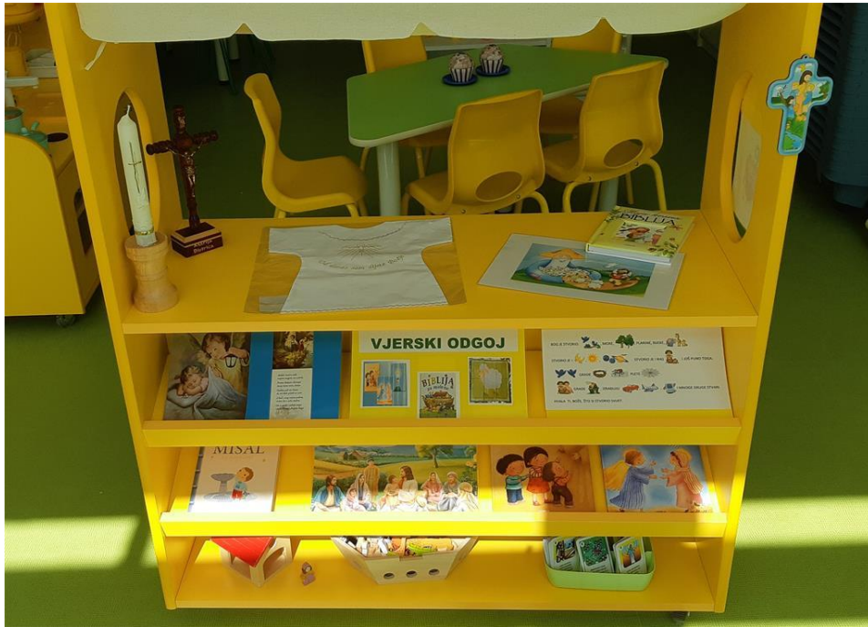
Slika 4. Kutak za vjerski odgoj