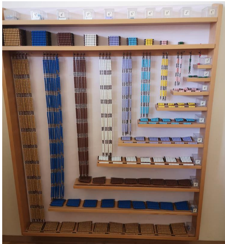
Slika 15. Kvadratni i kubni lančići.