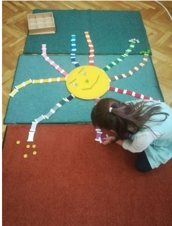
Slika 9. Pločice u boji

Još jedna vježba za razvoj vidne percepcije jesu pločice u boji . Ova vježba traži od djeteta da, nakon što razvrsta obojene pločice prema istoj boji, iste pločice složi i razlikuje prema svjetlini (Slika 9.).