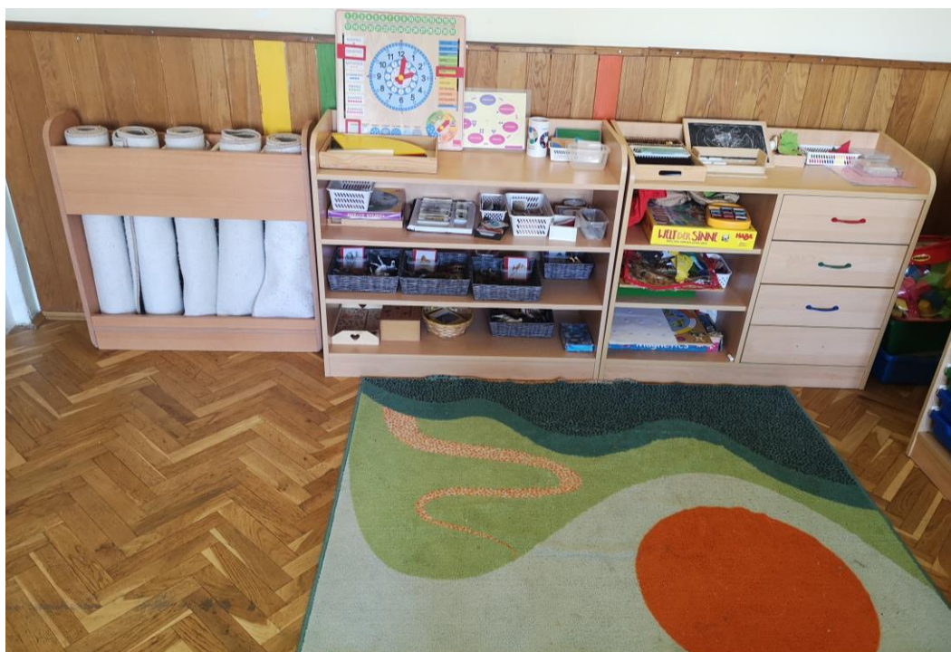
Slika 17. Dio Montessori prostorije za kozmički odgoj, „DV Cvjetna livada“ u Požegi.