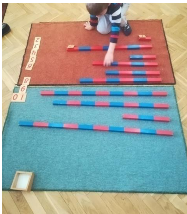
Slika 14. Brojevine gredice.

Stečeno znanje utvrđuje se odbrojavanjem crvenih vretena u pretince koji su označeni brojkama od 1 do 9. Također, tada se uvodi i znamenka 0. Znanje se nadograđuje slaganjem crvenih kružića na izrezane brojeve. Sljedeća nadopuna znanja odnosi se na uvođenje decimalnog sustava. Ovim materijalom za rad može se vježbati zbrajanje, oduzimanje, množenje, dijeljenje. Isto tako, jedan od Montessori pribora za rad jesu kvadratni i kubni lančići (slika 15.) s prutićima na kojima su obojene kuglice, a uz koje se slažu kocke i kvadrati obojenih kuglica. Ovom aktivnošću djeci se daje osjet kvadrata kao površine, a kocke kao tijela u prostoru. Ovom aktivnošću dijete osim matematičkih vještina razvija vještinu i strpljenje. Pribori za rad matematike podijeljeni su u pet skupina: