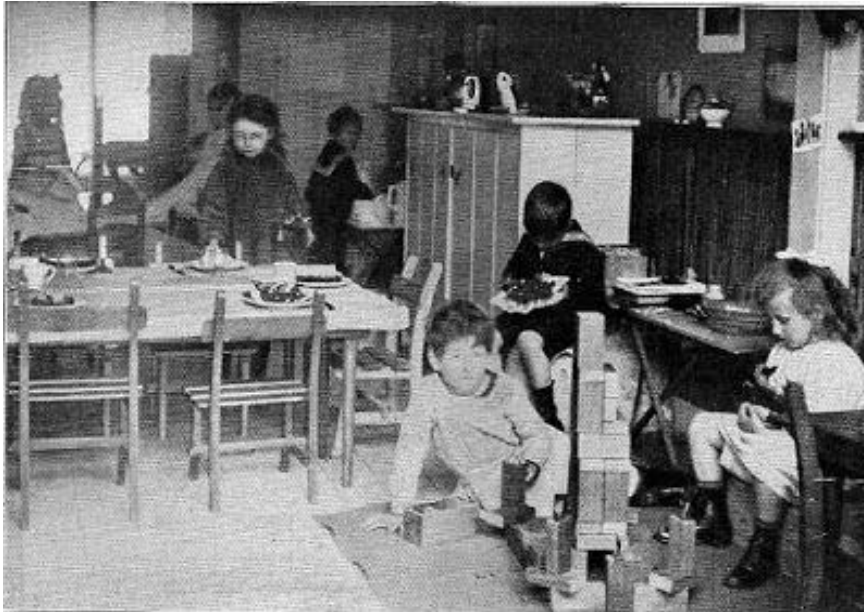
Slika 3. Montessori, dječja kuća u Njemačkoj, Hag. Pristupljeno 2. srpnja 2021.