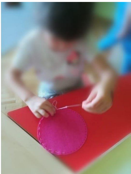
Slika 6. Šivanje