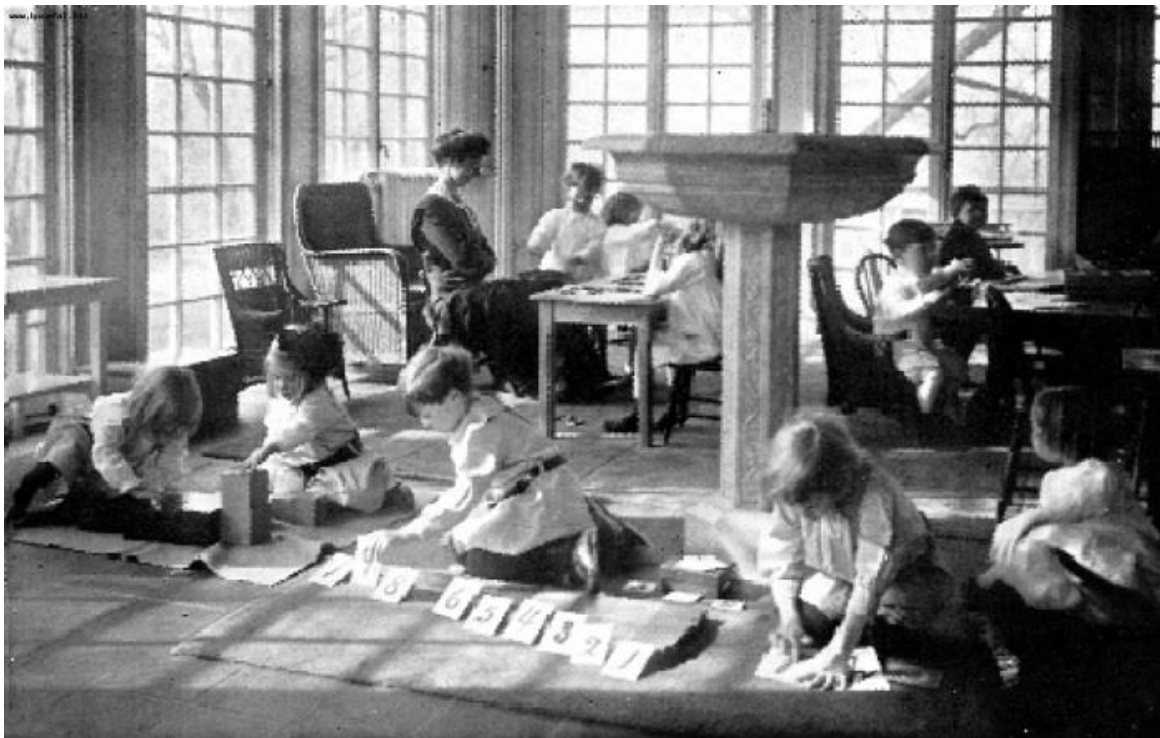
Slika 2. Casa dei Bambini, dječja kuća Marije Montessori.

Kako tvrdi Philipps (1999), Maria Montessori govorila je o oslobađanju jedne više razine dječje ličnosti i nastanku „novog“ djeteta. Vodila se rečenicom „Pomozi mi da mogu samo!“ (Philipps, 1999, str. 9). Uloga odraslih je, prema tome, djeci pomoći isključivo ako djeca sama zatraže pomoć, jer u suprotnom narušavaju razvoj djetetove samostalnosti. Nakon otvorenja i rada dječje kuće, otvaraju se novi vrtići u Rimu i Milanu, a Maria odlazi i u Englesku, Australiju te Ameriku gdje pomaže i otvara nove kuće koje će prakticirati njezinu odgojnu metodu.