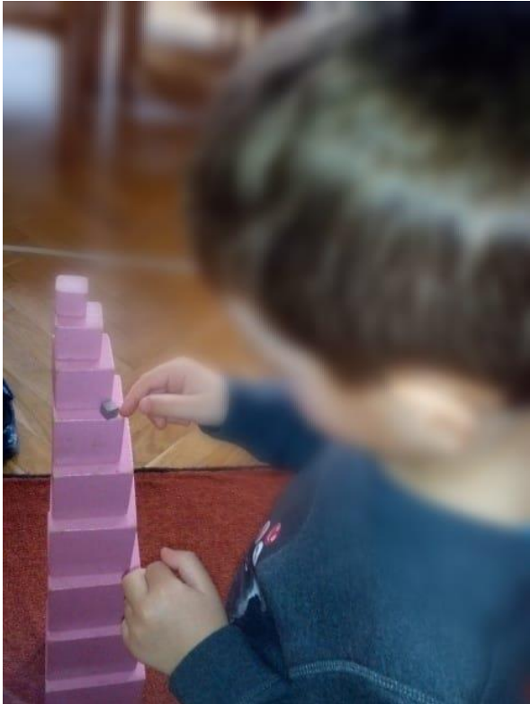
Slika 8. Ružičasti toranj

Vrlo poznat pojam u Montessori pedagogiji jest „ružičasti toranj“ (Slika 8.). On predstavlja materijal za uvježbavanje vidne percepcije kao i spretnosti nošenja kockica do razmotanog tepiha. Roza tornjem dijete radi na svojoj strpljivosti, obzirnosti te otvara stazu prema konkretiziranju količine, brojevni veličina i decimalnog sustava.