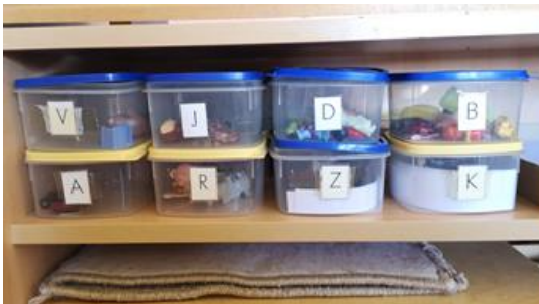
Slika 13. Predmeti razvrstani prema početnom slovu.