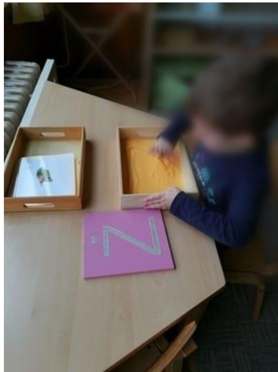
Slika 11. Slova od brusnog papira i pisanje u palenti.

Dijete jezik upoznaje uz pomoć vida, sluha i pokreta, koji su međusobno povezani i neophodni za učenje pisanja i čitanja, kao i za usvajanje novih riječi i bogaćenje rječnika. Seitz i Hallwachs (1997) ističu kako su djeca u ranoj vrtićkoj dobi „gladna“ novih riječi i širenja vokabulara jer se nalaze na osjetljivom stupnju svladavanja jezika. Govor je važan i u vježbama za poticanje osjetljivosti i spretnosti, te je usko vezan uz pokret i finu motoriku. Najpoznatiji materijal za razvoj jezika, koji uključuje osjet dodira, vida i sluha, jesu slova na grubom i hrapavom papiru (slika 11.) Neka djeca nauče pisati i prije nego su saznala značenje slova, svojim vršcima prstiju opipavaju oblik slova, a njihovi mišići pamte.