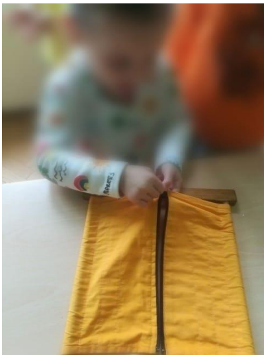
Slika 7. Okvir s patentnim zatvaračem