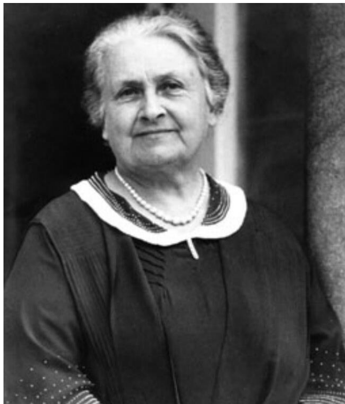
Slika 1. Maria Montessori

Maria Montessori, jedna od najistaknutijih osoba u povijesti predškolskog odgoja, rođena je 31. kolovoza 1870. godine u Italiji. Dolazi iz mjesta Chiaravalle koje pripada provinciji Ancone. Obitelj Marije Montessori bila je svestrana, samim time što je otac Alessandro vukao korijene iz poznate poduzetničke obitelji iz Bologne, dok je majka Renilde porijeklom iz obitelji poznatih talijanskih intelektualaca. „O djetinjstvu Marije Montessori se ne zna puno, ali je sigurno odrasla u obiteljskoj kući koja joj je davala snagu i slijedila određene ciljeve da bi njezin život postao angažiran i samosvjestan. To nije bilo u skladu s tradicionalnom ulogom žene u Italiji koja je bila strogo katolička. (Seitz, Hallwachs, 1997., str. 19). Marijini roditelji priželjkivali su da Maria postane učiteljica, no ona je interes pokazivala u području prirodnih znanosti i tehnike. U to vrijeme, u Italiji to i nije bilo tako tipično jer su u istim područjima vladali muškarci, baš kao i u medicini koju je naposljetku odlučila završiti i postati prva žena doktorica medicine u Italiji.