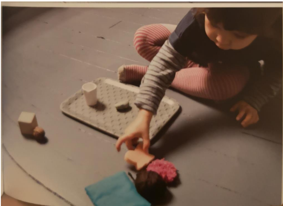
Slika 10. Aktivnost „dodirivati gradivo“

U Montessori prostoriji moguće je pronaći i materijale koji su obloženi različitim hrapavim i glatkim površinama. Ovakvi materijali služe za razvijanje osjetljivosti dodira ukazujući djetetu na kontrast hrapavo-glatko. Djetetu se mogu i prekriti oči te mu se ponude tkanine različite teksture, a na ovaj način dijete se još više usmjerava prema tkaninama i njihovim teksturama.