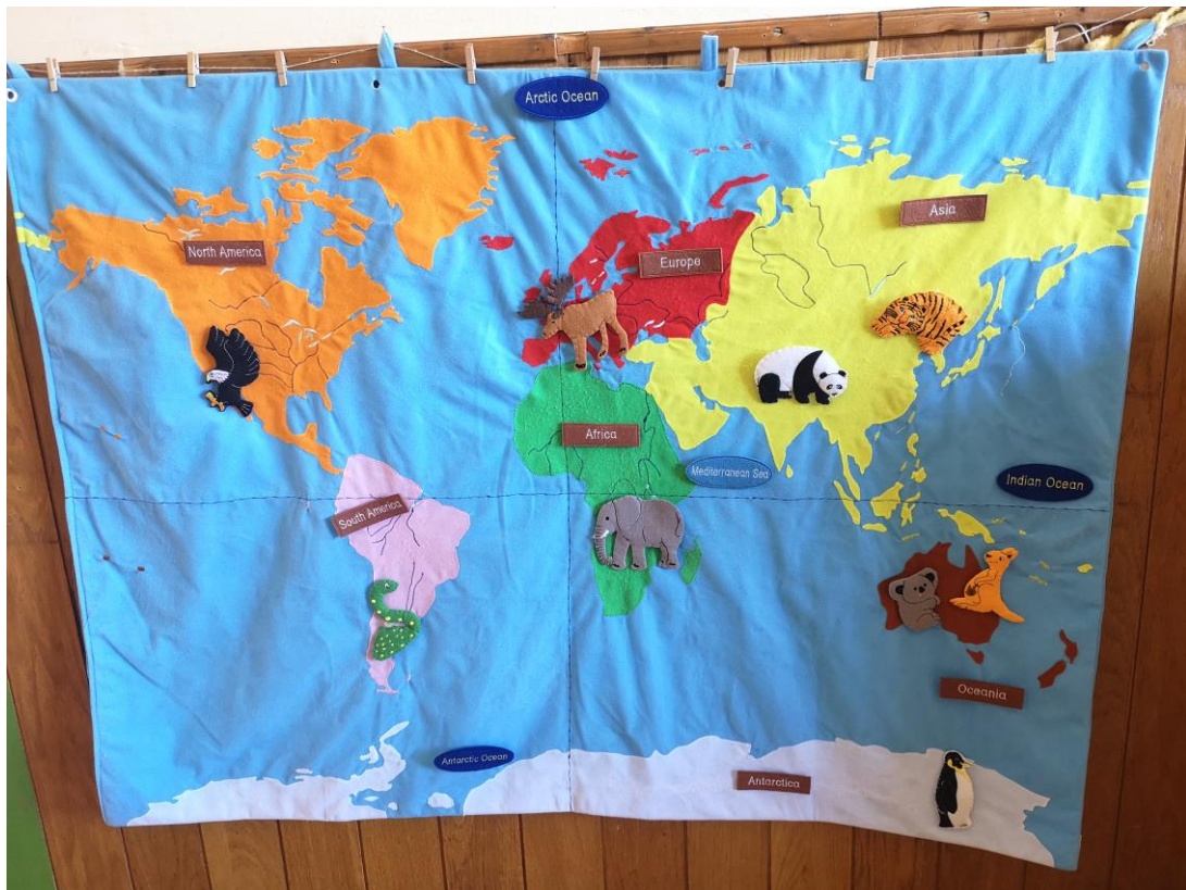
Slika 16. Karta svijeta, uključuje područje zemljopisa, zoologije, botanike, antropologije.

Kozmički odgoj nudi djetetu prekrasan uvid u svijet. Materijali za kozmički odgoj djeci omogućuju da uspostave kontakt sa svijetom, da stječu temeljna znanja i osnovna iskustva o njemu i pojavama van njega. Upoznaje se područje koje je široko i koje dijete potiče da istražuje i stvara, a Montessori odgojitelj je taj koji zajedno s djecom stvara pribor za rad i na svako dječje pitanje traži odgovor kako bi zadovoljio njegove potrebe.