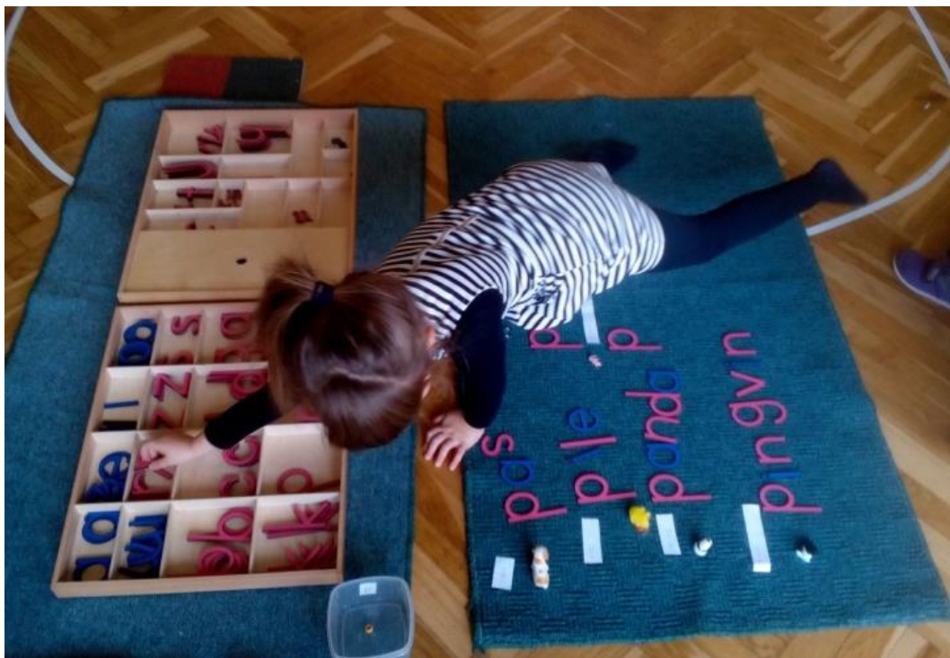
Slika 12. Pisanje naziva uz male predmete.

U Montessori metodi čitanje i pisanje uči se sintetičkom metodom. Prvo se djeci prikažu pojedina slova, zatim se postepeno slažu u riječi načelom od lakšeg prema težem. Četvrta godina života smatra se najpovoljnijom dobi za učenje pisanja. U ovom razdoblju prirodni razvoj govora je na svom vrhuncu. Djeca u ovoj životnoj dobi uživaju u svojoj novoj sposobnosti pisanja te neumorno ispisuju riječi i nazive. Dijete općenitim bogaćenjem rječnika usvaja imena bića, stvari i pojava. Izravnom i neizravnom pripremom uči kako su riječi tvorba glasova te da svaki glas ima svoj simbol. Montessori materijal djecu potiče da spontano istražuju i razvijaju jezične kompetencije. Uloga upijajućeg uma jest da dijete neizravno upija znanje koje je primjereno njegovom razvojnem stupnju i potrebama. Djetetu se mogu ponuditi predmeti koje bi trebalo razvrstati prema početnom slovu ili nekom drugom kriteriju (slika 13.).