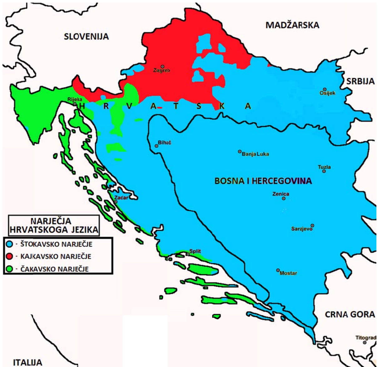
Slika 1: Zemljopisna distribucija hrvatskog jezika

Geografski raspored dijalekata hrvatskog jezika prikazan je na slici 1: