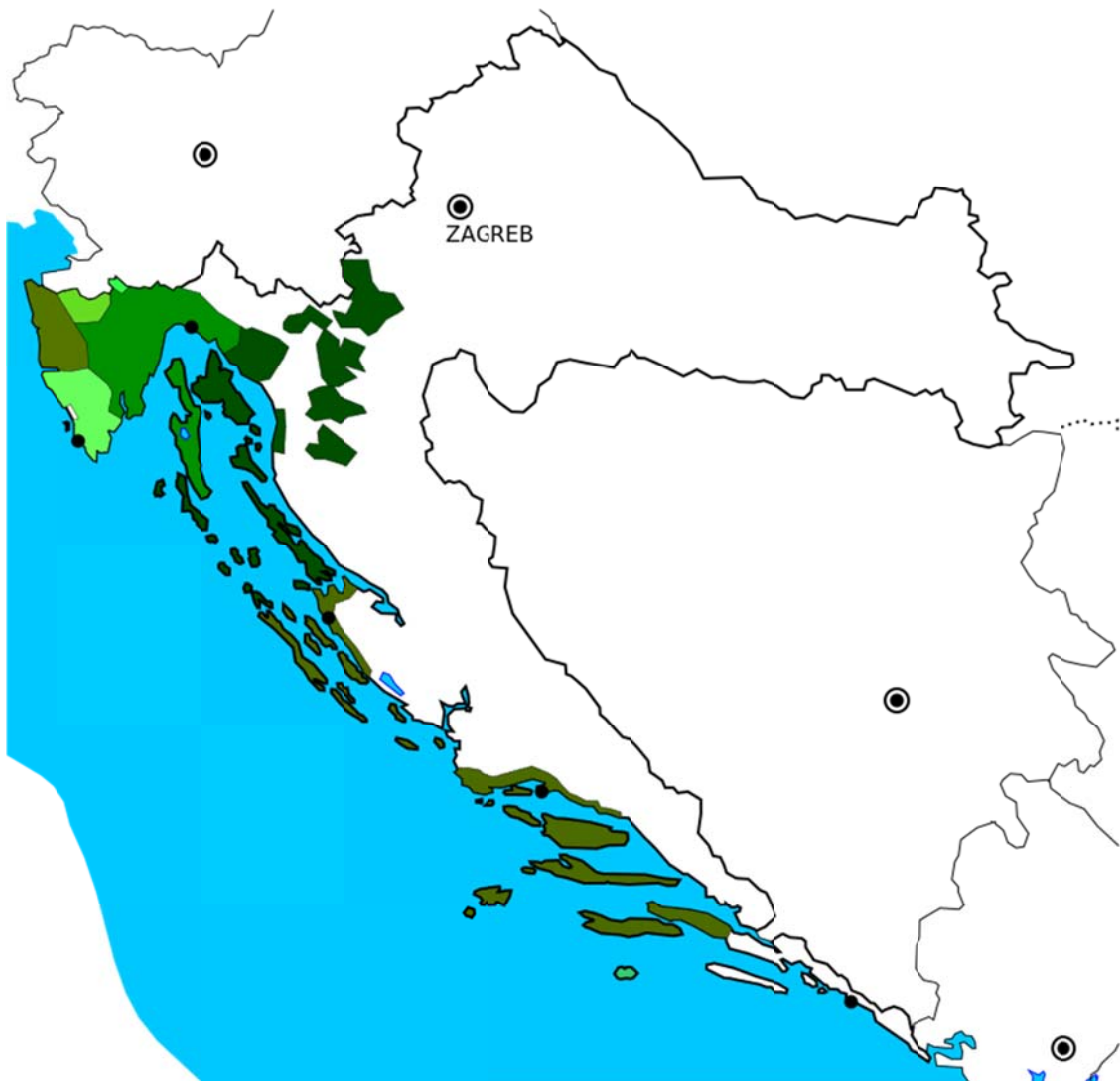
Slika 2: Čakavsko narječje krajem dvadesetog stoljeća

Naziv potječe od upitne zamjeničke imenice ča, genitiv najčešće česa, koja se danas više ne govori na cijelom području čakavskog narječja: naime, na najistočnijim čakavskim otocima Korčuli i Lastovu, na čakavskom dijelu Pelješca i na mnogim odsjecima uskoga čakavskog obalnog pojasa govori se što (ili šta), a u Istri oko gornjeg toka Mirne i u dijelu čakavskog govora južno od Kupe kaj. No, iako je dobar dio čakavštine prihvatio te štokavske ili kajkavske samostalne zamjeničke oblike, u mnogim se takvim govorima i dalje upotrebljava čakavski oblik uz prijedloge ( http://www.enciklopedija.hr/natuknica.aspx?ID=13143 preuzeto 10. siječnja 2016.).