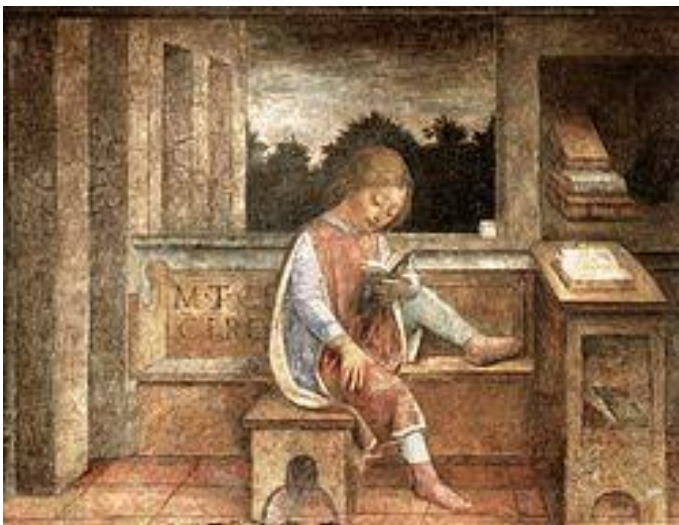
Prilog 2. V. Foppa: Mladi Ciceron čita, 1464.

Arhijom. Posebnu pozornost retorici posvetio je u vrijeme građanskoga rata između Sulijevih i Marijevih pristalica (91. – 88. g. pr. Kr.) i razdoblja nakon toga. To je doba donijelo pregršt javnih polemika, političkih i sudskih procesa i govora pa je upravo zato bilo najpogodnije za učenje govorničkih vještina. Govorničku je karijeru službeno započeo 81. g. pr. Kr. kada prvi put drži sudski govor. Dvije godine nakon toga (od 79. do 77. pr. Kr.) odlazi na studijsko putovanje u Grčku i Malu Aziju gdje sluša slavne filozofe i govornike: u Ateni akademika Antioha, epikurovca Zenona, retoričara Demetrija; na Rodu retora Apolonija Malona (nekadašnjega njegova učitelja u Rimu), a u Maloj Aziji upoznaje s azijskim govorničkim stilom. 4