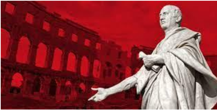
Prilog 4. M. T. Ciceron

Čak je i danas vidljiv Ciceronov utjecaj u političkoj retorici; čest je slučaj citiranja njegove rečenice „Dokad ćeš još, Katilino, zloupotrebljavati našu strpljivost?“ iz Prvog govora protiv Katiline samo se umjesto Katiline ubacuju imena državnih predsjednika, gradonačelnika i slično. Na taj način sukob između Cicerona i katiline postaje shema suvremenih i svezremenih političkih okršaja i prepirki. 61