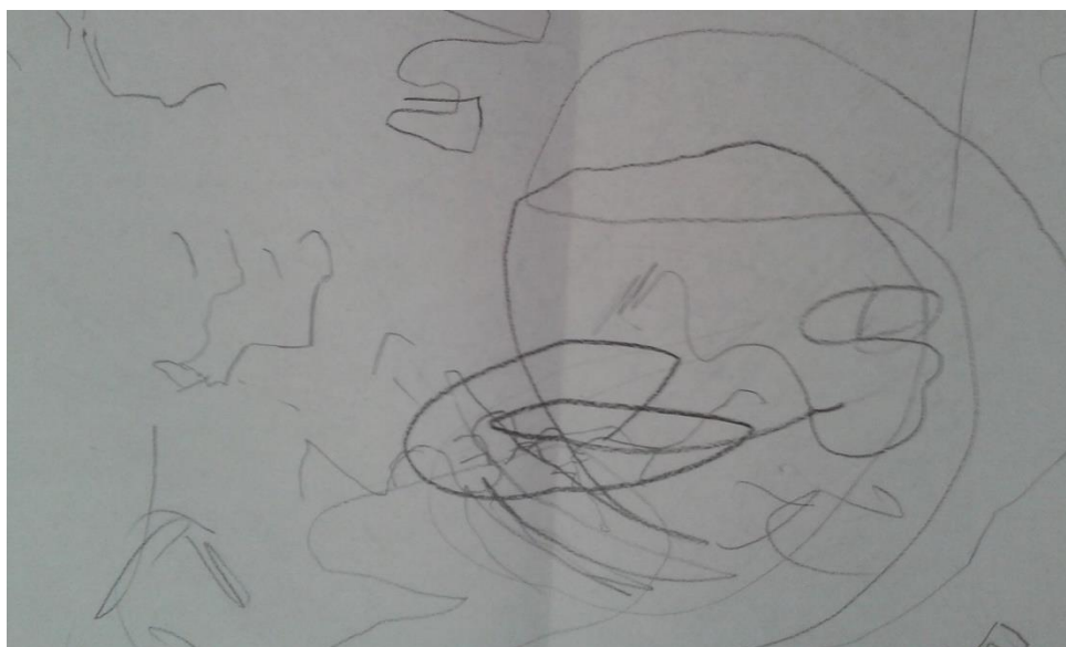
Slika 1.: Crtež dječaka autista 1. dan

Dječak se s vremenom i opustio. Svako jutro je dolazio veselo i nasmiјano u vrtić i govorio: „Volim te, teta“. Došao bi do nas, sjeo u naručje i zagrlio nas. No, što se tiče njegove društvenosti prema prijateljima, trebat će mu još vremena da se i prema njima otvori. Ne dolazi u konflikte i ne pokazuje više neželjena ponašanja, ali ne dopušta da mu se drugi petljaju u igru. Njegova igra s ostalom djecom traje najviše 10 minuta, nakon toga ili se povuče iz igre, ili na neki način potakne svađu među djecom.