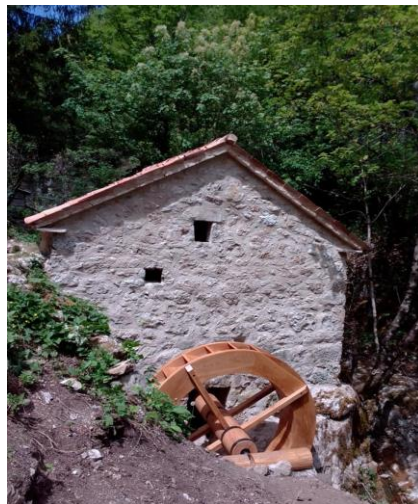
Slika 10: Obnovljeni mlin u Trebišću

Osvještavanje i informiranje domaće i nacionalne publike o postojanju jedinstvenog kulturno-sakralnog krajobraza na području Parka Prirode Učka u čiji plan upravljanja ulazimo kao dobrodošli. Upoznavanje turističkih operatera s ovim destinacijama uroditi će stvaranjem turističkog proizvoda radi kojeg će destinacija bivati posjećena tijekom većine godine. Jednog dana će ta činjenica zapošljavati lokalno stanovništvo i spriječiti mlade za odlazak u velike gradove.