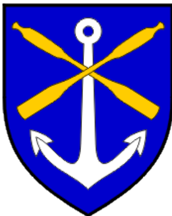
Slika 1.: Grb Općine Mošćenička Draga