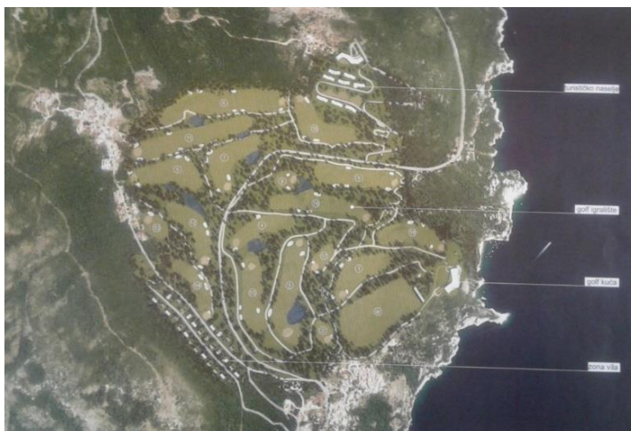
Slika 7.: Golf resort Brseč