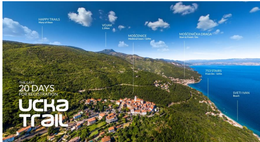
Slika 6.: Promotivni plakat Učka Trail, 2019

planinarskom stazom iz Brseča, šumskom cestom iz sela Zagore ili iz Sv. Jelene. Uživati u svim blagodatima Parka prirode Učka atrakcija je pogleda i uzdaha. 42