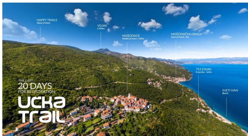
Slika 6.: Promotivni plakat Učka Trail, 2019

planinarskom stazom iz Brseča, šumskom cestom iz sela Zagore ili iz Sv. Jelene. Uživati u svim blagodatima Parka prirode Učka atrakcija je pogleda i uzdaha. 42