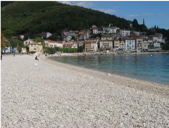
Slika 2.: Plaža SIPAR i stari grad – Imidž Mošćeničke Drage

sadašnjosti i budućnosti i postaje zanimljiv današnjim, sve zahtjevnijim turistima. Općina Mošćenička Draga atraktivna je turistička destinacija u cijelosti, stoga je sama po sebi brend i spada u sam vrh atrakcijske ponude Hrvatske i ovog dijela Europe. Ona ima svoj karakter, određenje, prepoznatljivost i imidž. Taj imidž služi destinaciji u svrhu bolje posjećenosti i boljoj prepoznatljivosti, međutim, nije dobro za destinaciju razvijati konfuzan imidž jer tako što zbunjuje potencijalnu potrošnju. Dovoljno da destinacija bude prepoznata po jednom glavnom imidžu i još jednom dodatnom sporednom npr. sunce i more, ali i kultura ili gastronomija. Usmenom predajom usluga npr. turističkih vodiča, voditelja na lokalitetu, medijatora znanja širit će se pozitivan imidž destinacije. 35