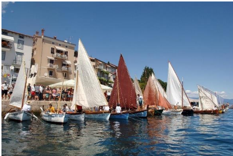
Slika 5: Regata tradicijski barki na jedra

U programu Maritimnog festivala pored žive ribarske i pomorske baštine, prezentiraju se autohtoni proizvodi i prigodni suveniri, autohtona gastro i etno ponuda, a u njoj sudjeluju likovni i glazbeni umjetnici kojima je maritimna tematika osnovna inspiracija.