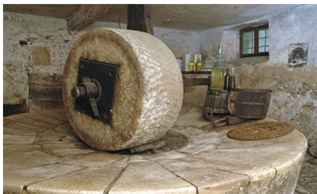
Slika 3.: Toš u Mošćenicama

Istaknuta baštinska uporišta povijesnog grada Brseča i njegove okolice Brseščine: srednjovjekovna urbanistička cjelina s pojedinačnim spomenicima graditeljskog nasljeđa većinom iz 17. i 18. st. i u njima sačuvanim inventarima (sakralnim i profanim) i autentično sačuvanim spomeničkim interijerima – toš, škola i razvoj školstva u Brseču, prožimanje utvrđenog grada, ruralne okolice i strme obale s izrazitim krajobraznim vrijednostima: suhozidi, gromače i lokve, vinarstvo i vinogradarstvo, ljekovito bilje, broskva, šparoge, češnjak i smokve, vizure i panorame, podmorje, brdovito zaleđe, aura rodnog mjesta sa sačuvanom rodnom kućom Eugena Kumičića (Jenio Sisolski) i posebno njegova romana “Začuđeni svatovi” i “Jelkin bosiljak” koji se odvija u samom Brseču i okolici, aktivni umjetnici, posebno galerija i park skulptura Ljube de Karina, te ateljei Maje Franković i Zdenka Velčića, naravno čakavština i glagoljica. 38