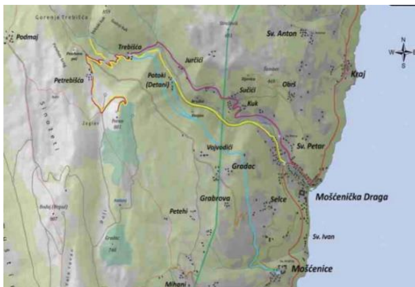
Slika 9.: Mitsko-povijesna staza Trebišće-Perun

Potrebno je zasebno spomenuti igrokaz za izletnike turističke ture u režiji teatralne grupe Perunika. Riječ je o korištenju Trebišća kao mitološku kulisu (slap, most, kapelica, kuća Stabla svijeta, ritualno vatrište) za kojeg postoji čitav scenariji s kojim se nastoji približiti publiku božanskim odnosima i skrovitoj slici svijeta slavenske mitologije. Dosadašnja praksa personifikacije božanskih likova i naratora u ulozi žreca se pokazala kao pun pogodak pogotovo za djecu koja nisu prestajala snimati događaj sa pametnim telefonima i na taj način promovirati aktivnost na društvenim mrežama.