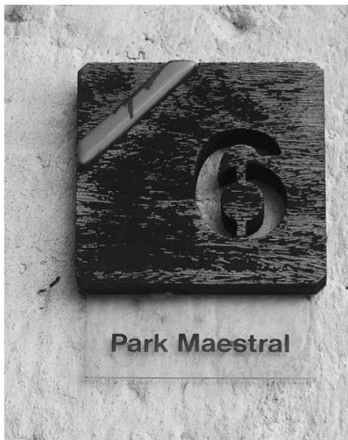
Slika 2. Kućni broj u apartmanskom naselju Červar Porat

Smatra se da se prvo brendiranje pojavljuje u ovom apartmanskom naselju, a primjer su natpisi ulica i kućni brojevi. Na samom ulazu u apartmansko naselje Červar Porat stoji totem na kojem se nalazio stilizirani urbanistički koncept naselja. Postoje tri kruga koja označavaju položaj stanova u Červaru Porat, prvi je plavi krug koji označava marinu i simbolizira koliko su stanovi blizu mora, sljedeća je ružičasta boja kruga koja označava središnji dio, te zelena koja označava rubni dio apartmanskog naselja, te su stanovi u tom dijelu bili bliže šumi. Danas te oznake možemo vidjeti na samo nekim kućama, no nazivi ulica i brojevi na kućama su se uspjeli očuvati. 45