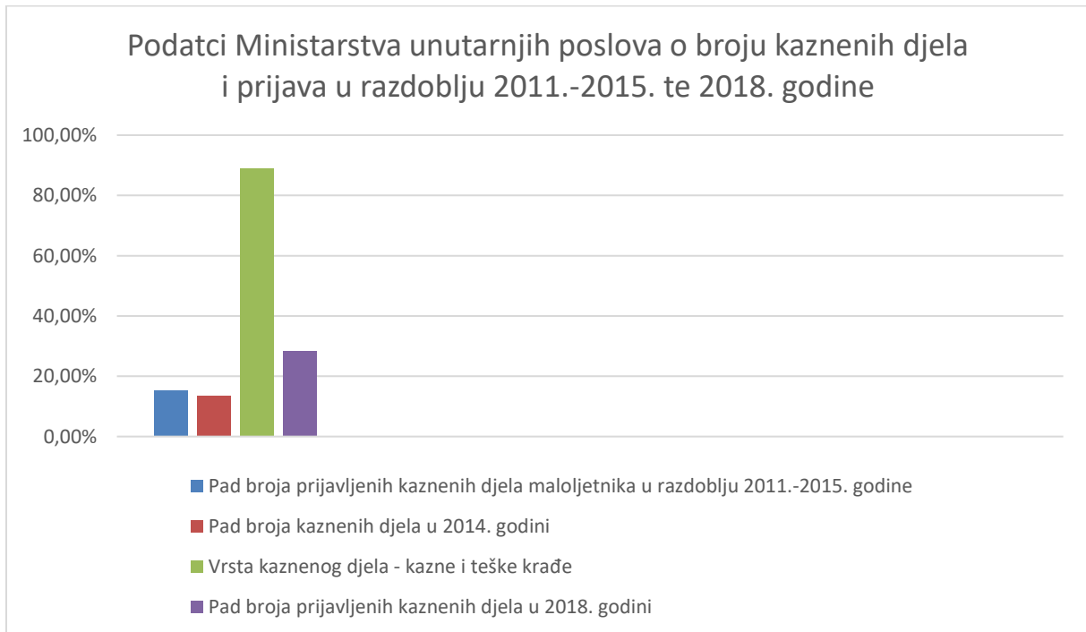
Grafikon 2. Podatci Ministarstva unutarnjih poslova o broju kaznenih djela i prijava u razdoblju 2011.-2015. te 2018. godine. Vlastita izrada.