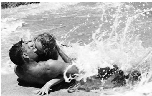
Slika 7. Odavde do vječnosti

Na plaži Waikiki hollywoodska filmska industrija je prisutna još od 1920-ih godina (Löfgren, 1999: 217). Filmski moguli i zvijezde jednostavno morali su provesti godišnji odmor u jednom od mnogobrojnih havajskih hotela. Kao rezultat toga, Hollywood je počeo snimati filmove na Havajima. Najpoznatiji filmovi snimljeni na Havajskom otočju su filmovi From Here to Eternity (Odavde do vječnosti) i Blue Hawaii (Modri Havaji) s Elvisom Presleyjem (Löfgren, 1999: 217). Tih godina glavne nagrade u američkim kvizovima često su bile romantično putovanje na Havaje za dvoje (Löfgren, 1999: 217).