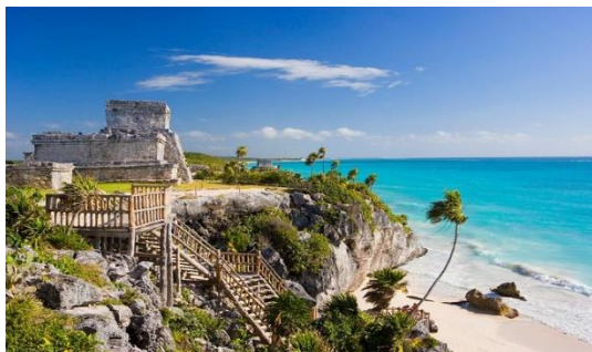
Slika 22. Ruševine Maja, Tulum, Meksiko

Svaka plaža ima svoju vlastitu povijest, pa tako ima i Tulum u Meksiku gdje se mogu istražiti drevne ruševine Maja. Istaknute su još i plaže na Malti (olupine brodova iz Drugog svjetskog rata), plaža s ruševinama Olympos u Antaliji (Turska), drevni kipovi Uskršnjih otoka u Čileu, Isla de Tabarca u Španjolskoj (nekad utočište gusara) i Cornwall u Engleskoj (istraživanje spilja koje su nekad bile poznato mjesto krijumčara čaja, rakije, džina, ruma i duhana) (TravelRepublic, 2016).