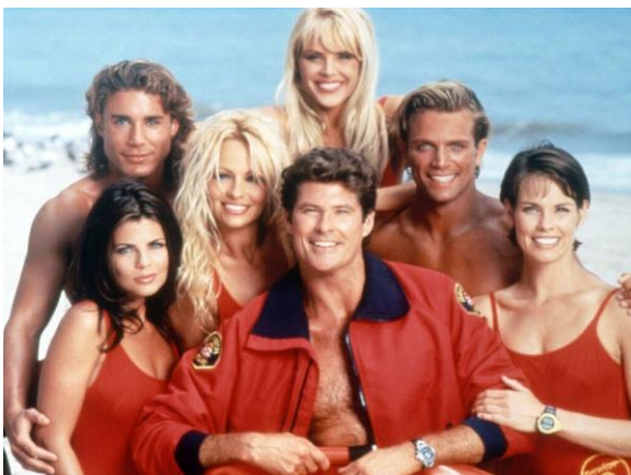
Slika 8. Baywatch

Od televizijskih serija najviše se istaknula serija Baywatch (Spasilačka služba) iz 1989. godine. Glumačku ekipu su sačinjavali David Hasselhoff, Parker Stevenson, Shawn Watherly, Billy Warlock i Erika Eleniak. Na snimanju druge sezone serije glumačkoj postavi pridružuje se Pamela Anderson. Serija je bila prikazivana u 145 zemalja i proglašena je najpopularnijom TV serijom na svijetu. Zadnja epizoda serije snimljena je 2001. godine. Istaknuta je još i serija Miami Vice (Poroci Miamija) iz 1984. godine.