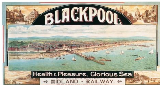
Slika 1. Blackpool

doba (1901. – 1910.), ljetovališta su postala javno dostupna i vrlo popularna (Taylor, 2017). Zakonski akti, kao što su Zakon o tvornicama iz 1850. (dopuštanje slobodnih subotnjih popodneva radnicima) i Zakon o državnim praznicima iz 1871. (opće odobravanje slobodnih dana), omogućuju slobodno vrijeme ostaloj radnoj snazi te poboljšavaju njihove životne uvjete. Sredinom 19. stoljeća plaža kao lijek, namijenjen aristokratskoj eliti, industrijalizacijom i boljim prometnim povezivanjem zamijenjena je plažom užitka i razonode. Godine 1850. engleski grad Blackpool se etablirao kao odmaralište za sve klase (Inglis, 2000: 50). Od mjesta hidroterapije plaža se pretvara u mjesto dokolice, rekreacije i relaksacije da bi na kraju postala mjesto za odmor od posla i svakodnevice.