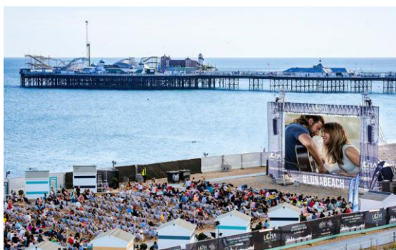
Slika 23. Brighton, Engleska

Lista navedenih unikatnih plaža ne bi bila potpuna bez plaže Maho na Angvili (nalazi se uz zračnu luku i zrakoplovi u niskom letu uobičajeni su prizor), Venice Beach u Kaliforniji (plaža je meka za ljubitelje čudnih stvari poput Freakshowa ), plaža Brighton u Engleskoj (gledanje filmova na otvorenome) i plaže Mrtvog mora u Izraelu i Jordanu (zbog velike količine soli u vodi može se plutati na površini vode) (TravelRepublic, 2016).