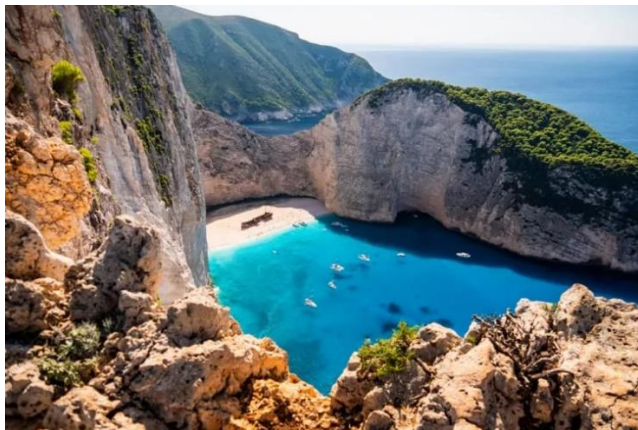
Slika 17. Navagio, Zakintos, Grčka

Plaža Navagio na otoku Zakintos (Grčka), okružena vapnenačkim liticama, postala je svjetski poznata i zbog naziva Plaža brodoloma (Hueneke, 2019). Taj naziv je dobila zbog nasukavanja broda 1980. godine. Plaža je danas dostupna samo brodicama. Sa 200 metara visokih litica iznad plaže pruža se predivan pogled na plavo more. Jedna, uz nabrojene poznate svjetske plaže, je i talijanska plaža Spiaggia Grande u Positanu. Sa svojim spektakularnim kaskadno izgrađenim zgradama pastelnih boja, koje se penju uz strmu obalu Amalfija, magnet je za poznate ličnosti (Hueneke, 2019).