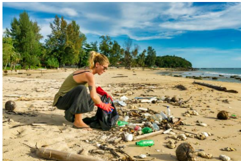
Slika 24. Volonterski turizam

Najčešća aktivnost posjetitelja na plaži je plivanje. Posjetitelji mogu uživati u turizmu na plaži u kombinaciji direktnog kontakta sa vodom, pijeskom, suncem, slikovitošću okolne prirode i rekreativnih aktivnosti. Turizam zasnovan na suncu i plaži predstavlja osnovnu pretpostavku za proširenje turističke ponude wellness turizma, kulturnog turizma, sportskog turizam, medicinskog turizma, ekološkog turizma, nautičkog turizma i dr. Unutar nabrojanih segmenata selektivnih oblika turizma najčešće aktivnosti su: avanturističke (splavarenje, zipline, paragliding, bungee jumping itd.), sportske (trčanje, plivanje, surfanje, bicikliranje itd.), nautičke (jedrenje na dasci, ronjenje, ribolov i dr.), kulturne (aktivnosti koje doprinose i poboljšavaju imidž destinacije, a odnose se na društveni, povijesni, edukacijski razvoj i dr.) i sl. Povremeno se turizam na plaži kombinira s volonterskim turizmom udruga i neprofitnih organizacija, nudeći projekte zaštite okoliša, obrazovanja i recikliranja plastike u suradnji s lokalnim zajednicama.