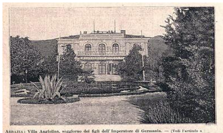
Slika 9. Villa Angiolina , Opatija

Nakon Drugog svjetskoga rata došlo je do obnavljanja turističke infrastrukture koja je bila uništena u ratnim razaranjima. Proglašavaju se nacionalni parkovi, parkovi prirode, utemeljuju dramski, filmski i glazbeni festivali ( Dubrovačke ljetne igre , Splitsko ljeto , Pulski filmski festival , i dr.). Na međunarodnu turističku ponudu značajno je utjecao razvoj zrakoplovne industrije. Aerodromi se mogu pronaći u gradovima kao što su Zagreb, Split, Rijeka, Pula i Dubrovnik, dok su putovanje morem i razvoj turizma na otocima omogućeni trajektnim linijama Jadrolinije (Duda, 2005: 53). Paralelno s tim, dolazi do otvaranja granica, povećanja slobode kretanja ljudi i jačanja međunarodnog turističkog prometa. Donosi se i zakonska regulativa u području turizma i ugostiteljstva. Više od 80% inozemnog prometa činili su turisti iz Austrije, SR Njemačke, Čehoslovačke, Mađarske, Velike Britanije i Italije. Sve ove promjene rezultirale su ka sve većem dolasku posjetitelja na jadransku obalu.