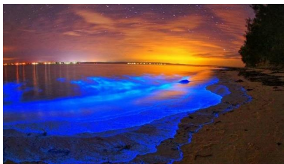
Slika 19. Mosquito Bay, Portoriko

Tako se u zaljevu Mosquito Bay u Portirku ističe prirodni fenomen – unikatna plaža prekrivena bioluminiscentnim pijeskom (sposobnost organizma da proizvede svjetlost). Uz ovaj zaljev, interesantan je i otok Iriomote (Japan) gdje je plaža prekrivena školjkama u obliku zvijezda (TravelRepublic, 2016). Izdvajaju se još i plaže Boulder's u Južnoafričkoj Republici (šetnice omogućavaju posjetitelju da izbliza vidi pingvine), plaže u Nacionalnom parku Loango u Gabonu (prebivališta divljih životinja – slonovi, bivoli, nilski konji, gorile) i Veliki koraljni greben u Australiji (ronilački obilazak morskog svijeta) (TravelRepublic, 2016).