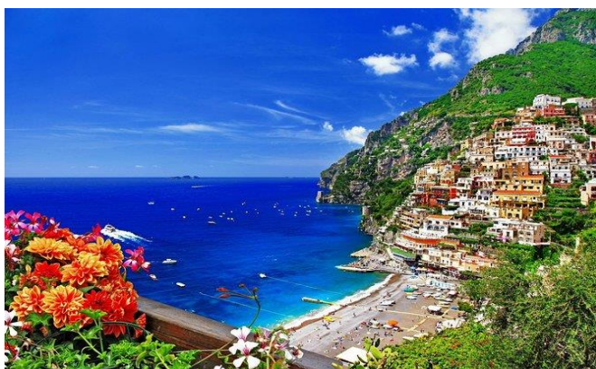
Slika 18. Spiaggia Grande, Positano, Italija

Pored do sada nabrojanih plaža, svjetski poznate su i Renaissance Island (Aruba), plaža Whiteheaven (Australija), Maya Bay na otočju Phi Phi (Tajland), The Baths (Britanski Djevičanski otoci), Anse Source d'Argent (Sejšeli), Tulum (Meksiko), plaža Bathsheba (Barbados) i dr. (Hueneke, 2019).