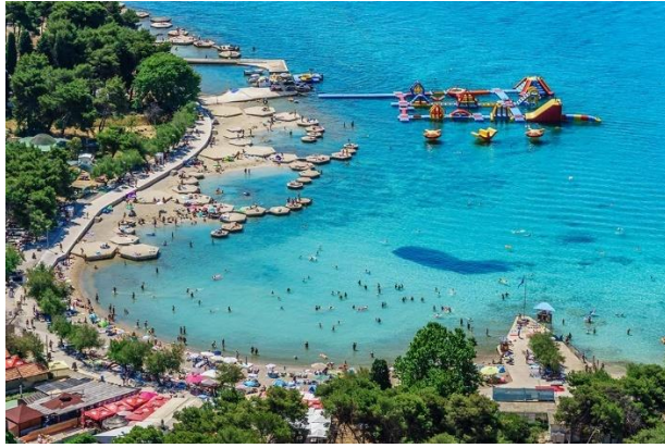
Slika 12. Plava plaža, Vodice

Velik broj plaža na hrvatskom Jadranu prikladan je za cijelu obitelj. No ipak, postoje neke plaže koja su zbog svojih ljepota i ponuda u prednosti. Tako se ističu Zlatni rat, Zaton kraj Zadra, Kraljičina plaža (Nin), plaže okolo Opatije i Crikvenice, Bačvice (Split) itd. Plaže koje su pogodne za djecu i neplivače nalaze se u Loparu, Medulinu, Omišu i dr. Naturističke plaže najviše se nalaze u Istri i Kvarnerskom zaljevu. Naturističke plaže graniče izravno s naturističkim kampovima (Koversada između Poreča i Rovinja te Bunculuka u Baškoj na Krku). Na mnogim mjestima nalaze se podijeljene plaže (naturističke i obične). Dobar primjer je Zlatni rat i plaža Borik na Lošinju (Best of Croatia, 2021).