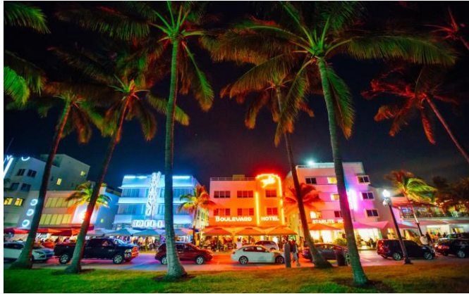
Slika 16. South Beach, Miami, Florida

Godine 1901. odmaralište Moana Surfrider otvorilo se na južnoj obali Oahua. Time je status Waikikija, kao glavno mjesto za odmor, učvršćeno. U prijevodu, Waikiki znači izviranje vode . Honolulu, glavni grad Havaja, započeo je kao malo lučko selo koje su inozemni ribari osnovali početkom 1800-ih. Područje se ubrzo razvilo u važno središte Havaja i postalo pristaništem trgovačkih brodova koji trguju krznom te brodovima za ribolov i kitolov. Krajem 1800-ih SAD je počeo shvaćati stratešku i vojnu važnost Havaja pa uspostavlja baze u Pearl Harboru i središnjem Oahuu (Waikiki, 2021).