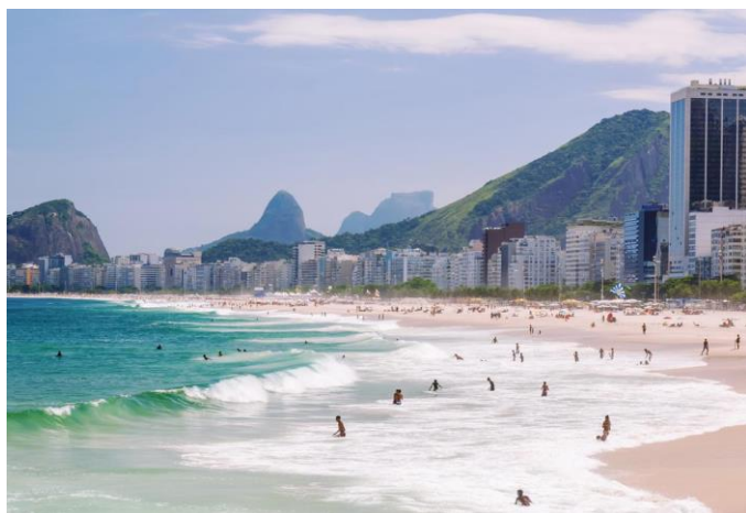
Slika 14. Copacabana, Rio de Janeiro, Brazil

Doček Nove godine na plaži Rio de Janeira privlači milijune ljudi, što ga čini jednim od najvećih događaja na Copacabani. Novogodišnji dočeci su započeli 1950-ih godina, a procjenjuje se da ovaj događaj privuče oko 2 milijuna ljudi. S obzirom na povoljne klimatske uvjete moguć je boravak na Copacabani tijekom cijele godine, pa je time dobila status kultne plaže (Rio & Learn, 2014).