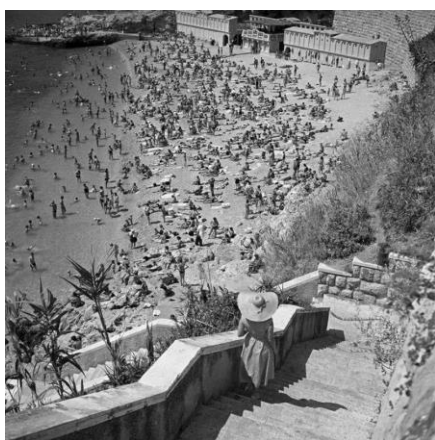
Slika 10. Dubrovnik

je hotel Plava laguna u Poreču opisan kao Najpovoljnija mogućnost kako da svoje snove pretvorite u zbilju (Duda, 2010: 335). Dubrovnik se isticao kroz slogan Dubrovnik vas poziva (Duda, 2010: 335). Objavljivanje članaka i fotografija ljetno-dokoličarske tematike imalo je promidžbenu, ali i obrazovnu ulogu. Najčešća tematika fotografija bila je plaža, odmor i uživanje na njima i sl. (Duda, 2010: 333). Od turističkih agencija istaknute su bile agencije Kompas i Putnik . U knjižarama su se nalazili potrebni časopisi, mape, knjige, poput Karta Jadrana , Jadranska obala i otoci , Auto-atlas Jugoslavije i Evrope itd. (Duda, 2010: 332). Ti oblici reklamiranja turističkih destinacija pomagali su turistima pri donošenju odluke gdje ljetovati.