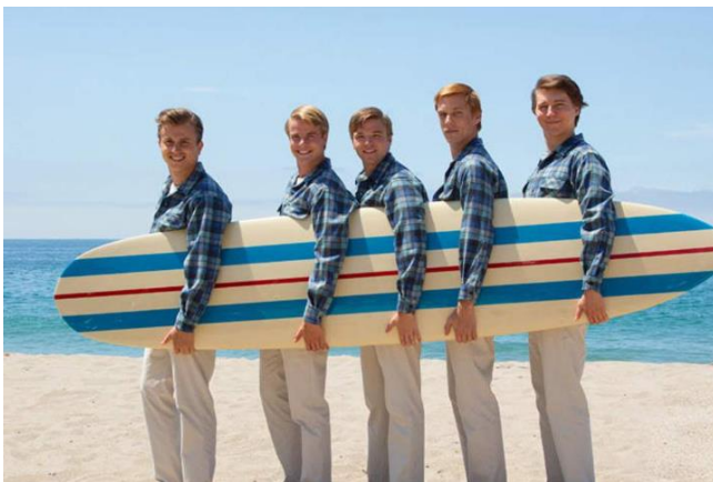
Slika 6. The Beach Boys

Na havajsku glazbu je kroz povijest utjecalo mnogo toga. Uvedeni su brojni stilovi europske glazbe, uključujući i himne. Meksički kauboiji uveli su žičane instrumente, dok su portugalski imigranti donosili braguinhe, nalik na ukulele. Također, imigranti iz cijelog svijeta su na otoke sa sobom donijeli vlastite instrumente. Tahićanska i samoanska glazba utjecala je na havajsku od 1915. do 1930., dok se razdoblje od 1930. do 1960. godine naziva Zlatno doba havajske glazbe . Tada su popularni stilovi prilagođeni orkestrima i velikim bendovima.