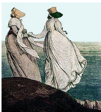
Slika 2. Paletot haljine

Ranih 1800-ih ljudi su počeli hrliti na plažu radi odmora i zabave. Uvođenjem željeznica, plaže su postale još popularnija mjesta za rekreaciju i relaksaciju. Uz zabavu na otvorenome, pojavila se i potreba za stilskim odjevnim predmetima. Iako je kupanje u moru bilo moderno u 18. stoljeću, smatralo se ispravnim da koža mora ostati bijela i netaknuta sunčevim zrakama. Sredinom 19. stoljeća kupaće haljine prekrivale su većinu ženskog tijela (Taylor, 2017). Žene su nosile turske hlače (dimije) i paletot haljine (polukružni kaput ravnih leđa bez pojasa). U blizini plaža, ljudi su se presvlačili u tzv. kućicama na kotačima . Te kućice su se nalazile u mjestu gdje je voda bila vrlo plitka. Ovaj izum omogućio je viktorijanskoj ženi da njezin dan proveden na plaži bude sasvim privatn (Victoriana Magazine, 2021). Kupaći kostim obično je bio opremljen s dugim, crnim čarapama, čipkastim papučama i otmjenim kapama. On je viktorijanskoj ženi sprječavao boravak u vodi (Lenček, Bosker, 2000: 27). Papuče za kupanje bile su potrebne radi zaštite stopala od školjki i kamenčića.