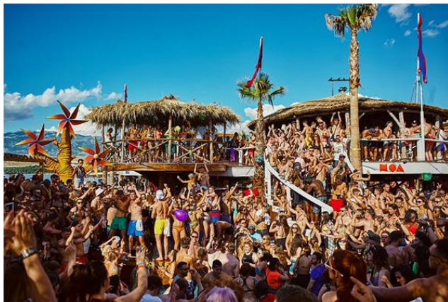
Slika 13. Zrće, Novalja, Pag

Velik broj plaža na hrvatskom Jadranu prikladan je za cijelu obitelj. No ipak, postoje neke plaže koja su zbog svojih ljepota i ponuda u prednosti. Tako se ističu Zlatni rat, Zaton kraj Zadra, Kraljičina plaža (Nin), plaže okolo Opatije i Crikvenice, Bačvice (Split) itd. Plaže koje su pogodne za djecu i neplivače nalaze se u Loparu, Medulinu, Omišu i dr. Naturističke plaže najviše se nalaze u Istri i Kvarnerskom zaljevu. Naturističke plaže graniče izravno s naturističkim kampovima (Koversada između Poreča i Rovinja te Bunculuka u Baškoj na Krku). Na mnogim mjestima nalaze se podijeljene plaže (naturističke i obične). Dobar primjer je Zlatni rat i plaža Borik na Lošinju (Best of Croatia, 2021).