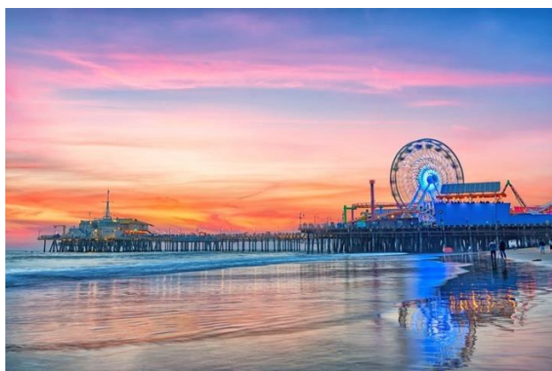
Slika 15. Santa Monica, Kalifornija

Plaža Santa Monica, u Kaliforniji, prepoznatljiva je svijetu po svome molu iz 1909. godine. Na tom molu mogu se pronaći ulični umjetnici, skateboarderi, roleri, biciklisti, vrtuljci, restorani, trgovine i Ferrisov kotač na solarni pogon. Godine 1920. počinje se razvijati odbojka na plaži i surfanje. Plažu danas krasi parkovi, igrališta, nekolicina hotela te biciklistička staza (Santa Monica Beach, 2021).