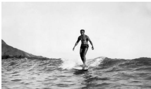
Slika 4. George Freeth

Korijeni surfanja potječu s Havaja i Polinezije, gdje su se tim sportom bavili i muškarci i žene. Početkom 20. stoljeća, istodobno s razvojem Havaja kao turističke destinacije, surfanje je oživjelo i brzo se proširilo na Kaliforniju i Australiju. Ključnu ulogu u popularizaciji surfanja su imali američki književnik Jack London i havajski surferi George Freeth i Duke Kahanamoku. Nakon posjeta Waikikiju, London je objavio nekoliko izvještaja o surfanju u popularnim američkim časopisima. Godine 1907. američki industrijalac Henry Huntington unajmio je Freetha kako bi pomogao pri promoviranju svoje nove željezničke linije do plaže Redondo (Kalifornija). Surfanje je doseglo vrhunac u SAD-u početkom 1960-ih uz pomoć glazbe, filmova i televizijskih programa posvećenim surfanju.