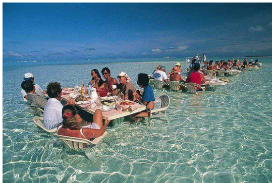
Slika 20. Bora Bora, Francuska Polinezija

U novije vrijeme kombiniraju se restorani sa svojom gastronomskom ponudom i užici boravljenja u vodi na pješčanoj plaži. Taj novi aspekt turističke ponude se može konzumirati na Bora Bori u Francuskoj Polineziji (gost može objedovati napola uronjen u Bora Bora's Ocean Restaurant ), odmaralištu Jumeirah Dhevanafushi na Maldivima (posjetitelju nudi mogućnost sjedenja u pješčanoj sofi ) i na plaži Michanwi Pingwe u Zanzibaru (gost može objedovati na vrhu stijene u restoranu Rock koji je okružen morem) (TravelRepublic, 2016).