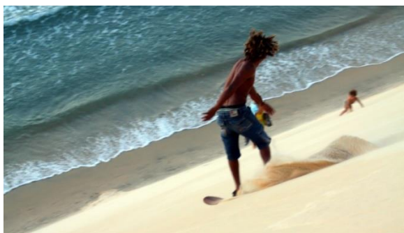
Slika 21. Plaža Genipabu, Brazil

Iako je odbojka omiljeni sport na plaži, treba istaknuti i galop na konju na plaži u Ocho Riosu na Jamajci. Od adrenalinskih i neobičnih aktivnosti poznat je zipline duž obale Labadee na Haitiju, sandboard na dinamama na plaži Genipabu u Brazilu, paragliding iznad obale Iquique u Čileu, flyboard na Tenerifima u Španjolskoj i aquabiking na Bora Bori (vožnja bicikla u moru i razgledavanje morskog života) (TravelRepublic, 2016). Festivali i zabava su karakteristični za plaže Andaluzije u Španjolskoj (zabava uz krijesove povodom festivala San Juan), dok je ples pod punim mjesecom karakterističan za plaže otoka Koh Phangan na Tajlandu (TravelRepublic, 2016).