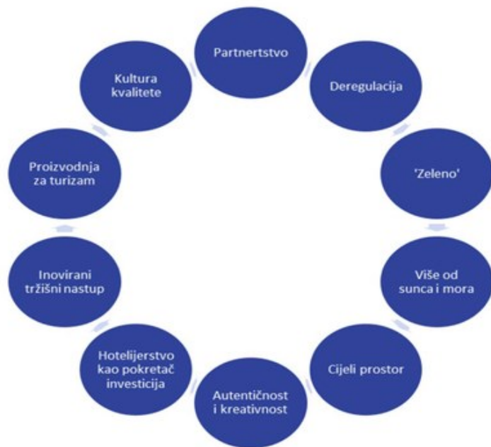
Slika 2 Razvojna načela hrvatskog turizma do 2020. godine