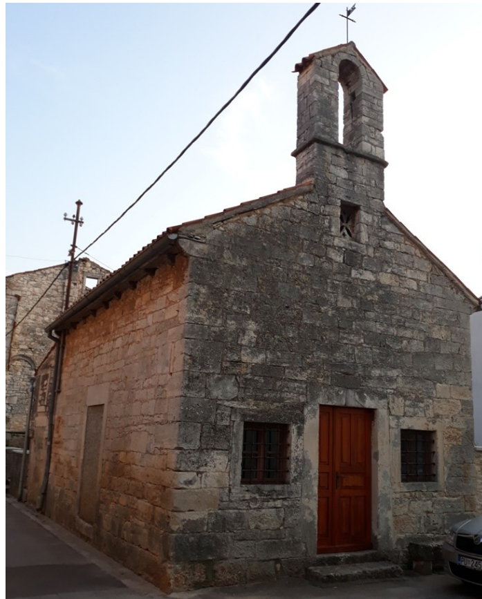
Slika 10. Crkva sv. Antuna Opata

Crkva se nalazi blizu trga u Savičenti, datira iz 14. stoljeća i izražava osebujnu ljepotu pučke gotičke arhitekture iz 15. stoljeća po svojim obilježjima. Tlocrt je nepravilnog oblika s preslicom koja ima jedno okno, također ima suženu i nadsvođenu apsidu. Zidana je s pravilnim i lijepo klesanim tesancima koji su bili jednake visine i nizani su u pravilnim redovima (slika 10). Na pročelju se nalaze vrata i dva prozora, a iznad vrata se nalazi jedan otvor monolitne tranzene. U unutrašnjosti se nalazi gotički kameni kip zaštitnika crkve sv. Antuna. U crkvi se bogoslužje obavlja 17. siječnja na blagdan sv. Antuna (Milovan, 2016., str. 45.).