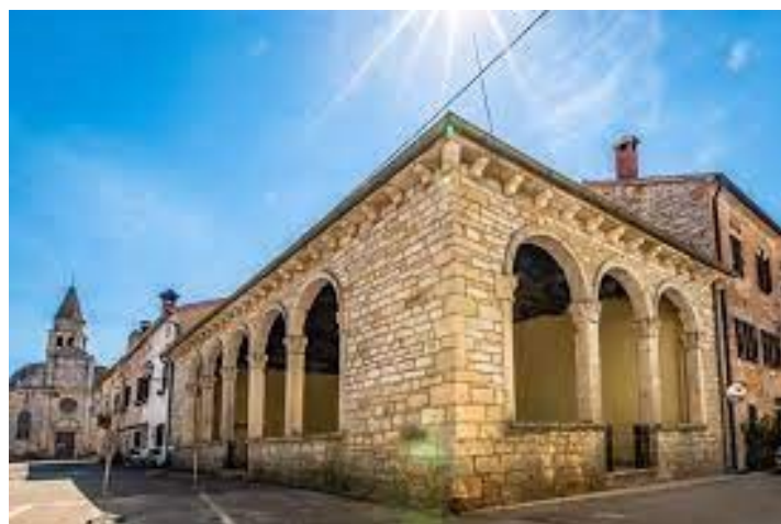
Slika 5. Gradska loža ( https://www.glasistre.hr/istra/zasticene-renesansne-jezgre-opcine-svetvincenat-nastavak-valorizacije-kulturne-jezgre-svetvincenta-eu-sredstvima-648082 [7. rujna 2021.]).