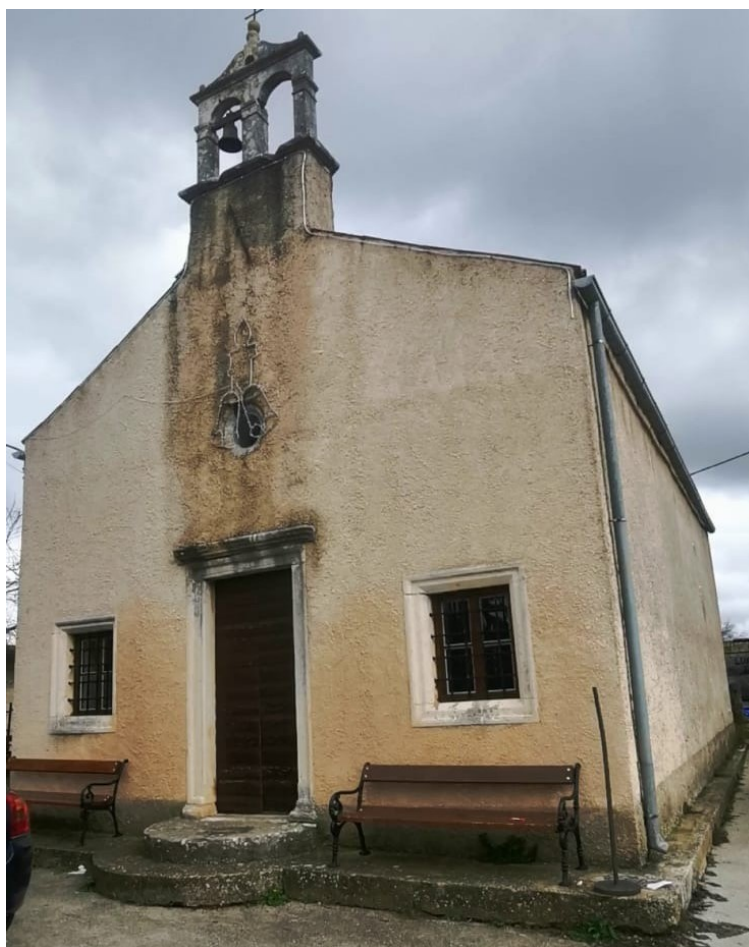
Slika 11. Crkva sv. Roka

Ova se crkva nalazi na sjeveroistoku Savičente, što je nekada bilo izvan gradskog naselja, a potječe iz 1622. Sagrađena je po narudžbi koju je napravila Bratovština bičevalaca sv. Roka. Vrlo je zanimljiva njezina arhitektura jer nastavlja tip crkve istarske srednjovjekovne arhitekture, a na pročelju se nalazi preslica s dva okna (slika 11). U unutrašnjosti crkve postoji slika na bočnom oltaru, nastala u 18. stoljeću, restaurirana i odnesena u župnu crkvu, a prikazuje svece i Presveto Trojstvo, no venecijanski slikar je nepoznat. Na glavnom oltaru se nalazi kip sv. Roka napravljen od drva. Crkva je u potpunosti obnovljena 1912., tada je uklonjena i lopica koja je bila ispred crkve, a na njezinome mjestu ostao je ogradni zid koji je također uklonjen 1970-ih. Zadnja obnova je bila 1988. Jednom godišnje u crkvi se održava sv. Misa na blagdan sv. Roka 16. kolovoza (Milovan, 2016., str. 45.).