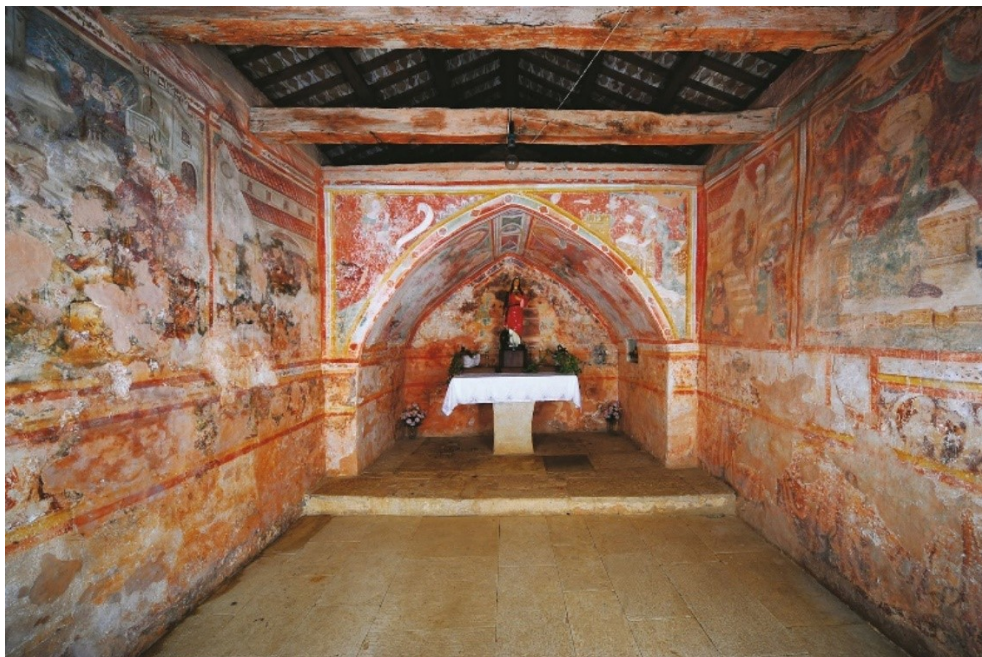
Slika 9. Unutrašnjost (freske) crkve sv. Katarine ( https://www.istrapedia.hr/en/natuknice/1581/freske-u-svetvincentu-savicenti [7. rujna 2021.]).