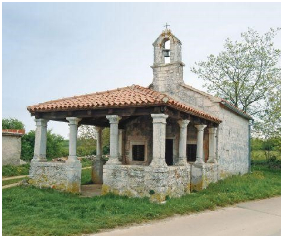
Slika 8. Crkva sv. Katarine ( https://www.istria-culture.com/crkva-sv-katarine-u-svetvincentu-i25 [7. rujna 2021.]).