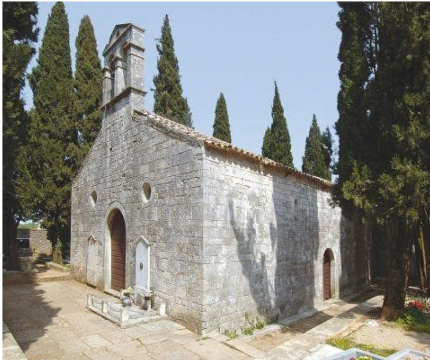
Slika 6. Crkva Sv. Vincencija/ Vincenta

Iako se nalazi u okolici Pule, Savičenta je u srednjem vijeku bio pod vlašću Porečke biskupije. Nekada je na tom mjestu gdje je sada crkva bio benediktinski samostan. Godine 1178. poznati papa Aleksandar III. potvrdio je crkvu sv. Vinka Porečkom biskupu. Savičenta, odnosno okrug opatije svetog Vincenta, spominje se u najznačajnijem istarskom dokumentu (Istarski razvod) koji svjedoči o razvoju srednjovjekovnog naselja oko samostana. Crkva je promijenila razne vlasnike, sve do 1523. kada je postala posjed mletačke obitelji Morosini, kada je stekla današnji renesansni izgled (slika 6). Danas je ta crkva jedini ostatak samostana koji je postojao 1314. Vrlo je zanimljiva s arhitektonskog gledišta, kao jednobrodna crkva s tri učajurene apside (Bistrović, 2011., str. 204.).