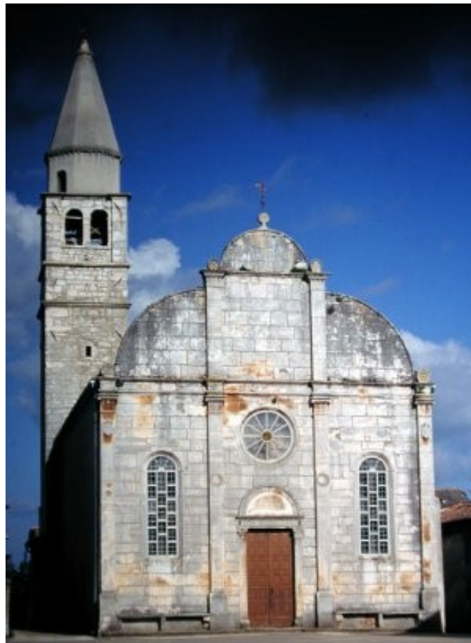
Slika 12. Crkva Navještenja Blažene Djevice Marije

napore u projektiranju, osim vrlo konkretnog zadatka. Crkva je prilagođena jednostavnosti sredine i zahtjevima investitora Morosinija, što je i razumljivo s obzirom na to da je izgrađena na privatnom posjedu s privatnim kapitalom, u isto vrijeme kada i ostatak renesansnog kompleksa na području trga. Pročelje je podijeljeno vertikalno na tri podjednaka dijela. Bočne trećine imaju završetak zabata u obliku četvrtine kruga, a srednji dio u obliku polukruga. U bočnim su donjim dijelovima napravljeni visoki uski prozori s nadvojem polukružnog oblika, a u sredini tipični je renesansni portal polukružnih luneta. Jednostavna rozeta kružnog oblika postavljena je neposredno iznad portala na prvoj etaži. Glavni ulaz ima tipični renesansni portal, gdje dva pilastra nose ravni profilirani nadvratnik i luk (slika 12) (Vučić, 1996., str. 337. – 351.).