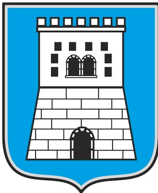
Slika 1. Grb Općine Svetvinčenat ( http://svetvincenat.hr/wp-content/uploads/2017/06/Grb-op%C4%87ine.jpg [7. rujna 2021.]).