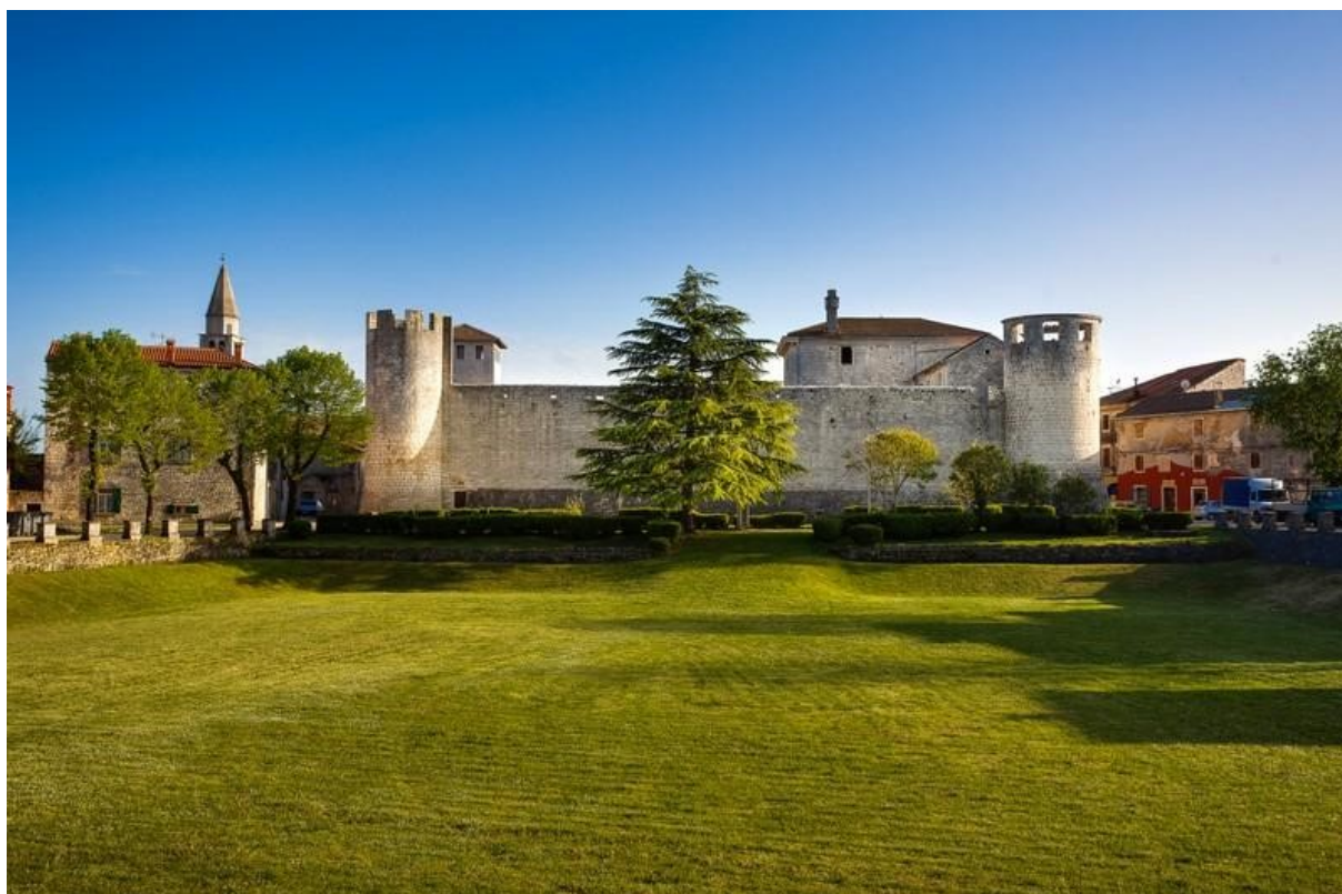
Slika 2. Sjeverni obrambeni plašt kaštela Morosini - Grimani

graditelj (Castropola) odlučio smjestiti palaču-donjon na neko mjesto koje će protivnicima otežati napad. Obrambeni zid kaštela (sjeverni) smjestili su na sam rub jedne od velikih vrtača (udubina), time su si bar malo olakšali samu obranu. Tu je poziciju na kraju 15. stoljeća dosljedno pratio i graditelj Morosini. On je odlučio sjeverni obrambeni zid produžiti prema istoku, odmah do velike vrtache („Žlinja“). Zbog toga je veličina cijelog obrambenog plašta i samog sjevernog zida dobila značajno veliku dimenziju, a to je uvelike pridonijelo dojmu neosvojivosti i sigurnosti (Slika 2) (Vučić, 1999., str. 108. – 109.).