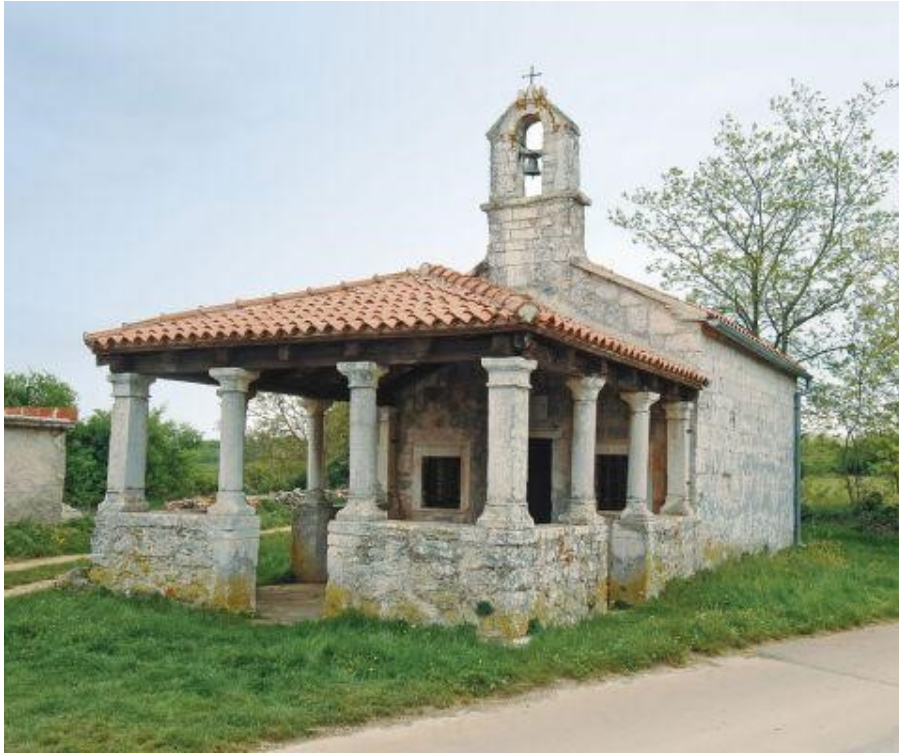
Slika 8. Crkva sv. Katarine ( https://www.istria-culture.com/crkva-sv-katarine-u-svetvincentu-i25 [7. rujna 2021.]).