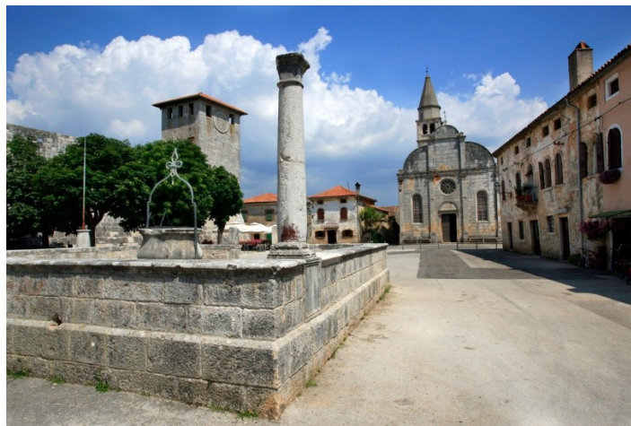
Slika 4. Gradski trg ( https://www.istria-culture.com/trg-i-zupna-crkva-u-svetvincentu-i90 [7. rujna 2021.]).

polukružnom obliku koje su simetrično postavljene. Istočno postavljena župna crkva datira s kraja 15. stoljeća, a dovršena je vjerojatno 1529. Pročelje crkve koje gleda na trg je pojednostavljeno, ali ima trolisni završetak kakav je također moguće pronaći u Veneciji; također pročelje sadrži i grb obitelji Morosini. Gradska loža koja datira iz 18. stoljeća nalazi se na južnoj strani trga, ima otvoreni trijem i šest arkada koje krase elegantni lukovi (slika 5). Loža ima jedan ulaz koji se otvara prema ulici, on ne gleda prema trgu, dok drugi ulaz vodi na gradski trg ( http://tz-svetvincenat.hr/placa/ [3. srpnja 2021.]).