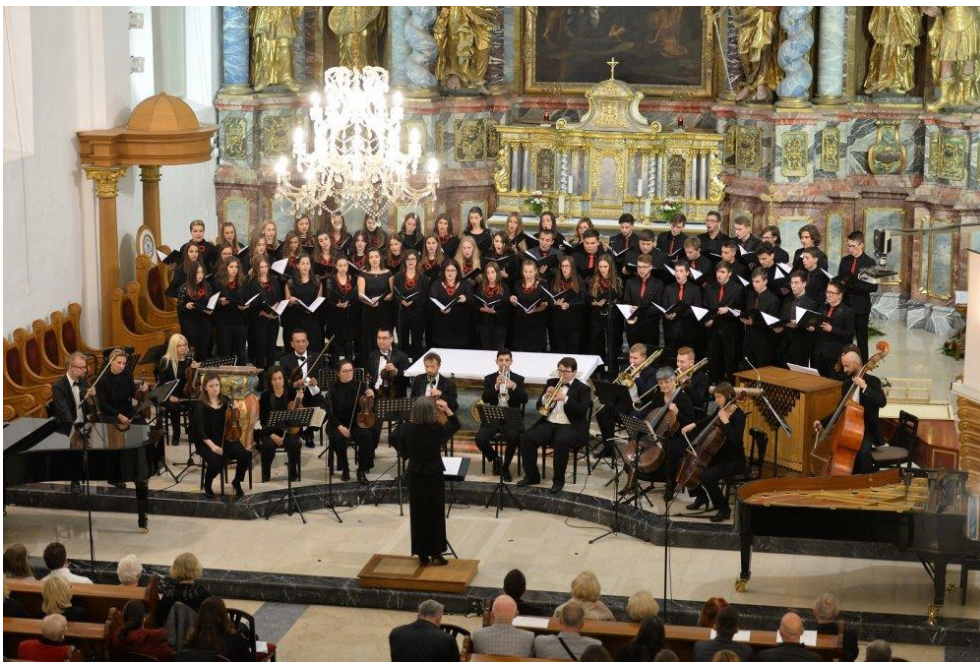
Slika 10. Mješoviti zbor učenika Glazbene škole u Varaždinu u varaždinskoj katedrali na Varaždinskim baroknim večerima 2018. godine.

dvoranama i dvorcima. Barokne večeri doduše nisu namijenjene susretima zborova, već svim izvođačima barokne glazbe među koje ubrajamo i izvođače s varaždinskog područja. Tako Maričić govori o redovitom sudjelovanju varaždinskih instrumentalnih ansambala, kulturno-umjetničkih društava, amaterskih zborova, te školskih zborova osnovnih i srednjih škola, a posebno o višegodišnjem sudjelovanju Djevojačkog i Mješovitog zbora Glazbene škole u Varaždinu (Slika 10.). 20