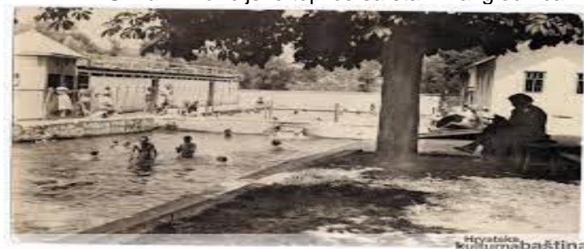
Slika 1. Tuheljske toplice sa starih razglednica