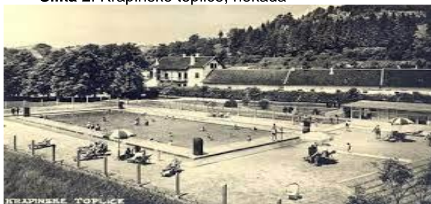
Slika 2. Krapinske toplice, nekada