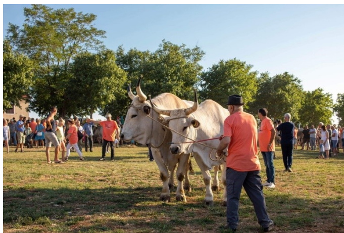
Slika 7. Smotra goveda na Jakovlji

Poput većine manifestacija sličnog sadržaja, i Jakovlja se održava subotom i to posljednje subote mjeseca srpnja. Feštu čine smotra i ocjenjivanje volova na sajmištu u Kanfanaru, razne popratne kulturne, umjetničke manifestacije i sportski sadržaji. 95