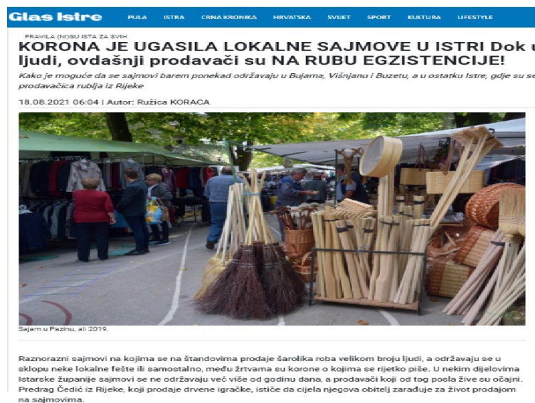
Slika 8. Otkazani lokalni sajmovi

'U Barbanu je sve spremno za 46. Trku na prstenac. Tradicija se nastavlja i njeguje u Barbanu usprkos novim uvjetima održavanja. Pridržavat će se svih naloženih mjera zbog epidemiološke situacije, a podijelit će se posjetiteljima i besplatne ulaznice kako bi se lakše kontrolirao ulaz te održao red na gledalištu. Posjetitelji će moći nazočiti manifestaciji uz predloženu COVID-potvrdu o preboljenju, potvrdu o testiranju s negativnim rezultatom ne stariju od 48 sati ili COVID-putovnicu, sve prema odredbi Stožera civilne zaštite RH. Za sve posjetitelje koji nemaju potvrde, organizirali smo brzo antigensko testiranje koje će biti moguće obaviti u centru Barbana'. 102 Iako se Trka na prstenac kao manifestacija uslijed mjera i restrikcija tradicionalno održala, sajmovi kao mjesto trgovanja i zabave su najčešće bili otkazani.