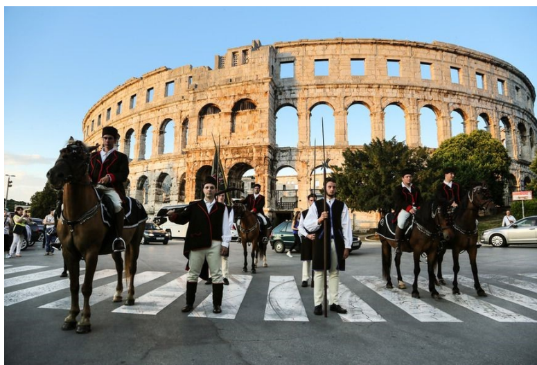
Slika 5. Svečani jubilej Trke na prstenac u Puli

Viteška je to igra izvođena pravilima i zabavom kroz natjecanje, događaj koji spaja prošlost i buduća vremena. Danas usprkos modernijim vremenima Trka na prstenac, uz svoje brojne gledatelje koji zadržavaju svoj fokus tijekom trke, svake je godine bogatija i dodatnim programima. Također i mjesto Barban tada je veća atrakcija koju pohode domaći lokalni ljudi i turisti. Kako bi obilježila svoju obljetnicu, 1996. Trka na prstenac krenula je u 'goste' svečanim mimohodom, gostujući na terenu u drevnoj Puli. 75 Bila je to atrakcija i uprizorenje stare viteške igre u antičkoj Areni, što je uostalom spoj dvaju povijesnih segmenata kulturne i nematerijalna baštine. Nadalje i 2016. je ponovljen jubilejni 'defile' te su se centrom Pule predstavili konjanici i kopljonoše.