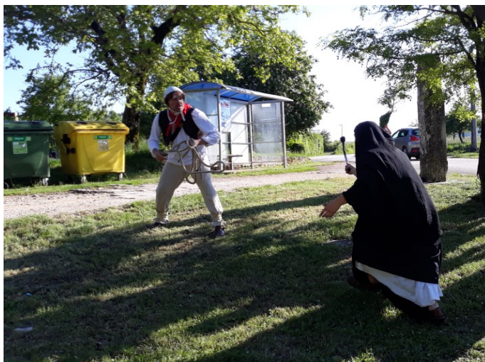
Slika 3. Predstava borbe štrige i krsnika

Osim molitva, postojala su i druga, različita 'zaštitna' sredstva, poput nošenja uglavnom bršljana, blagoslovljene grančice masline, češnjaka, kao i ugljen od krijesa od dana kada bi se obilježavao Sv. Ivan. Sve navedeno ljudi bi postavili u cipelu, džep ili ušili u odjevni predmet. Crvena boja predstavljala je glavnu simboliku borbe protiv uroka, kao i odjevni predmet obučen naopačke. 46