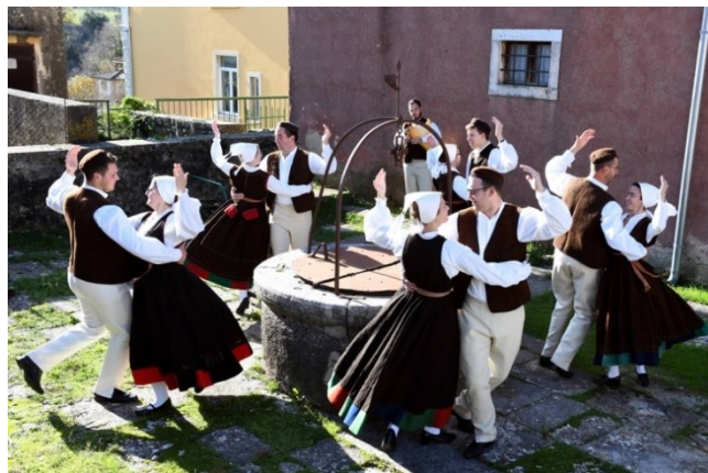
Slika 1. Tradicionalni istarski ples - balun

Društveni odnosi su u velikoj mjeri utjecali na razvoj nematerijalne baštine. Ti društveni odnosi ostavili su svoj trag i na plesnu umjetnost u Istri. Od starih seoskih i poseljačkih plesova do današnjih modernih, vjerovanje je bio bitan segment. Ljudi su tada tumačili kako plesom, igrom i sviranjem mogu pozitivno utjecati na plodnost, dobar lov ili zaštitu od zlih namjera. Najrazvijeniji i najpoznatiji oblik plesanja jednolično raspoređenih po kružnici je balon. Balon je, dakle, najrašireniji istarski ples, ne izvodi se isto u raznim krajevima u Istri.