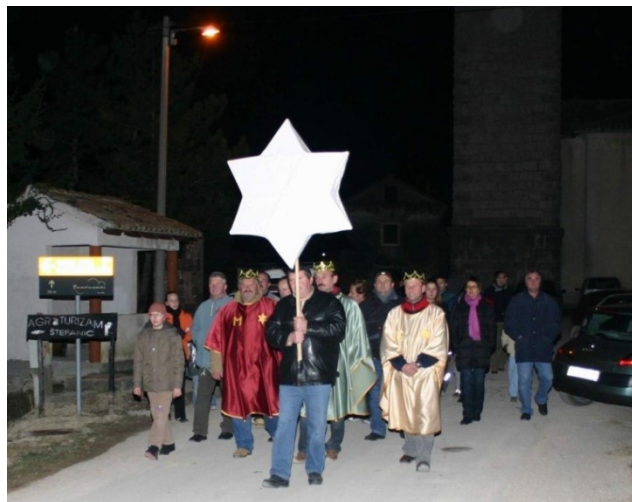
Slika 2. Kaldirski kolejani

Nakon Božićnog ugođaja i običaja, Staru se godinu u Istri ispraćalo s pjevanjem i plesom, s nadom i vjerovanjem da će sljedeća godina biti bolja od prethodne. Ako se Stara godina ispraćivala iz gostionica, mještani bi svi zajedno pjevali, dok bi mladi najčešće plesali po starinski, većinom tada valcer, polku ili najpoznatiji balun. 22 Tijekom proslave Stare i na dan Nove godine mlađe generacije bi se uputile u ' kolejane '. Kada se čulo da se kolejani približavaju, gospodar i gospodarica kuće pripremili bi im dar, te bi zatim s njima ako bi imali instrumente i zasvirali. Domaćice bi ih ponudile najčešće vinom ili rakijom, dali koju kobasicu, komad pršuta ili jaje, što bi naravno još bilo popraćeno raznim slatkim slasticama.