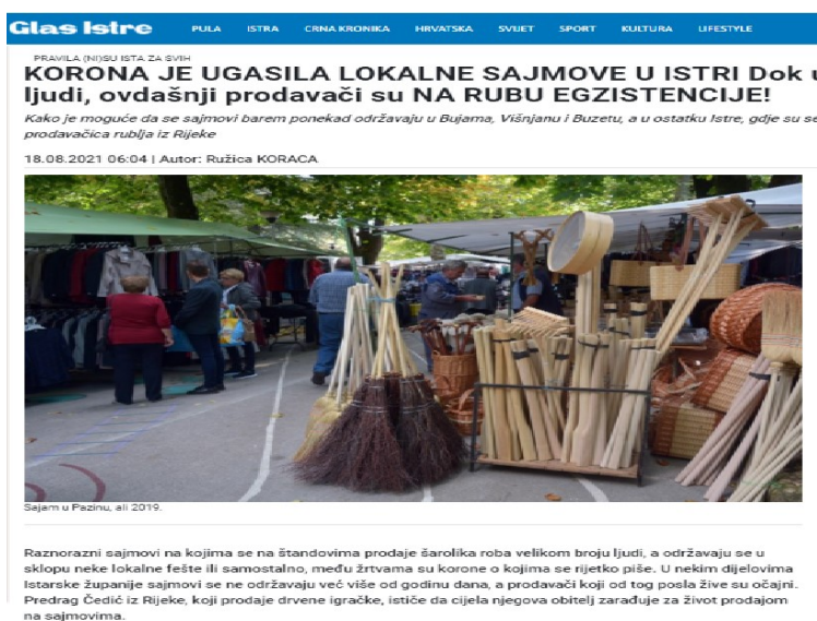
Slika 8. Otkazani lokalni sajmovi

'U Barbanu je sve spremno za 46. Trku na prstenac. Tradicija se nastavlja i njeguje u Barbanu usprkos novim uvjetima održavanja. Pridržavat će se svih naloženih mjera zbog epidemiološke situacije, a podijelit će se posjetiteljima i besplatne ulaznice kako bi se lakše kontrolirao ulaz te održao red na gledalištu. Posjetitelji će moći nazočiti manifestaciji uz predloženu COVID-potvrdu o preboljenju, potvrdu o testiranju s negativnim rezultatom ne stariju od 48 sati ili COVID-putovnicu, sve prema odredbi Stožera civilne zaštite RH. Za sve posjetitelje koji nemaju potvrde, organizirali smo brzo antigensko testiranje koje će biti moguće obaviti u centru Barbana'. 102 Iako se Trka na prstenac kao manifestacija uslijed mjera i restrikcija tradicionalno održala, sajmovi kao mjesto trgovanja i zabave su najčešće bili otkazani.