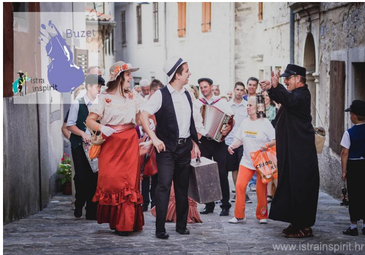
Slika 6. Predstava na 'Subotini po starinski'

Manifestacija započinje u 12 sati kampelanjem , podizanjem zastave i ulaskom stoljetne Sokolske glazbe u grad te navođenjem programa koji će se zbivati na pojedinim punktovima. Svakim punim satom se na nekom od trgova izvodi neki 'jači' program, primjerice: ples na trgu, prezentacija i revija, koncert i drugo. 87 Cilj organiziranja događaja jest da se kroz program upozna nasljeđe grada i njegovih mještana. Tim povodom upotpunjuje se već bogati program s predstavom u kojoj se nastoji što više približiti autohtonom identitetu, da se čuje stari buzetski govor, zapleše po starinski i iznese koja anegdota ili zanimljivost.