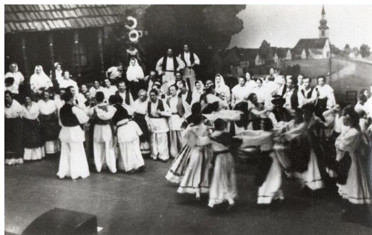
Fotografija br. 3: Kolo iz operete