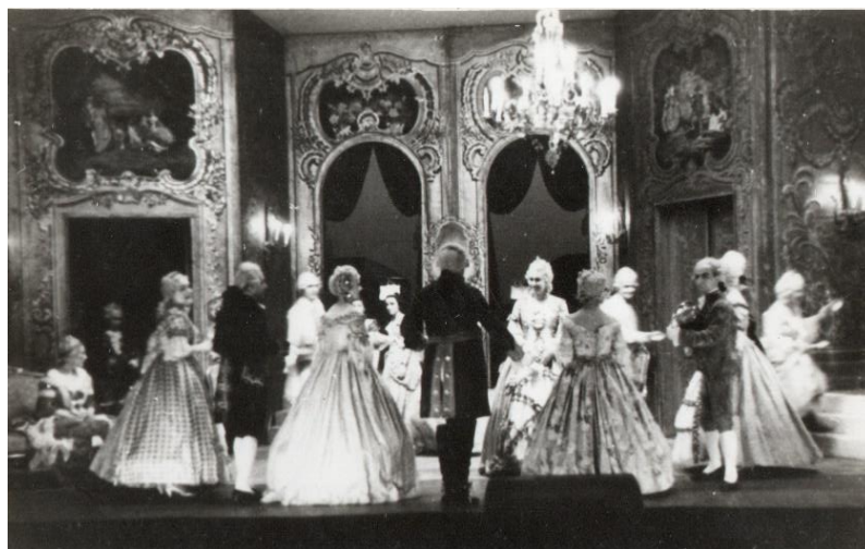
Fotografija br.4: Prizor iz trećeg čina