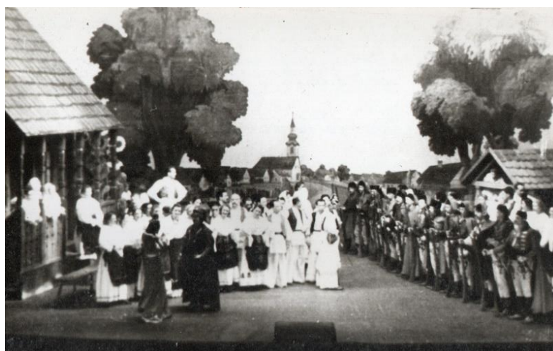
Fotografija br.2: Prizor iz prvog čina operete „Barun Trenk“