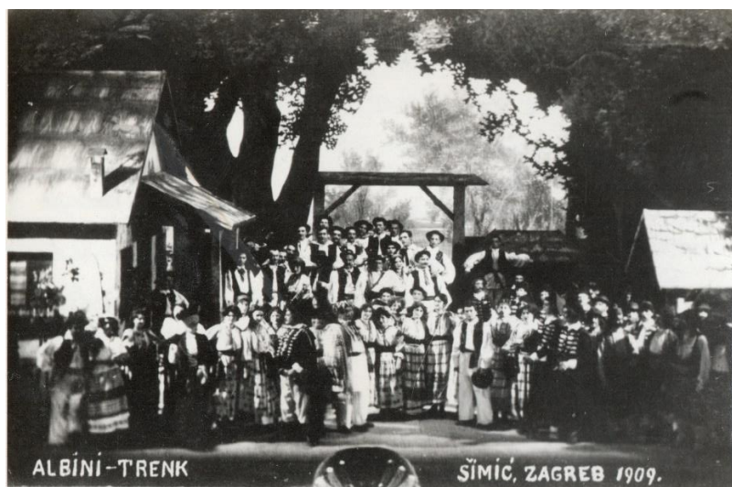
Fotografija br.1: Izvedba operete u Zagrebu