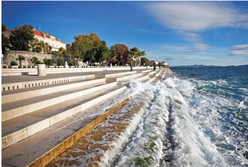
Slika 6. Morske orgulje

smještenim u hodniku ispod obalne šetnice, odakle zvuk izlazi u prostor šetnice kroz male otvore u kamenu 24 . Jačina vjetra i valova utječe na jačinu zvuka. Instrument ima sedam klastera, po pet biranih tonova izvedenih iz matrice dalmatinskog klapskog pjevanja.