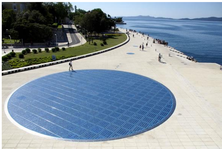
Slika 7. Pozdrav Suncu danju

Instalacija Pozdrav Suncu, kao model sunčeva sustava s pripadajućim planetama, povezana je s Morskim orguljama čiji se zvuk transponira u svjetlosnu igru koja na zadarskoj rivi nastupa nakon zalaska sunca (sl.8). Pozdrav Suncu je najatraktivnije mjesto u gradu za posjetitelje.