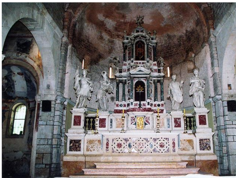
Slika 2. Kipovi zaštitnika grada Zadra