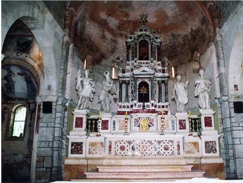
Slika 2. Kipovi zaštitnika grada Zadra