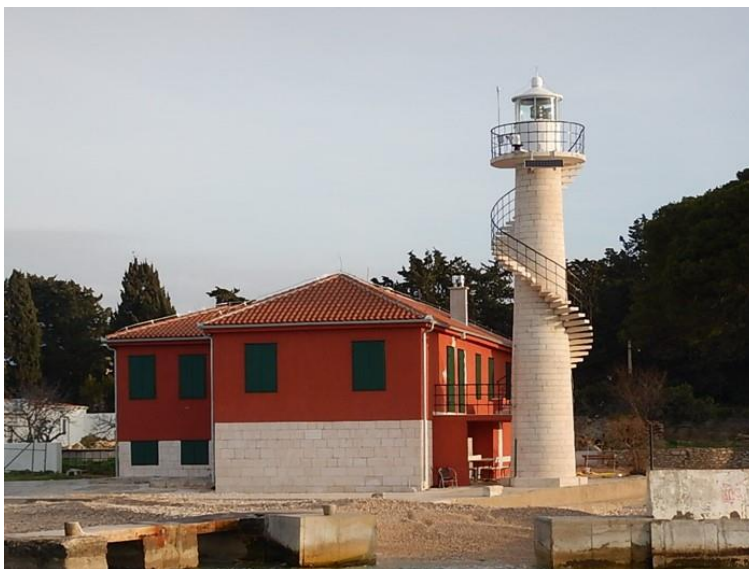
Slika 5. Svjetionik Oštri rat i svjetioničareva kuća

Za svjetionik se veže priča o kralju koji je bio moćan. Upravo ta moć i vlast su mu omogućili da ucjenjuje i iskorištava benediktinke. Ta priča potječe iz davnina prije izgradnje svjetionika, ali događala se na mjestu današnjeg svjetionika 22 .