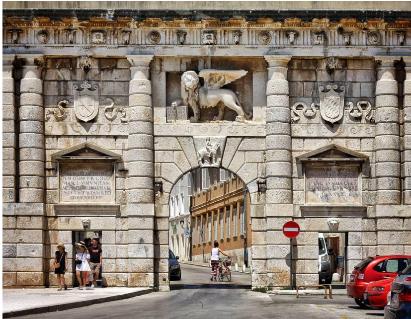
Slika 3. Kopnena vrata

zadarskim bedemima dugim tri kilometra, uvrštena na popis UNESCO-a. Od srpnja 2017. Zadar se nalazi na popisu UNESCO-ve kulturne baštine 14 .