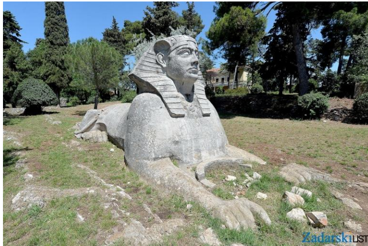
Slika 4. Sfinga

U ovom dijelu Europe sfinge su prava rijetkost, a zadarska najveća od svih. Zadarska sfinga je vrlo posebno zato što je izgrađena u znak sjećanja na voljenu ženu. Romantična legenda kaže da ispunjava ljubavne želje.