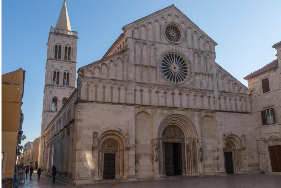
Slika 1. Rozete na crkvi sv. Stošije

Izvor: https://www.antenzadar.hr/clanak/2019/12/citateljica-u-soku-ostali-smo-zacudeni-vidjevsi-vrata-zadarske-katedrale-zakljucanim/ (15. kolovoza 2020.)