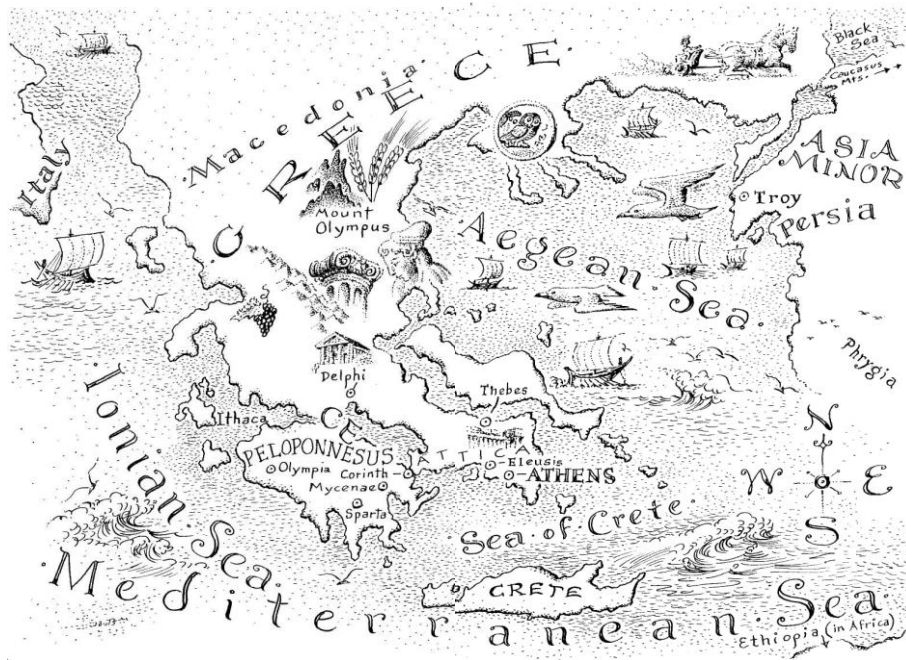
Slika 2. Karta Grčke

Houle (2001: 12) govori kako su stari Grci vjerovali da bogovi žive na planini Olimp, u Tesaliji, središnjem dijelu Grčke. Međutim, prema grčkoj tradiciji, bogovi su imali slobodu, nisu bili zatvoreni na planini te su mogli ići bilo kamo. To potkrjepljuju sami mitovi i legende koji su govorili o bogovima koji su imali ljudski oblik, živjeli i komunicirali s ljudima. Unutar panteona bogovi su često stupali u bračne zajednice, što je isto bio slučaj i u japanskoj mitologiji, a neki od njih istodobno su imali više supružnika ili partnera. Ponekad su se bogovi vjenčavali sa svojom braćom i sestrama, roditeljima ili djecom.