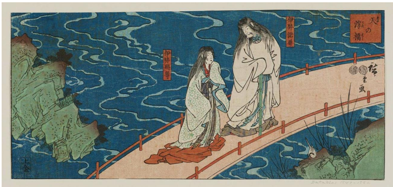
Slika 3. Utagawa Hiroshige, Bogovi Izanagi i Izanami na Plutajućem nebeskom mostu, broj 1 iz serije Ilustrirana povijest Japana , https://ukiyo-e.org/image/chazen/1980_2149

Izanami i Izanagi stajali su na Plutajućem mostu i miješali vodu ispod sebe kopljem praveći određeni zvuk (jap. koworo koworo ni ) 2 .“ Kada su ponovno podigli koplje, sol se iscijedila s njegova vrha te je od tih kapi nastao prvi otok. Bio je to otok Onogoro. U ovom se tekstu spominje draguljsko koplje koje se na japanskom jeziku zove Ame-no-nuboko . Spominje se i Plutajući most ili Ame-no-ukihashi kao most preko kojega su božanska bića putovala između neba i zemlje.