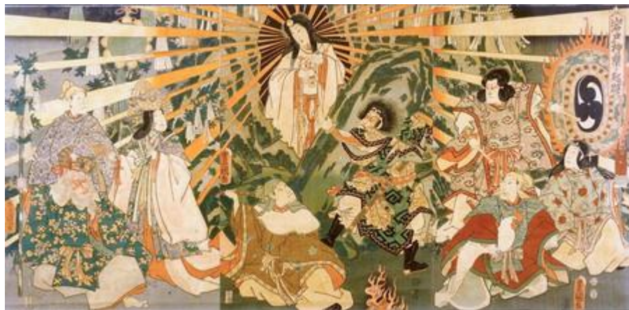
Slika 1, Amaterasu, božica Sunca i zaštitnica carskog klana, izlazi iz špilje

Prema japanskoj mitologiji postoji više od osam milijuna kamija . Ovaj broj nije zamišljen kao neki određeni broj, jedan je od načina da se kaže bezbroj ili beskonačno, jer su sve i svi potencijalno kami . Od tih bezbrojnih ili osam milijuna kamija , neki su poput bogova i božica Grčke i Egipta. Svaki kami ima svoje osobine koje se općenito mogu klasificirati u tri skupine. „Svaki kami ima tri mitama (duše ili prirode): aramitama (grubost i divljina), nigimitama (nježnost i briga za život), i sakimitama (briga za druge i njegovanje). Jedna od ovih priroda može prevladati u bilo kojem određenom mitu: Susano-wo obično izražava svoje aramitama, dok Amaterasu obično izražava nigimitama“ Ashkenazi (2003: 31). Svaki kami ima i svoju nadležnost ili ulogu kao što su stvaranje svijeta, upravljanje nekim aspektom prirode, zaštite nekog objekta, teritorija ili skupine ljudi (npr. određenog klana), ozdravljenja itd. (Levin, 2008: 33 – 34).