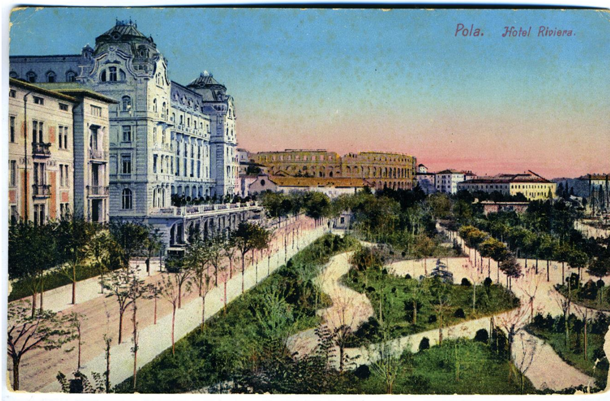
Slika 4: Hotel Riviera