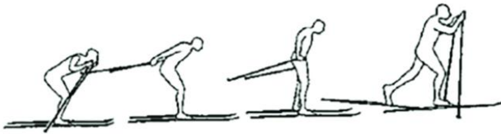
Slika 8. Korak sa suručnim odguravanjem

(Izvor: https://www.researchgate.net/figure/Overview-of-the-techniques , 9.8.2021.)