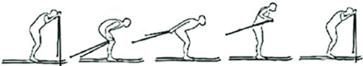
Slika 9. Suručno odguravanje

Skijaš se suručno odguruje objema rukama i neprestano klizi na obje skije. Ovaj se element upotrebljava na vodoravnom terenu kod odlične kliznosti te na blažim spustovima kod slabije kliznosti podloge. Ciklus kretanja je dug od četiri do osam metara te traje od sedam stotinki do dvije sekunde.