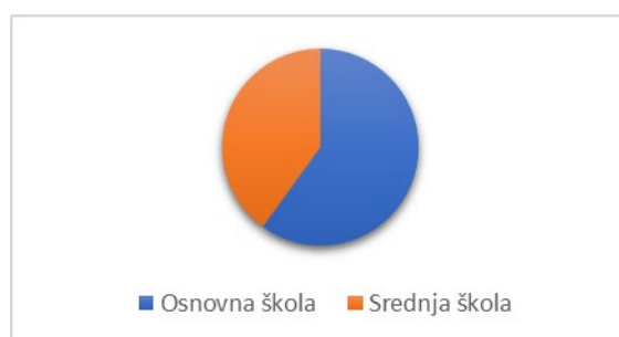
Grafikon 1. Prikaz sudionika po školama

U osnovnim školama, 6 (10,0%) ispitanika pripada grupi od 5 godina i manje radnog staža. 10 (16,7%) ispitanika pripada grupi 6 do 10 godina radnog staža, a 11 (18,3%) ih pripada grupi od 11 do 15 godina radnog staža. Njih 13 (21,7%) pripadaju grupi 16 do 20 godina radnog staža, a 4 (6,7%) pripada grupi od 21-25 godina radnog staža. 8 (13,3%) ispitanika čini grupu od 26-30 godina radnog staža, a ujedno i 8 (13,3%) čini grupu od 31 i više godina radnog staža što se vidi u tablici 2.