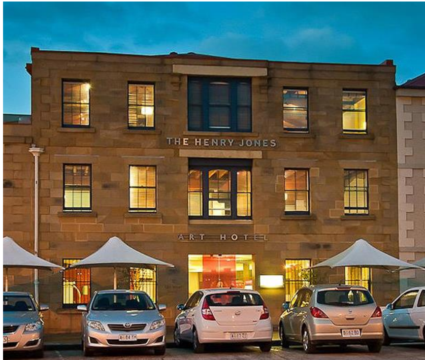
Slika 21. The Henry Jones art hotel – eksterijer