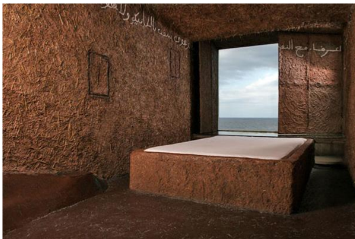
Slika 16. Atelier sul mare – interijer

vrlo su uobičajeni u hotelu. 63 Osim toga, mnoge drevne umjetnosti i ruševine nekoliko minuta autom ili vlakom. Nekoliko kilometara od hotela može se posjetiti park Fiumara d'Arte, najveći regionalni muzej suvremenih skulptura u Europi. Park je realizirao Antonio Presti koji iskorištava prirodni krajolik kako bi došao do simbioze umjetnosti i prirode, a zainteresiranim posjetiteljima pruža priliku istraživanja skrovitih i utabanih mjesta.