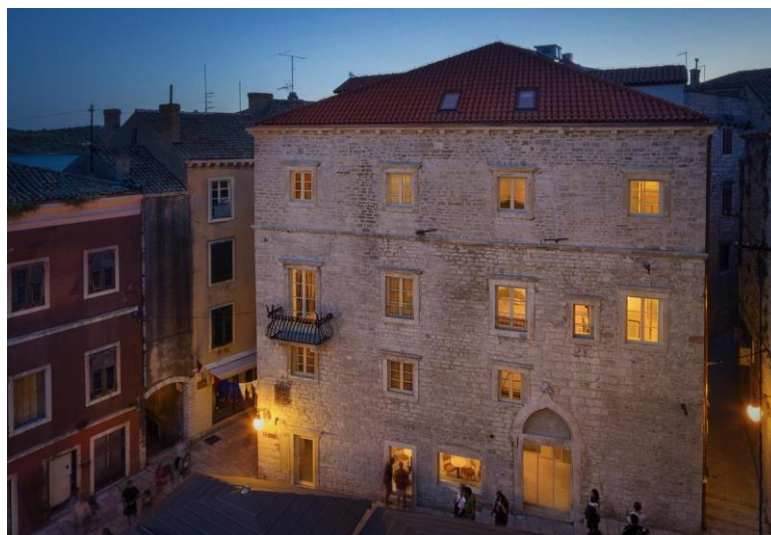
Slika 8. Heritage hotel Life palace – eksterijer