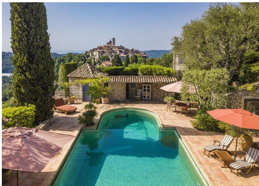
Slika 18. La colombe d'or – eksterijer