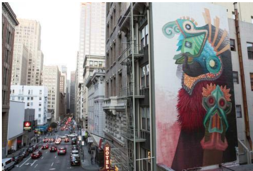
Slika 22. Hotel des arts – eksterijer