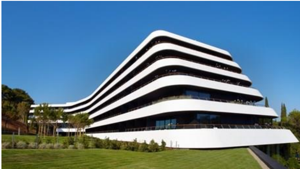
Slika 1. Hotel Lone – eksterijer