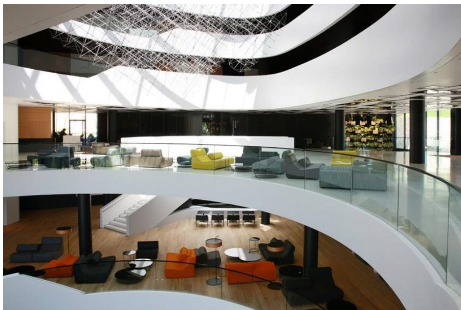
Slika 2. Hotel Lone – interijer

Hotel Lone je primjeren primjer hotela inspiriranog kulturom i spoja suvremenosti i luksuza s tradicijom i kulturnom baštinom. Hrvatski najbolji dizajneri i arhitekti su stvorili ovaj hotel, a hrvatski najbolji umjetnici su ga estetski ukasili kako bi klijent doživio vizualno autentično iskustvo. Svaki detalj hotela u gostima budi želju za istraživanjem, baš kao što bi to učinio Muzej suvremene umjetnosti. Dizajn hotela je sinergija funkcionalnosti i elegancije, a naglasak je na umjetnosti. Odredište za