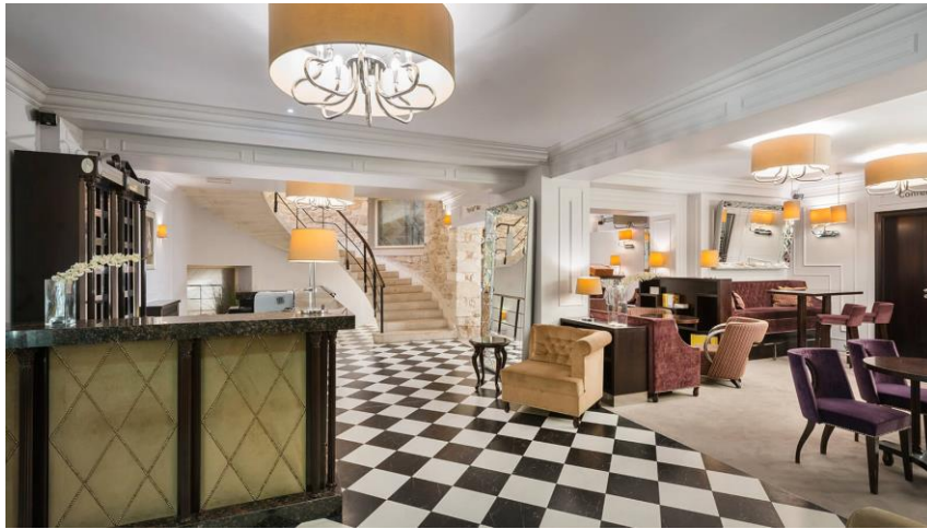
Slika 10. Hotel Bastion – interijer