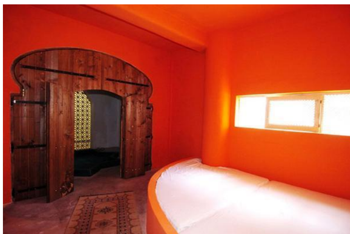
Slika 17. Atelier sul mare – interijer