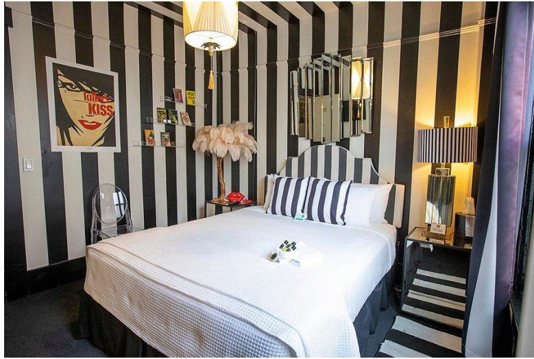
Slika 21. Hotel des arts – interijer

drugih tradicionalnih restorana. U blizini su travari, pekare, suvenirnice, koktel i karaoke barovi, hramovi i Muzej Kineskog povijesnog društva Amerike. 67