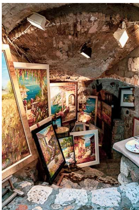
Slika 19. La colombe d'or – interijer