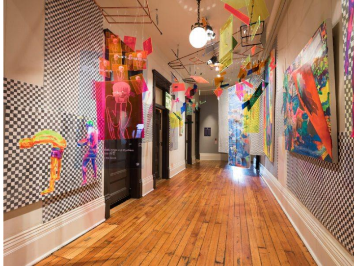
Slika 24. Hotel Gladstone – interijer