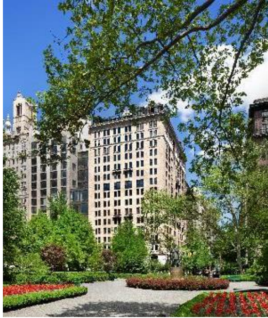
Slika 14. Gramercy Park hotel – eksterijer