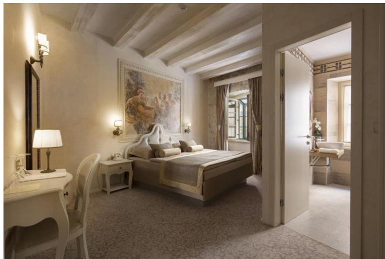
Slika 7. Heritage hotel Life palace – interijer

Sobe su dizajnirane s notom renesanse kao katedrala Sv. Jakova. Svaka soba ima Queen size krevet, kupaonicu, podno grijanje, klimu, sušilo, LCD TV, telefon, wifi, sef, mini bar, prilagodljiva svjetla. Ovaj je hotel također nepušačka zona. Svaka soba ima minimalno jedan arhitekturni detalj te zlatne murale slovenskog umjetnika. Pogledi su na trg, terasu i kalelargu. Kreativni Executive Chef Nicolas i Chef Santiago stavljaju naglasak na kvalitetu.