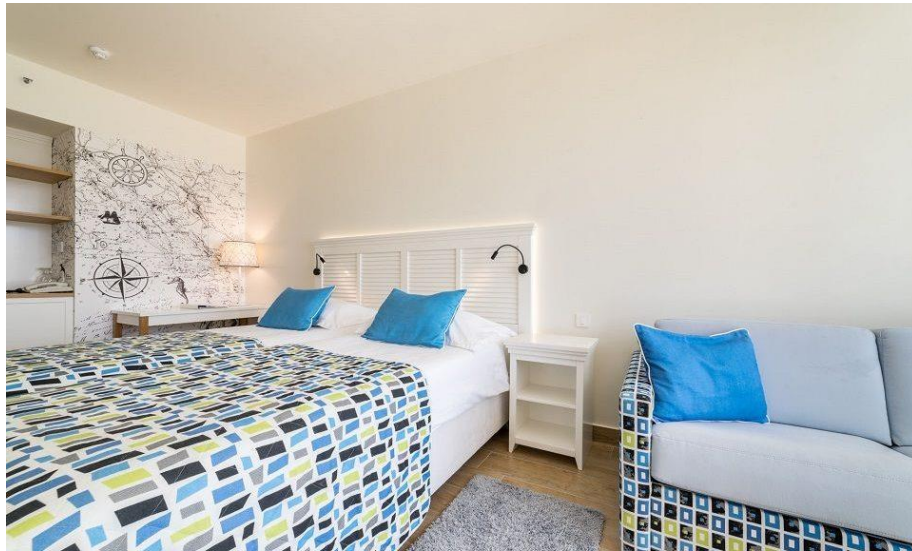
Slika 12. Hotel Jure dizajnerski hotel – interijer