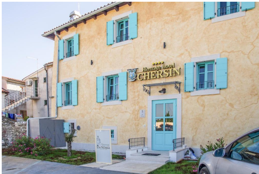
Slika 3. Hotel Chersin – eksterijer

Chersin 52 (sl. 2 i sl. 3) je baštinski hotel koji se nalazi u Fažani, starom ribarskom mjestu nasuprot Nacionalnog parka Brijuni. Hotel je u gradskoj kući koja datira iz 16. stoljeća. Kuća je obnovljena nakon prenamjene u hotel. Zgrada je zaštićena UNESCO-m. Pješčana plaža se nalazi pet minuta pješice od samog hotela. U blizini je grad Pula koji je bogat kulturnom baštinom iz Austro-ugarskog doba. Obitelj Chersin ima profesionalno i dugogodišnje iskustvo u turističkom sektoru. Sama obitelj vodi hotel i brine se da svaki gost ostvari ugodan boravak i ponese sa sobom trajne uspomene.