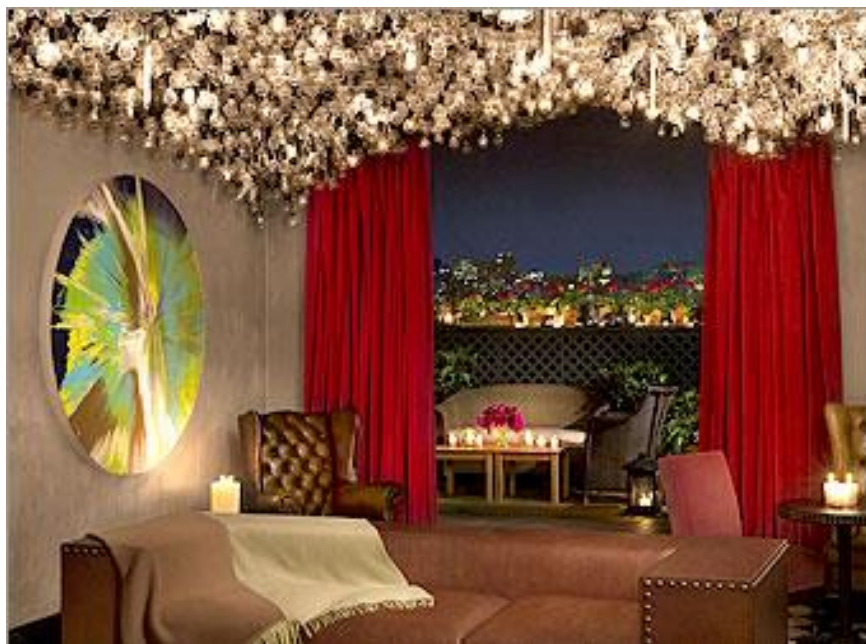
Slika 14. Gramercy Park hotel – interijer

Gramercy Park hotel (sl. 14 i sl. 15) se nalazi u New Yorku u SAD-u. Navedeni hotel ima uspinjanje u sobu pomoću instalacija te doručak s asocijacijom na privatni muzej.