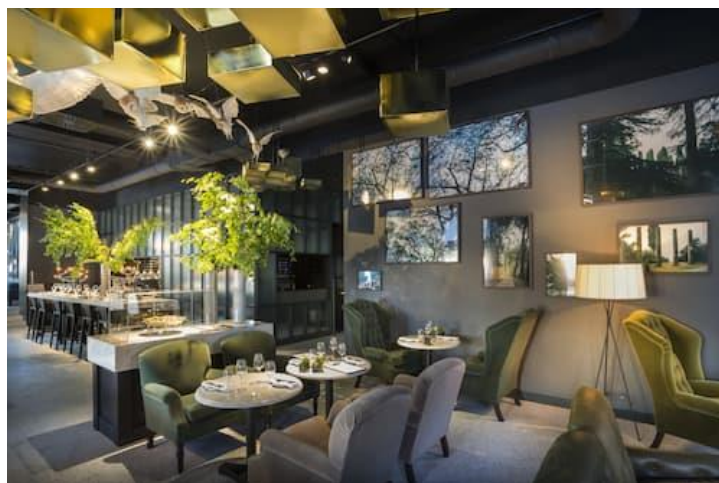
Slika 5. Hotel Adriatic- interijer

Brasserie Adriatic je hotelski restoran u francuskom stilu. Jela se pripremaju u otvorenoj kuhinji. Jelovnik se mijenja svaki dan. Caffe Bar Adriatic nudi najveći izbor viskija u Hrvatskoj (preko sto vrsta). Café Al Ponto ima kauč koji je dug čak osam metara. Unutrašnjost je cijela obnovljena osim kamenog stepeništa. Svakom je detalju pridodana posebna pažnja. Konoba Kanton nudi lokalna jela i ugođaj, kako turistima tako i mještanima.