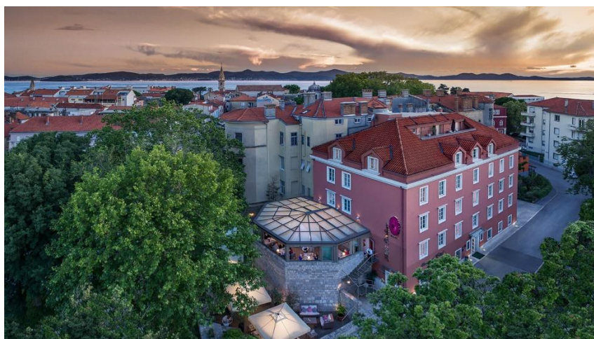
Slika 9. Hotel Bastion – eksterijer

Bastion heritage hotel (sl. 9 i sl. 10) se nalazi u staroj jezgri grada Zadra i nosi četiri zvjezdice. Namještaj je ručno izrađen a kuhinja je mediteranska. On je boutique hotel koji odiše kulturnim nasljeđem grada u kojem se nalazi. Zidine hotela datiraju iz 13. st. Kao i u Life Palace hotelu, Bastion se nalazi u neposrednoj blizini važnih atrakcija poput „Morskih orgulja“ i „Pozdrava suncu“. Hotel je prešao od zaboravljene znamenitosti do hotela s četiri zvjezdice. Zadar je nekoć bio obrambeni grad, a sada je mjesto uživanja u brojim hotelima baštine. Hotel su bili ostatci obrambene ugaone kugle, a sada je luksuzan i suvremeni objekt u okuženju opipljive povijesti i kontrasta. Ponuda vrhunskih vina je u hotelskom restoranu Kaštel. Vizija restorana se zasniva na namirnicama koje pričaju priču o tradiciji grada i okolice (domaći sir, maslinovo ulje i sl.) Važan je balans svježine i jednostavnosti jer strast za aromama je tipični sastav dalmatinske obiteljske kulture. Osim toga, mir duha i tijela je slogan wellness centa Castello . Wellness je inspiriran antičkim tajnama ljepote. Hotel ima i konferencijsku salu opremljenu suvremenom tehnologijom. 57 Hotel Bastion je smješten na izuzetno zahvalnoj lokaciji jer Zadar spaja čak pet Nacionalnih parkova i tri parka prirode. I bilo gdje da se kroči oko hotela, tu su već kročili Habsburgovci, Napoleon, Mlečani, Bizantinci, Rimljani i Iliri.