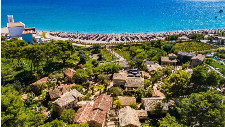
Slika 11. Amadria park