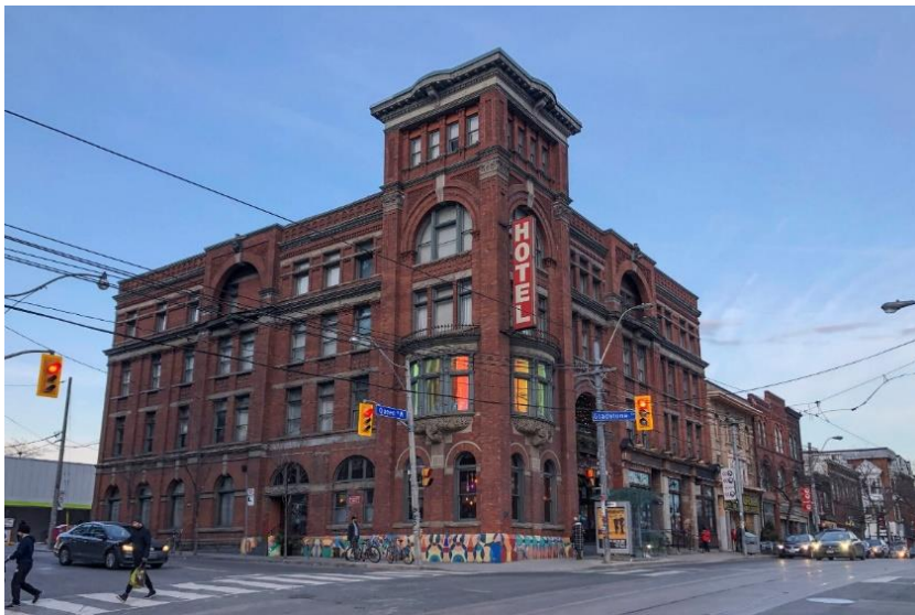
Slika 23. Hotel Gladstone – eksterijer

Hotel (sl. 23. i sl. 24) se nalazi u Torontu u Kanadi i ima sobe moderne industrijalizacije (motocikli, ulice, mapa, ruta). Smješten u West Queen Westu, jednom od najkreativnijih kvartova u Torontu, obnovljena kuća Gladstone zadržava naglasak na kulturi, umjetnosti i raznolikosti, osiguravajući da bogata povijest zgrade i kulturna izvorna arhitektura ostanu očuvani. 68