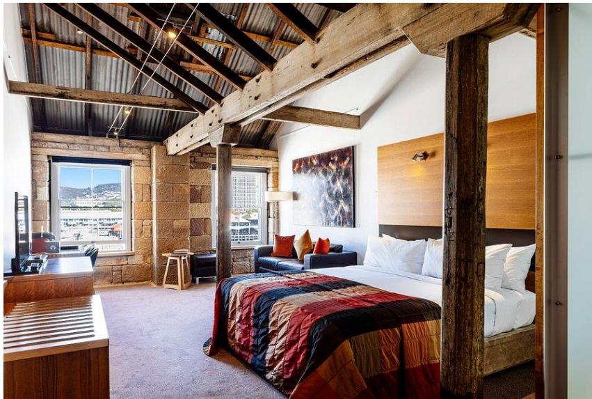
Slika 20. The Henry Jones art hotel – interijer

Hotel (sl. 20 i sl. 21) se nalazi u Hobartu u Australiji a sadrži prezentaciju umjetnika Tasmanije. Proglašen je Australiskim hotelom godine te dobio nagradu Australian Hotels Association Association za izvrsnost. U umjetničkom hotelu Henry Jones sudaraju se povijest i umjetnost. Najstarija skladišta na rivi u Hobartu pomno su prenamijenjena u prvi namjenski umjetnički hotel u Australiji. Smješten u predjelu Hunter Street, hotel spaja modernost s industrijskom prošlošću. Sobe obložene crnim drvetom preuređene su u apartmane za smještaj. Nakon uspona i pada industrije, danas ovo područje bruji s galerijama, nagrađivanim restoranima, barovima i kafićima. Pogledi s hotela je na užurbanu luku Mount Wellington. 65