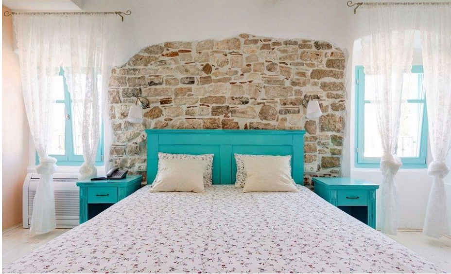
Slika 4. Hotel Chersin – interijer