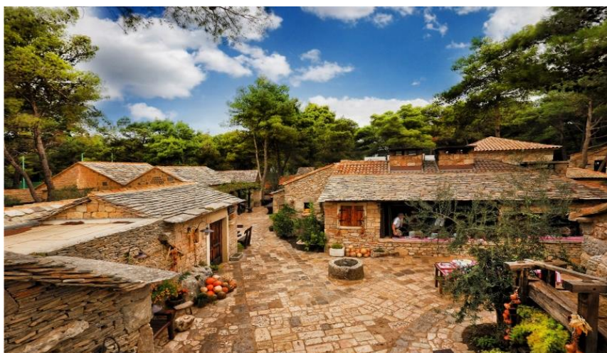
Slika 13. Dalmatinsko selo

U sklopu hotela Andrija se nalazi i vodeni park Aquapark Dalmatia sa šest tobogana, vodenom tvrđavom, rijekom, ležaljka i sl. To je prvi vodeni park u Dalmaciji. Kod hotela Jure se nalazi En Vogue Beach Club (18+ godina) s pogledom na jadransku obalu i šibenski arhipelag. To je luksuzni bar sa VIP uslugom na privatnoj plaži. 59