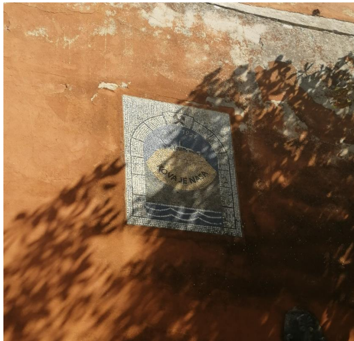
Slika 3. Grb s natpisom "Kova je nasa"