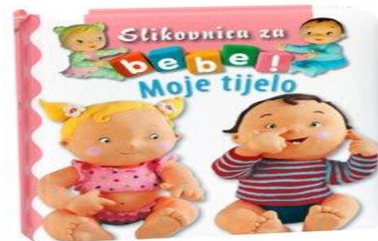
Slika 13. Slikovnica za bebe! Moje tijelo, https://www.hocuknjigu.hr/proizvodi/knjige/knjige-za-djecu/slikovnice/slikovnica-za-bebe-moje-tijelo (pristupljeno 27.8.2021.)