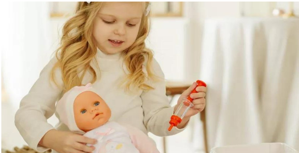
Slika 9. Simbolička igra s bebom, https://hr.pour-femme.org/8880633-symbolic-game-let39s-pretend-that-this-is-why-it-is-important-for-children (preuzeto 23. 8. 2021.)

Sposobnost simboličke igre jedan je od najvažnijih djetetovih razvojnih koraka. Dijete će se igrati onih aktivnosti kojima svakodnevno svjedoči. Između druge i četvrte godine djeca se igraju jednostavnih aktivnosti odraslih osoba koje svakodnevno gledaju (hranjenje, kuhanje, uspavlivanje) te najviše koriste lutke djevojčica, dječaka ili životinja. Od četvrte godine nadalje dječja igra je sve maštovitija i zahtjevnija zahvaljujući većoj tjelesnoj snazi, motoričkoj spretnosti, bogatijoj mašti i razvijenijem govoru. U igri s lutkom djeca govore i nastupaju s likovima lutki upotrebljavajući razne geste, govor ne bi li dočarala ono što zamišljaju.