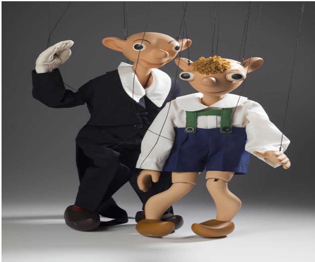
Slika 8. Spejbl i Hurvinek, https://muzeum-loutek.cz/en/73-home/galerie-loutek-na-titulce/254-spejbl-and-hurvinek (preuzeto 22. 8. 2021.)