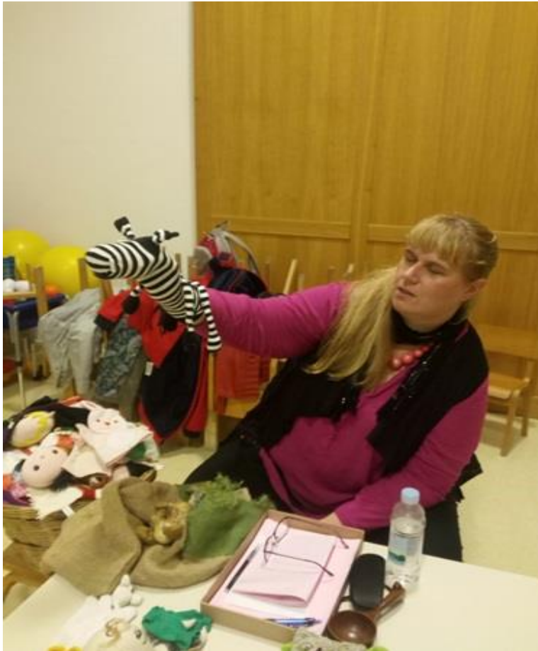
Slika 11. Odgojiteljica i lutka, https://dv-grlica.hr/2019/11/14/lutkarski-studio-kvak-u-djejem-vrtiu-grlica/ (pristupljeno 24. 8. 2021).