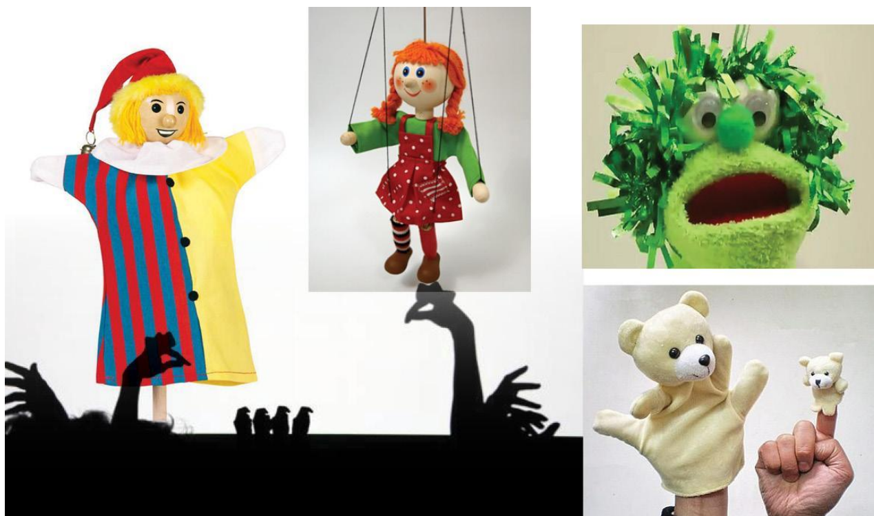
Slika 1. Scenske lutke, https://www.profil-klett.hr/lutka-prijatelj-i-suradnik-u-ucenju (preuzeto 21. 8. 2021.)