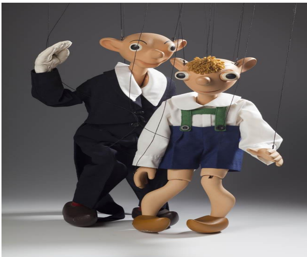
Slika 8. Spejbl i Hurvinek, https://muzeum-loutek.cz/en/73-home/galerie-loutek-na-titulce/254-spejbl-and-hurvinek (preuzeto 22. 8. 2021.)