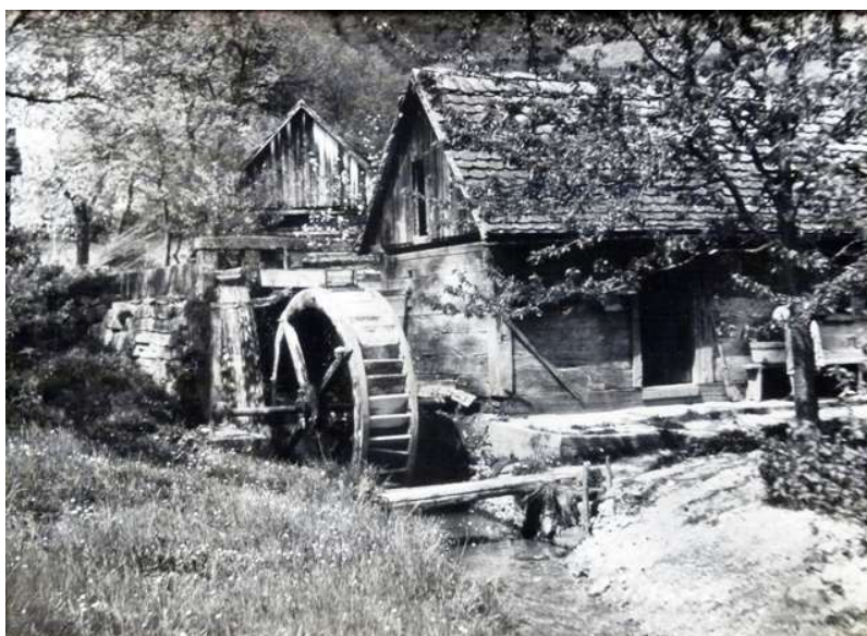
Slika 20. Medvednički mlinovi