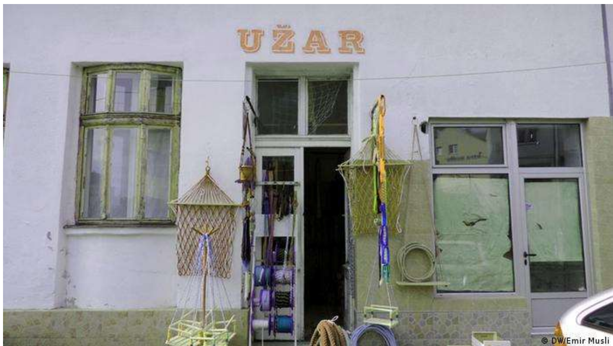
Slika 17. Užar

Kako na području Zagorja nije bilo mnogo izučenih užara, ovi koji su bili morali su ići po selima i tamošnjem stanovništvu izrađivati užad. Seljaci su najčešće sijali konoplju, dok su izučeni majstori kupovali gotovu sirovinu. Užad se prodavala na sajmovima i skupovima, a znalo se ići i u udaljenije krajeve. Izrađuju se razni alati poput mreža, povodaca, ulara, štrangi i dr. Prije se sve radilo ručno, dok se danas koriste razna pomagala i alati. Majstor užar morao je na sebi nositi obaveznu pregaču. O biljke lan dobivali su se najkvalitetniji užarski proizvodi. Majstori užari nisu imali pomoćnike, već su im pomagali članovi obitelji. Danas je taj obrt gotovo izumro, iako postoji velika potražnja za tim alatima osobito u poljodjelskim poslovima i seoskom gospodarstvu (Bašić, 1996., str. 20.).