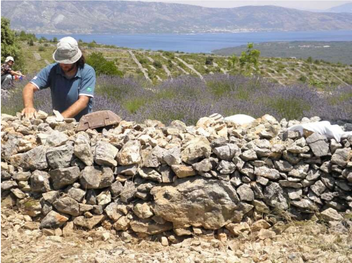
Slika 7. Suhozidna gradnja

i danas su majstori koji znaju graditi suhozid vrlo cijenjeni i skupo plaćeni jer je to vještina koja je iznimno teška i cijenjena, te je vrlo malo pravih znalaca gradnje suhozida, pa su izuzetno skupi i cijenjeni jer finalni proizvod oduzima dah. U svrhu turističke valorizacije može se vještina suhozida predstaviti posjetiteljima koji će biti ugodno iznenađeni i zadovoljni dobivenim sadržajem (Šrajer, 2019., str. 46. – 47.).