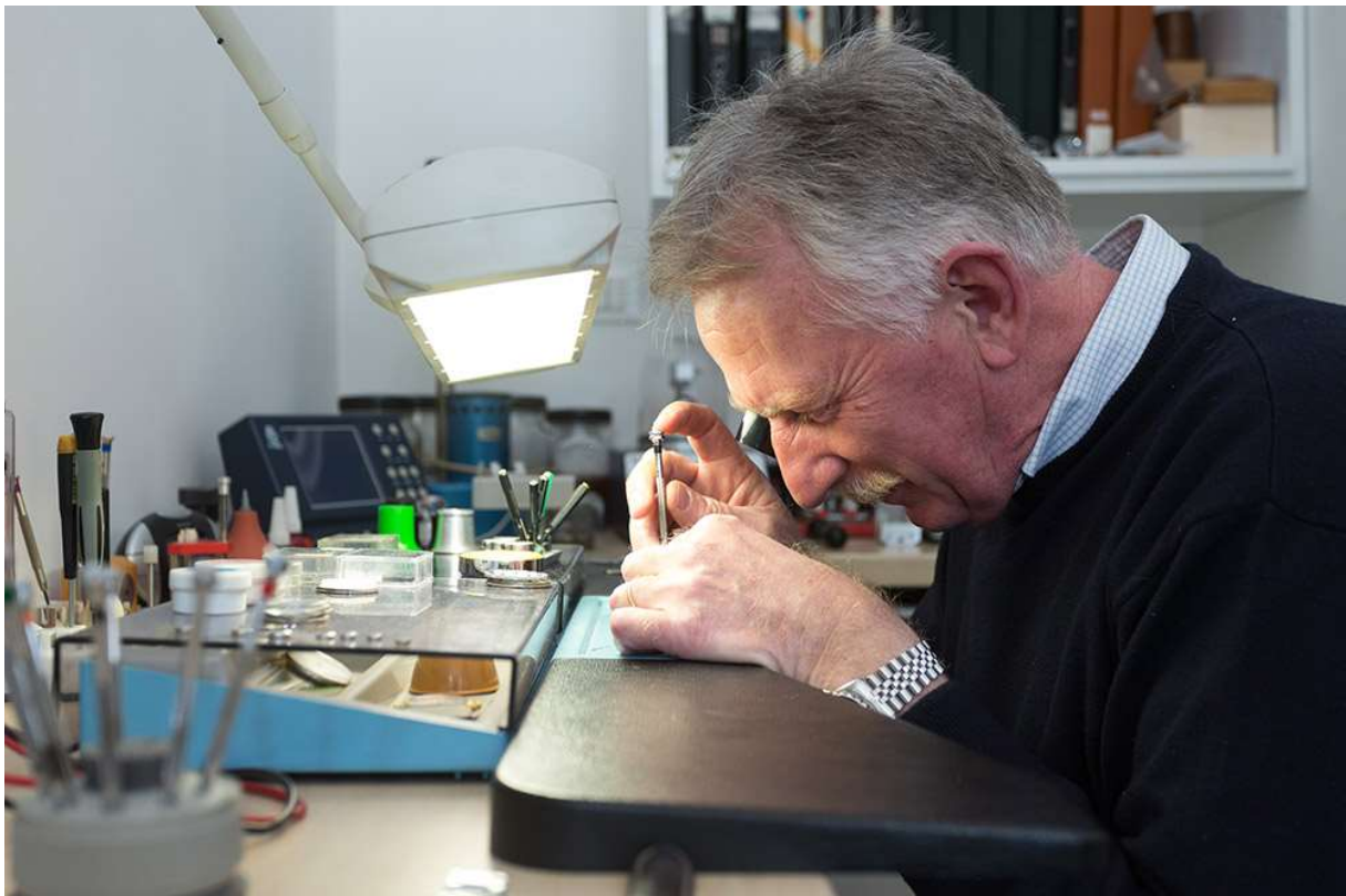
Slika 14. Urarski obrt

znali popravljati jednostavnije kvarove te seljakinja koje su podmazivale mehanizme. Zimi su urari obilazili po kućama stanovništvo i popravljali im satove, a sav potreban materijal i mehanizme kupovali su u Zagrebu. Neke dijelove su urari vrlo teško nabavljali jer su ih morali naručivati iz drugih zemalja, što je u ono vrijeme bilo iznimno teško. Urarski posao nije nimalo lagan, zahtjeva dosta znanja, mirnu ruku, precizno oko, stabilne živce i mnogo sati sjedenja. Alati koje urari koriste jesu tokarski stroj, nit mašina, rašpice, kliješta, četke, pincete, odvijači i dr. Sav urarski alat je minijaturan. Danas se mnogi satovi proizvode od plastike pa stoga nema niti svrhe popravljati ih. Kao i u stara vremena i danas se u nekim kućama mogu vidjeti zidne ure koje podsjećaju na dobra stara prošla vremena (Bašić, 1996., str. 22.).