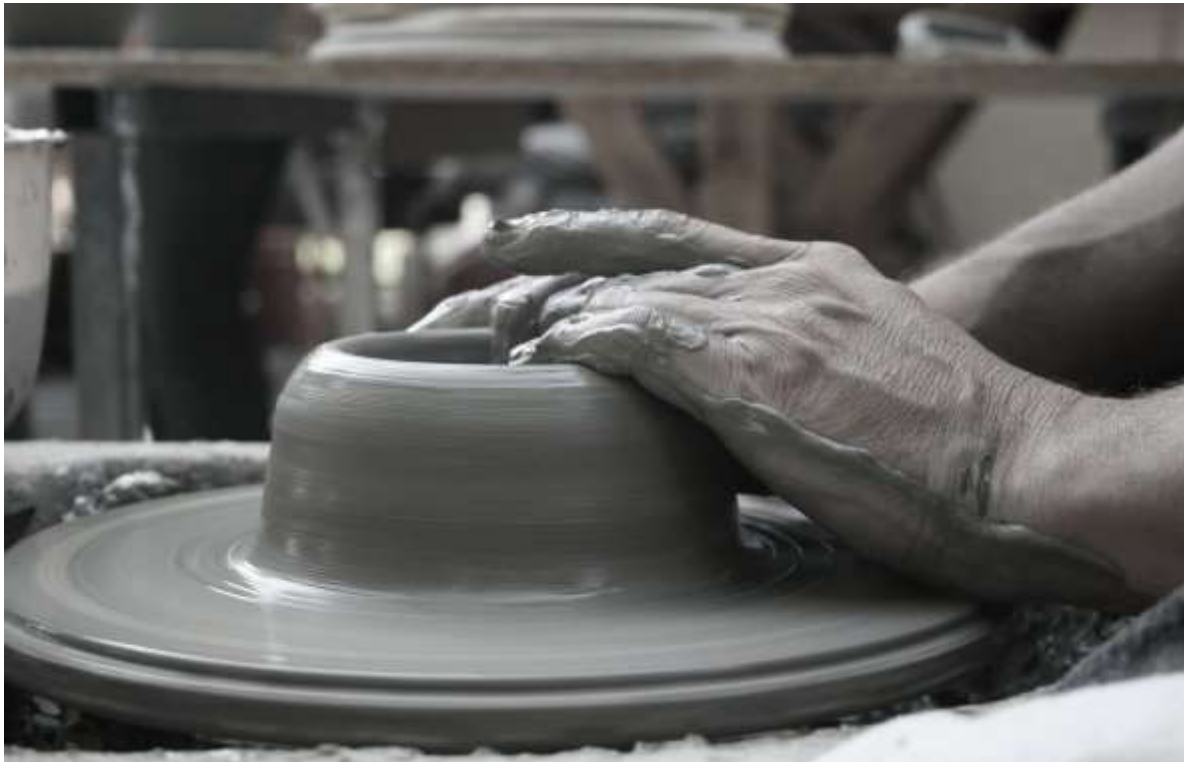
Slika 21. Izrada glinenih lonaca

Lončarstvo je umijeće izrade posuda od gline. Ono je u Hrvatskoj zaživjelo tijekom 20. stoljeća među seoskim stanovništvom, tamo gdje postojala lončarska zemlja, tamo su se ljudi bavili lončarstvom. Osnovni materijal za izgradnju lonaca jeste namočena glina koja se bosim nogama priprema za oblikovanje. Lončar najprije oblikuje dno posude, a zatim dodaje stjenke pažljivo oblikujući ih rukama. Kad se posude oblikuje, ono se zatim suši na zraku te se peče na otvorenoj vatri. Lončari su svojim loncima obilazili mjesta u priobalju, primjerice, prodavali su svoje proizvode u Raklju i Humu u Istri i ostalim mjestima. Nažalost, od polovice 20. stoljeća lončarstvo sve više zamire (Hefele, 2000., str. 72.-82.).