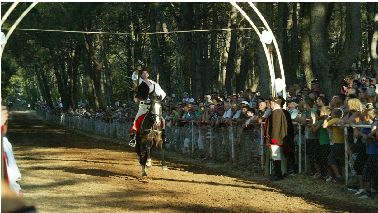
Slika 9. Trka na prstenac

Od 1976. u mjestu Barbanu održava se ponovno Trka na prstenac. Time se željelo opet vratiti ovu plemenitu konjičku igru koja je prvi put održana 1696. Diljem cijele Istre za vrijeme Mlečana održavala su se slična natjecanja, no njezinom propašću sva su se ona ugasila. Danas u Republici Hrvatskoj imamo dvije slične konjičke manifestacije, a to je uz Trku na prstenac i Sinjska alka. Trka na prstenac predstavlja žestoku borbu te iziskuje vješto jahanje i iznimno precizno gađanje. Konjanik mora pogoditi u sredinu mete, čime osvaja tri punta, odnosno boda. Konjanici ne smiju biti mlađi od 18 godina, niti stariji od 60 godina. Konjanik mora biti odjeven u tradicijsku odjeću, posjedovati odgovarajućeg i opremljenog konja te odgovarajuće koplje. (Centar za nematerijalnu kulturu Istre, 2019., str. 63. – 65.).