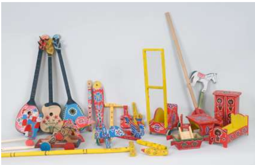
Drvene dječje područja zagorja

https://min-kulture.gov.hr/izdvojeno/nematerijalna-dobra-upisana-na-unesco-ov-reprezentativni-popis-nematerijalne-kulturne-bastine-covjecanstva/umijece-izrade-drvenih-tradicijskih-djecjih-igracaka-s-podrucja-hrvatskog-zagorja/16464 , 24.