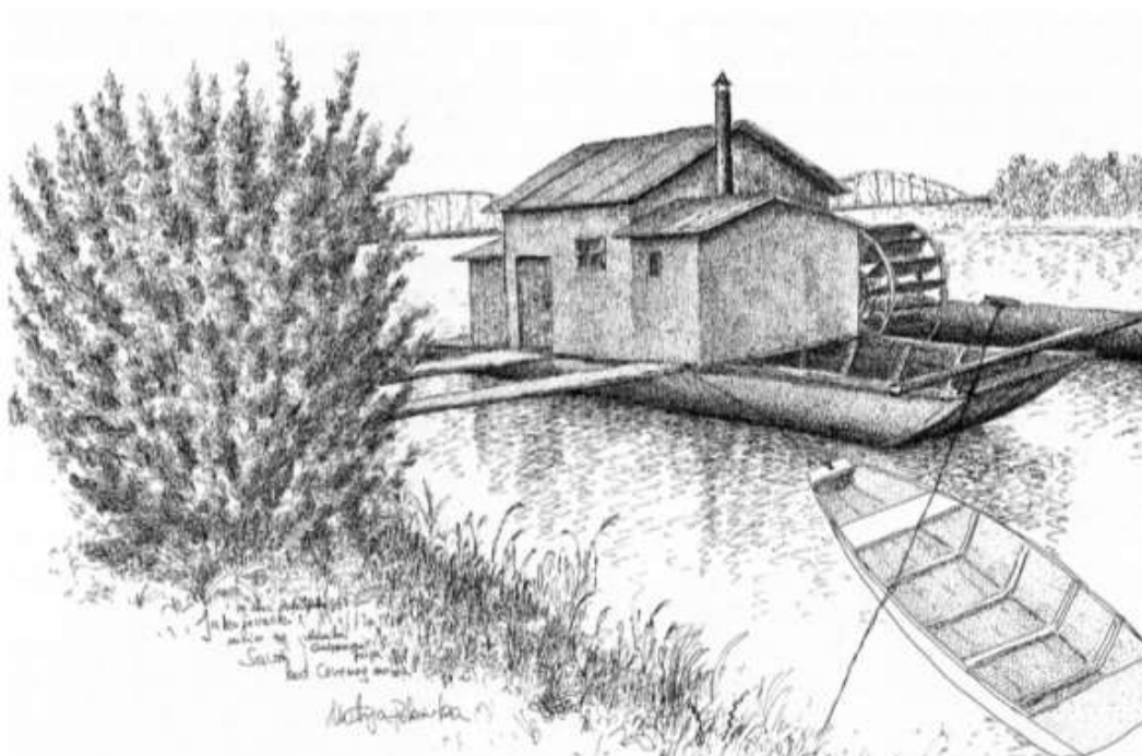
Slika 19. Nekadašnja vodenica kod Crvenog mosta na Savi kod Jakuševca