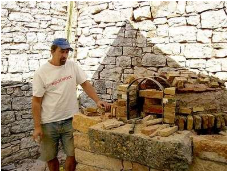
Slika 15. Stara krušna peć

Do 1885. u Krapini je radila tvornica kamenine. Nema mnogo izučenih keramičara i pećara u Zagorju. U početku su taj posao obavljali lončari, a tek kasnije u 19. stoljeću javljaju se pećari. Za taj posao ne treba mnogo alata, samo čekić, kliješta te mirne i spretno ruke. Keramičar postavlja pločice, a pećar ih održava i slaže. Ranije su se kalijeve peći svakih četiri do pet godina slagale, a danas se slažu svakih petnaest godina. Peć se mora slagati jer s vremenom glina izgori pa može dovesti do zapaljenja kalijeve peći. Kad se peć napravi, potrebno je najmanje mjesec dana da se ne loži jer se glina i ostali sastojci moraju dobro osušiti. Grijanje na kalijevu peć jedno je od najzdravijih načina grijanja jer ne isušuje zrak. Kvalitetan pećar može svaku peć složiti. Danas se u kalijeve peći ugrađuje i plin. Pećari su se također koristili za izradu krušnih peći. Razlika između kalijevih i krušnih peći je u tome što kalijeve peći isijavaju toplinu, dok krušne peći zadržavaju toplinu. Krušnih peći u Zagorju danas je vrlo malo, dok ih je prije imala gotovo svaka kuća. Nekada se krušna peć gradila od pljeve, vode i gline, dok danas se gradi od vatrostalne cigle. Danas je trend vraćanje i obnova svega onoga što se nekad koristilo pa je tako i krušna peć dobila svoj novi sjaj, svoje novo mjesto u modernom vremenu (Bašić, 1996., str. 27.).