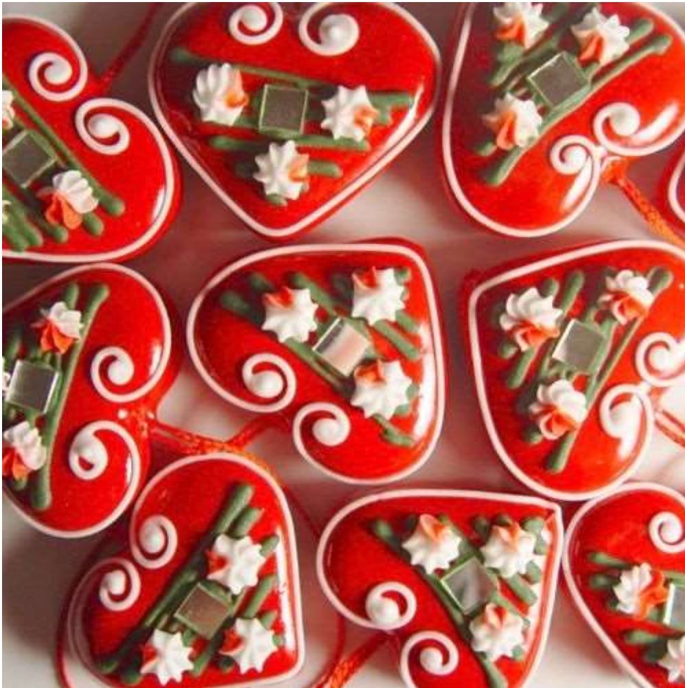
Slika 6. Licitarska srca