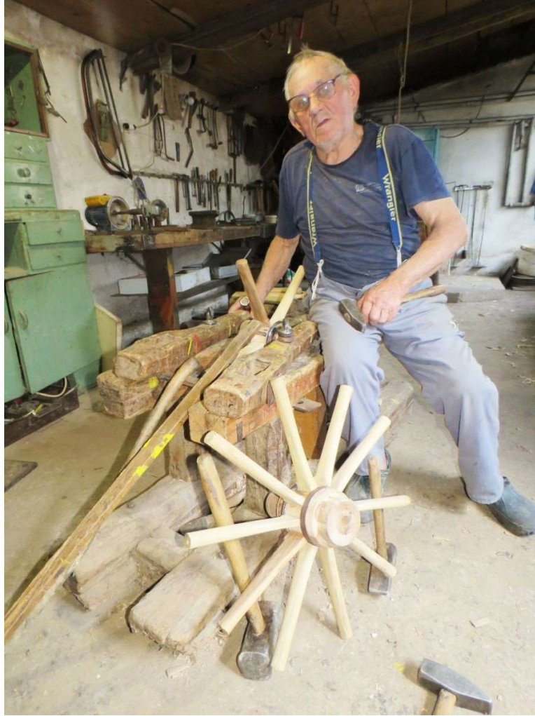
Slika 12. Izrada kotača