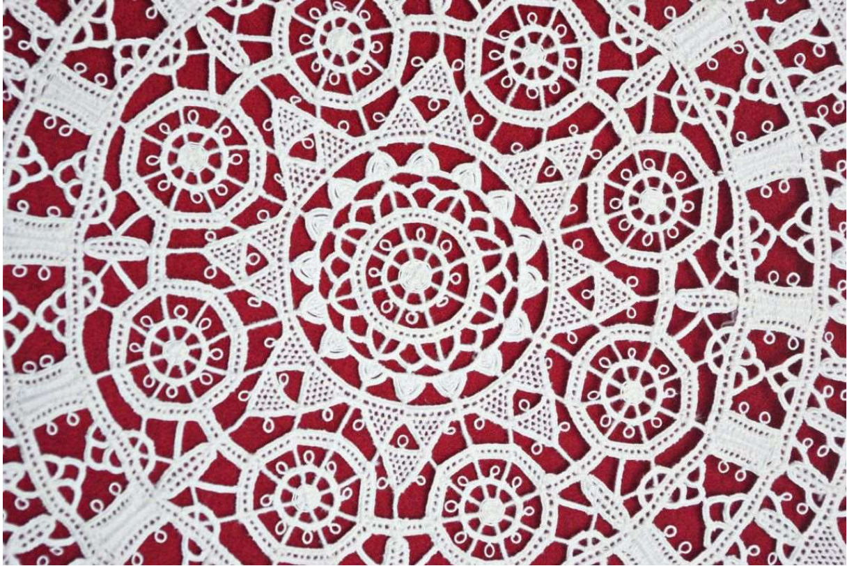
Slika 2. Paška čipka

strpljenja, maštovitosti i ideja, kako bi finalni rezultat bio što kvalitetnije i bolje odrađen (Eckhel, 2013., str. 234.).