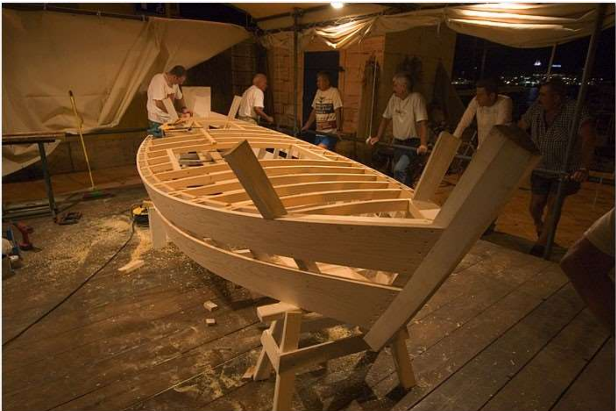
Slika 8. Izgradnja rovinjske batane

Rovinjska batana pripada vrsti barke ravnog dna. Ravno dno pogodno je za plovidbu u plitkim vodama. Svoju je primjenu našla u obalnom ribolovu. Upotrebom petrolejskih svjetiljki sve je više batana na moru, gdje su se lovile srdele. Batane su se na početku pokretale veslima, zatim jedrima i u moderno doba pokreću se na motorni pogon. Kao i u prošlosti, tako danas batane se grade bez nacрта, a omjeri se prenose usmenim putem. Izgradnja batane ima sedam faza. Znanja, slike i spisi o batani čuvaju se u ekomuzeju „Kuća o batani“ te unutar nekih obitelji koje znaju tajnu izgradnje batane (Centar za nematerijalnu kulturu Istre, 2019., str. 48. – 51.).