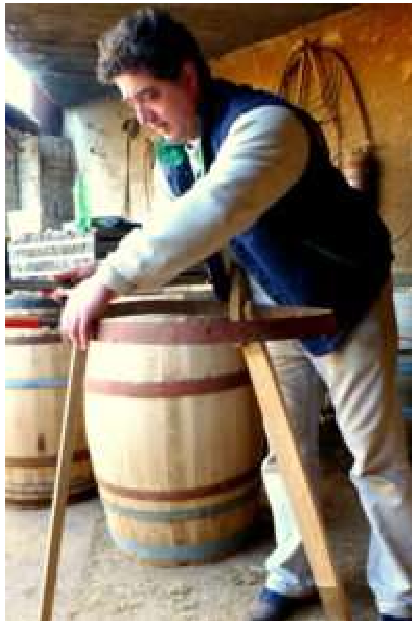
Slika 13. Izrada bačve

željezni, a nekada su se izrađivali od drva. Za posao izrade bačve potrebni su razni alati. Neki do alata koji su potrebni jesu razne pile, blanje, šestari, stolarska klupa i ostali alati. Pri izrade bačve drvo mora biti sasvim suho, a kada se bačva izradi na nju se upisuju inicijali vlasnika te ponekad motivi vinove loze (Bašić, 1996., str. 18.).