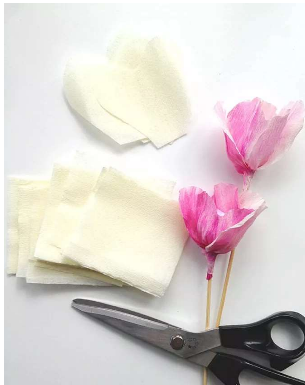
Slika 18. Izrada cvjetnih aranžmana od krep papira

izrađivali bili su bukete za svatove. Također, pojedine su djevojke izrađivale papirnate bukete kojima bi ukrašavale unutrašnjost crkve u Humu. Posebnu kombinaciju ukrašavanja čini kombinacija slamnatih ukrasa i svježeg bilja, što se najčešće koristilo na posebnim gozbama ili crkvenim praznicima. Kruh na svadbama se također ukrašavao papirnatim cvjetovima. KUD „Janez Trstenjak“ prikupilo je veliku i zanimljivu zbirku papirnatih cvjetova koje prikazuje na raznim izložbama, radionicama i sajmovima. Njihove nastupe krasi papirnati aranžmani postavljeni na bini gdje god da nastupaju. Koliko je ova djelatnost važna i koliko ono pažnju privlači, dovoljno je vidjeti prema brojnim predstavljanjima u raznim medijima, od televizije, radija do časopisa i novina. Članovi KUD-a „Janez Trstenjak“ svjesni o kakvom se kulturnom i tradicijskom nasljeđu i blagu radi te da je potrebno napraviti sve kako ovaj vrijedan stari obrt ne bi otišao u zaborav (Korpić, 2008., str. 147. - 151.).