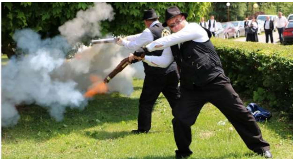
Slika 16. Kuburaši

Najčešće su puškari izrađivali kubure. Na području Pregrade izrađuju se kubure već nekoliko stoljeća. Taj kraj i jest poznat po kuburama. Iz kubura se prema tradiciji puca za Uskrs te za vrijeme ostalih posebnih svečanosti. Na području Pregrade ima dvanaest kuburaških društava. Za izradu jedne kubure potrebno je pet do šest dana, po tome vidimo da je izrada kubure vrlo složen i zahtjevan proces. Cijev kubure izrađena je od željeza, a drška od drva. Težina kubura može biti različita. Kroz povijest izgled kubure se mijenjao. Prije su, primjerice, kubure bile bez ukrasa, a danas se ukrašavaju raznim motivima. U današnje vrijeme stari obrti polako izumiru, a sve je manje zainteresiranih mladih ljudi za njih (Bašić, 1996., str. 30.).