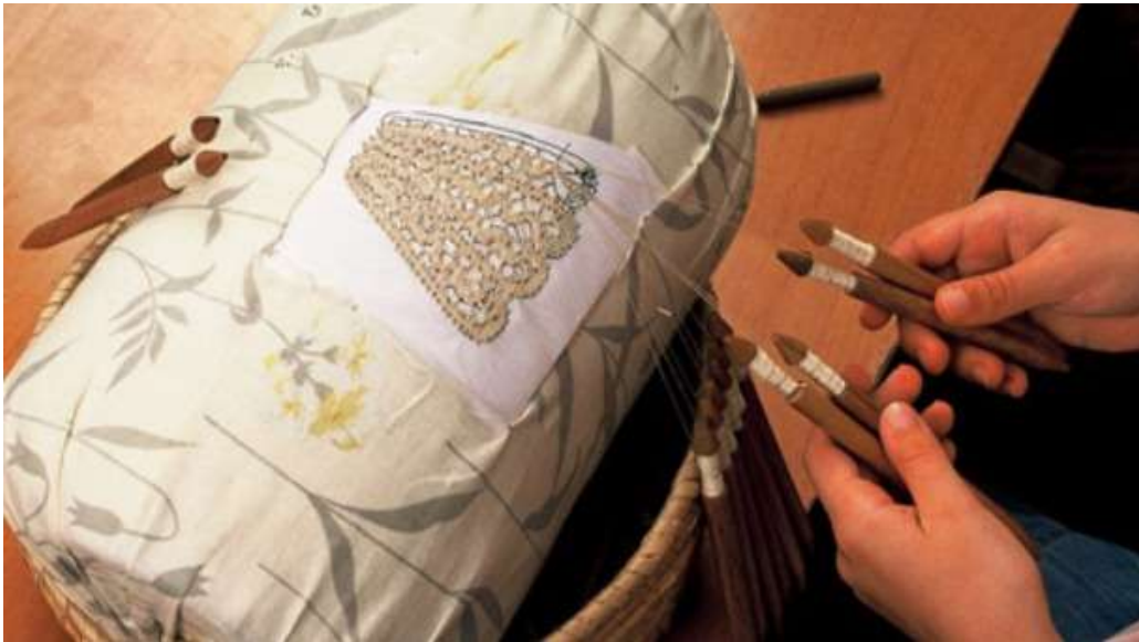
Slika 3. Lepoglavska čipka - čipka na batiće

je unosila elemente drvorezbarstva i folklornog ruha s područja cijele Hrvatske. Time je lepoglavskoj čipki dala poseban izgled koji ju je izdvajao od svih čipki toga vremena. Neki od motiva jesu tulipan, jaglac, žir, leptir i ptica. Tradicija lepoglavskog čipkarstva prenosila se s koljena na koljeno. Danas se poduzimaju određene mjere kako bi se očuvala tradicija čipkarstva. Jedna od mjera jest održavanje međunarodnog čipkarskog festivala u Lepoglavi, od 1997. (Eckhel, 2013., str. 234. – 237.).