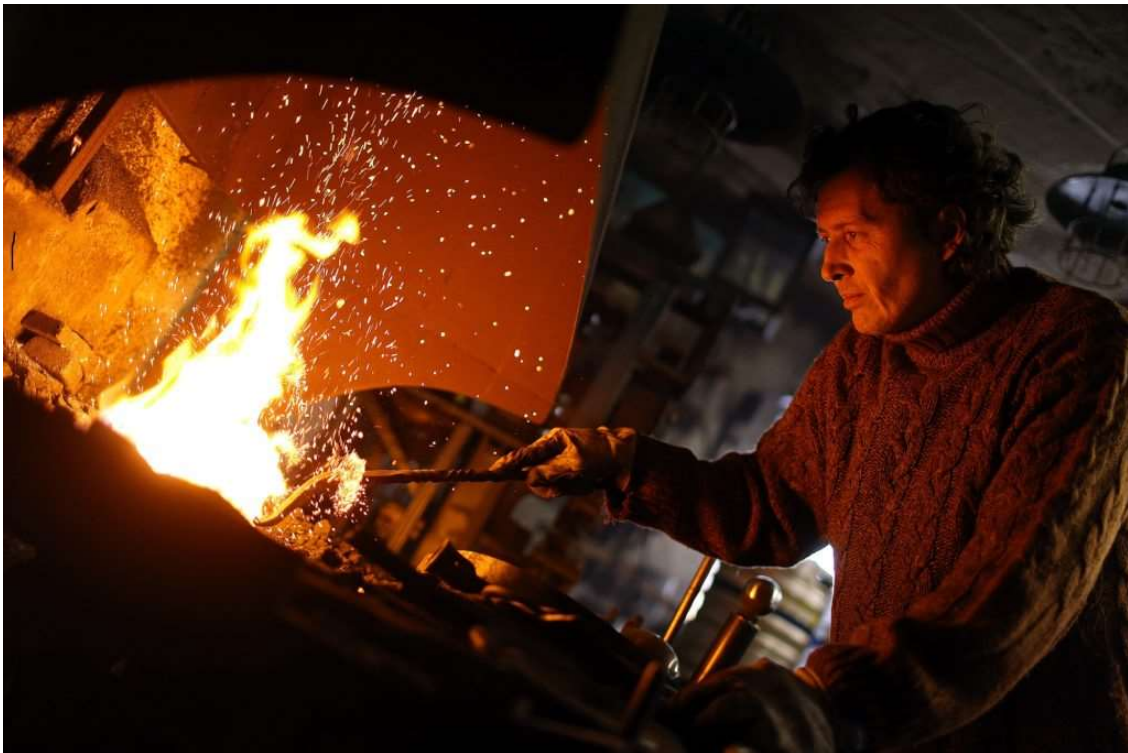
Slika 11. Kovanje željeza

majstori kolari svoj zanat izučili u nekom od obrtnih središta. Kao i u slučaju kovača, tako su i kolarima dolazili seljaci kući i tražili njihove usluge. Obrt kolarstva nasljeđivao se s koljena na koljeno. Sirovinu su nabavljali u šumi, ponekad od različitih vrsta drva. Kao glavno drvo pri izradi kotača koristila se bukva, za žbice brest, a za platnice hrastovina. Kolari su ponekad osim kotača znali izrađivati i cijele kočije. Radili su još i vile, grablje, plugove, alat, korita i ostala pomagala. Za izradu ovih proizvoda bili su potrebni tokarski strojevi, pile, šestar, banzek i ostali alati. Najviše posla kolari su imali u proljeće, kada su se seljaci pripremali za rad u polju (Bašić, 1996., str. 11.).