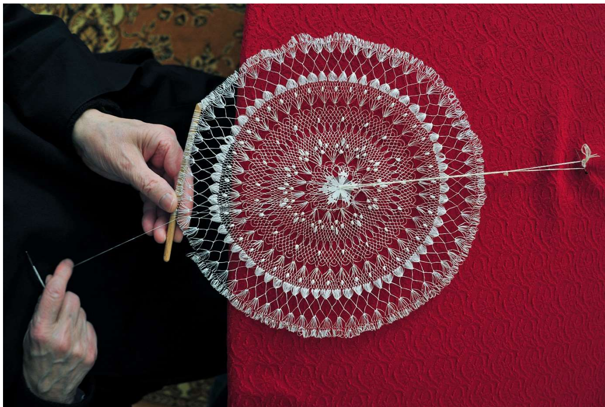
Slika 4. Hvarska čipka od agave - sunčana čipka

svaki primjerak unikatan te njegov izgled ovisi o sposobnosti osobe koja ga kreira. Čipka od agave može se izraditi s pomoću tri tehnike, a to su tenerifa, mreškanje i vezenje na mreži. Čipka od agave povezuje se isključivo sa samostanom u gradu Hvaru te je želja njegovih redovnica da proizvodnja čipke od agave ostane unutar redova benediktinskog samostana. Stoga, svaka se nova redovnica podučava tehnikama izrade čipke od agave. Čipka od agave sve je traženiji predmet darivanja ili suvenir koji predstavlja važan dio hrvatske kulture. Čipkarstvo u Hrvatskoj našlo je svoje mjesto na listi nematerijalne kulturne baštine UNESCO-a (Eckhel, 2013., str. 237.).