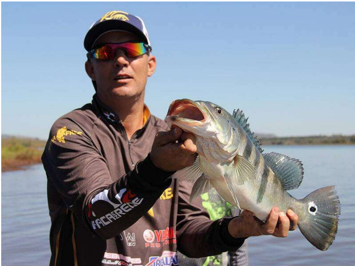
Slika 10. Ribolovne vještine

Od 2016. tradicijske ribolovne vještine imaju status nematerijalnog kulturnog dobra. Ove se vještine nalaze u gradovima uz more koji se vežu uz ribarstvo i maritimnu kulturu. Ovim statusom se promovira, njeguje i vrednuje mali ribolov, čime se pridonosi održivom razvoju zajednice. Održivi ribolov uključuje korištenje mreža stajaćica, mreža potegača te vrša, parangala, ostiju i tunja. Ribolov nije samo tehnika, nego i vještina te znanje o oceanografiji, meteorologiji i geomorfologiji. Poštivanjem tradicijske kulture moguće je razvijati održivi ribolov (Centar za nematerijalnu kulturu Istre, 2019., str. 72. – 75.).