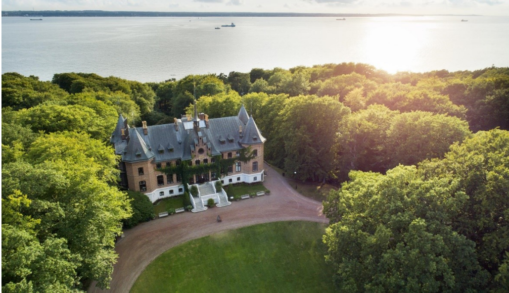
Slika 28. Dvorac Sofiero

prepoznat. Dvorac je sagrađen u nizozemskom renesansnom stilu 1864. godine i bio je ljetni dom danske kraljice Ingrid kao i mnoge druge kraljevske figure. Poznat je po izuzetno lijepim uređenim parkovima i vrtu rododendrona koje je zasadio švedski kralj Gustav VI. Adolf. (Sofiero.se, 2021.)