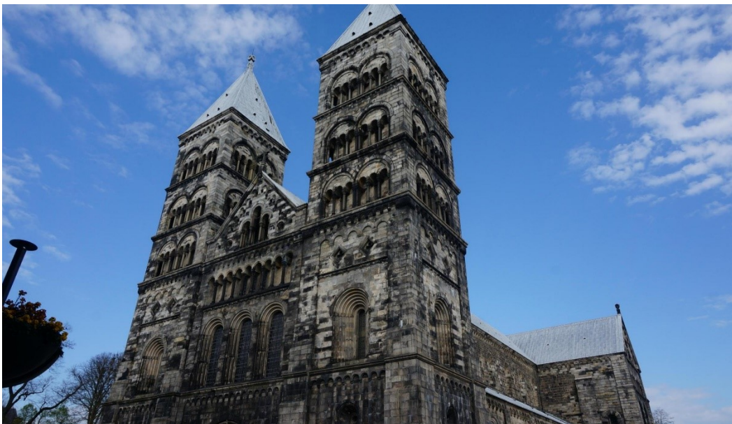
Slika 27. Katedrala u Lundu