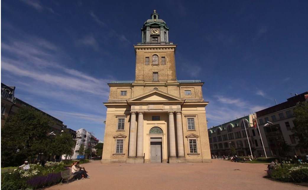
Slika 15. Katedrala u Göteborgu

Volvo Muzej koji se nalazi se u Göteborgu obuhvaća razvoj vodećeg švedskog proizvođača automobila Volvo, od prvih automobila do trenutnih automobila, kamiona, autobusa i ostalih proizvoda. U muzeju su izloženi proizvodi Volvo Aero i Volvo Penta, kao i mnogi drugi, uključujući zajednički stol Assara Gabrielssona i Gustafa Larsona, osnivača Volva. (Volvo Museum, 2021.)