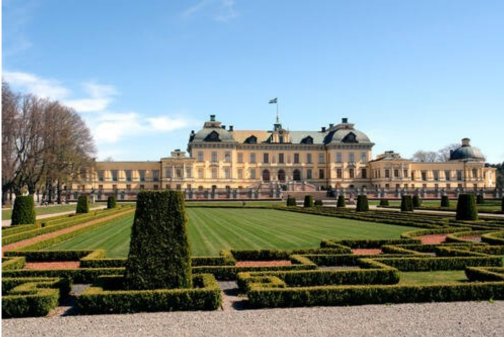
Slika 8. Palača Drottningholm

Vasa Muzej dio je švedskog nacionalnog pomorskog i prometnog muzeja, zajedno s Pomorskim muzejom u Stockholmu, Pomorskim muzejom u Karlskroni i Željezničkim muzejom u Gävleu. Oko 1,5 milijuna posjetitelja svake godine posjeti razne izložbe u muzeju, koje opisuju tadašnju povijest i život ratnog broda Vasa; kako je nakon 333 godine na dnu stockholmskog zaljeva brod ponovno otkriven i spašen i istraživanja koja su u tijeku radi očuvanja Vase. Muzej Vasa nalazi se u kraljevskom parku Djurgården u Stockholmu. Vasa je jedini sačuvani brod iz sedamnaestog stoljeća na svijetu i više od 95% broda je u originalnom stanju, brod je također ukrašen stotinama rezbarenih skulptura. 69 metarski ratni brod Vasa potonuo je na prvom putovanju usred Stockholma 1628. godine, a spašen je 333 godina kasnije, 1961. Danas je muzej Vasa najposjećeniji muzej u Skandinaviji, s preko milijun posjetitelja godišnje. (Vasamuseet, 2021., Visit Sweden, 2021.)