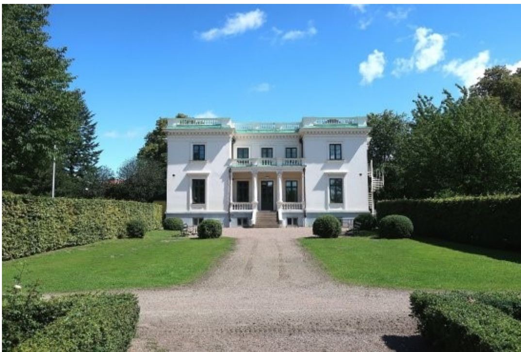
Slika 30. Vila Vikingsberg