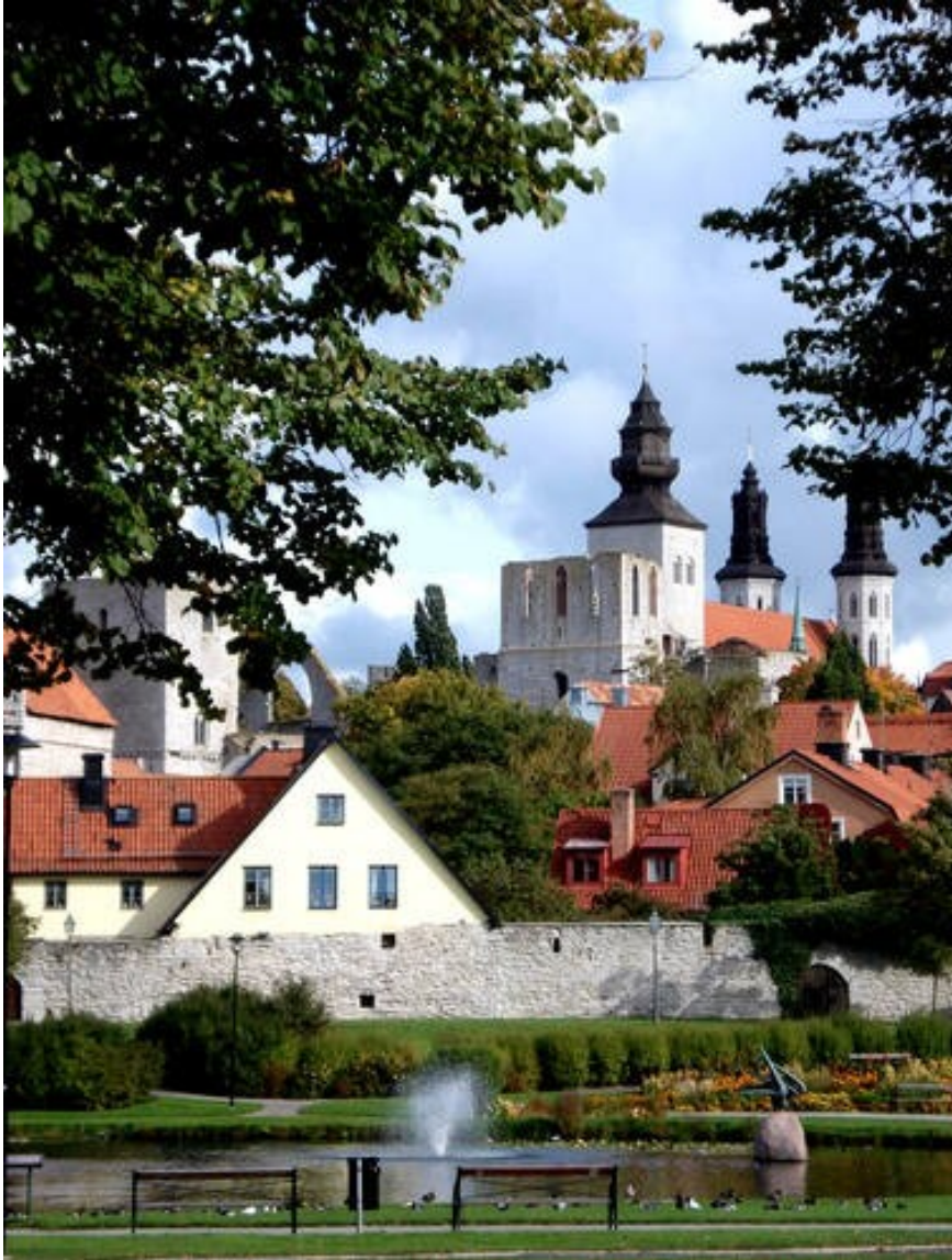
Slika 31. Grad Visby

Öland je otok u Baltičkom moru koji je od kopna odvojen Kalmarskim prolazom. To je najveći švedski otok nakon Gotlanda. Administrativno, Öland, zajedno s okolnim otočićima, čini najmanju švedsku tradicionalnu pokrajinu. Njegova periferija krečnjačkih i pješćanih grebena zatvara gotovo neplodno zemljište. Postoji nekoliko malih potočića i jedno jezero, Hornsjön. Na uskoj, aluvijalnoj obali uzgaja se šećerna repa, raž i krumpir, a uzgaja se i stoka. Lokalna industrija uključuje kamenolom, proizvodnju cementa i preradu šećera. Počevši od 775. godine, Öland je često igrao ulogu u skandinavskoj povijesti, posebno kao bojište u ratovima između Danske i Švedske. Otočni jedini veliki grad, Borgholm, sadrži ruševine jednog od najfinijih dvoraca i