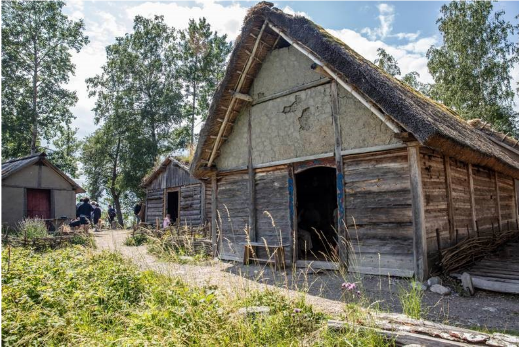
Slika 10. Vikinške nastambe u vikinškom mjestu Birka

Muzej Nobelove nagrade se nalazi u bivšoj zgradi burze na sjevernoj strani trga Stortorget u Gamla Stanu (Švedska akademija i Nobelova knjižnica također se nalaze u istoj zgradi.) Muzej Nobelove nagrade prikazuje podatke o Nobelovoj nagradi i dobitnicima Nobelove nagrade, kao i podatke o osnivaču nagrade Alfredu Nobelu. Stalni postav muzeja uključuje brojne predmete koje su donirali nobelovci, predstavljene zajedno s osobnim životnim pričama. (Nobel Prize Museum, 2021.)