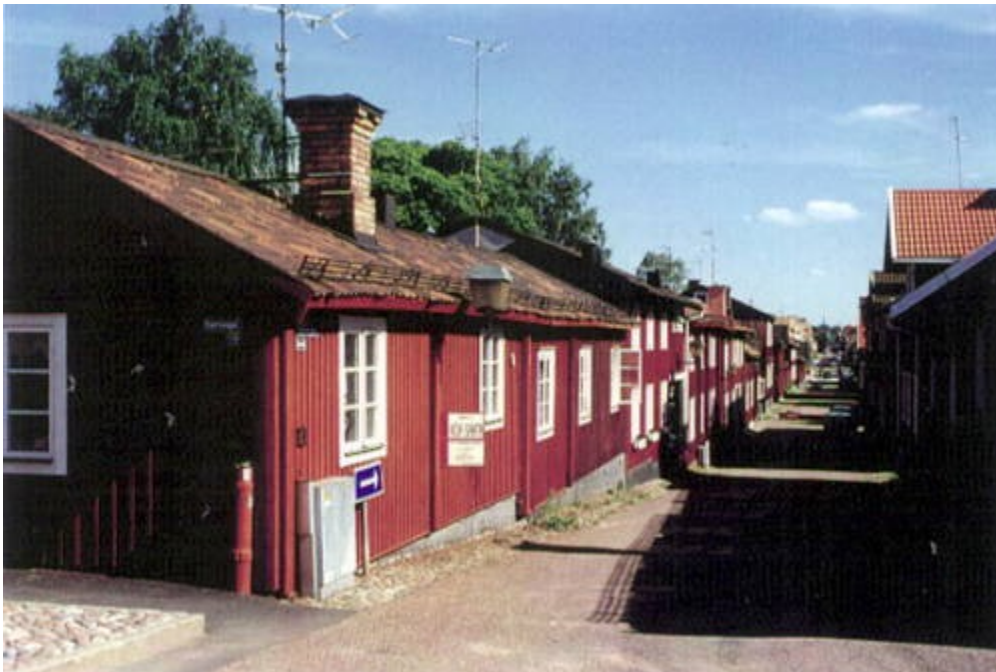
Slika 23. Rudarsko naselje u Falunu

industriju koji još uvijek opstaju u prirodnom krajoliku oko Faluna, koji je oblikovan i transformiran ljudskom domišljatošću i snalažljivošću. Ogromno rudarsko iskopavanje poznato pod nazivom Velika jama (Stora Stöten) na Falunu najupečatljivije je obilježje ovog krajolika. Uz ogromni rudnik otvorenog kova i njegove galerije, okna i rudnik tamo se nalaze dizalice, okviri za glavu, kormilarnice, vitla, stožerne i administrativne zgrade, stanovi za radnike i pomoćni objekti. Rudarsko područje Velike bakrene planine u Falunu vrijedno je pažnje ne samo zbog tehnološke baštine već i zbog brojnih dokaza koji prikazuju ekonomsku i socijalnu evoluciju industrije bakra i socijalnu strukturu rudarske zajednice tijekom vremena i iz tog razloga je uvršteno na UNESCO-vu Listu svjetske baštine. (UNESCO, 2021.)