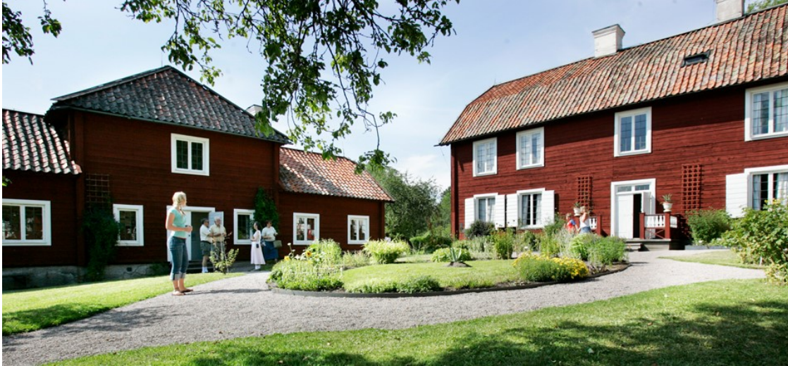
Slika 22. Linnaeus Hammarby