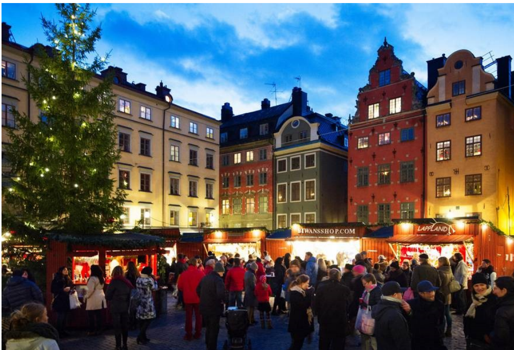
Slika 7. Gamla Stan u Stockholmu

Palača Drottningholm rezidencija je švedske kraljevske obitelji i prvo je mjesto u Švedskoj koje je UNESCO uvrstio na popis Svjetske baštine 1991. godine. Drottningholm je popularna turistička atrakcija, smještena zapadno od Stockholma. Osim Kraljevske palače, Drottningholm sadrži vrtove iz različitih razdoblja, kao i kineski paviljon i kazalište. Palača Drottningholm reprezentativna je za zapadnu i sjevernu europsku arhitekturu 17. i 18. stoljeća, a u tom su razdoblju stvoreni i prostori palače. Palača je stvorena s jakim referencama na talijansku i francusku arhitekturu iz 17. stoljeća. (Visit Sweden, 2021., UNESCO, 2021.)