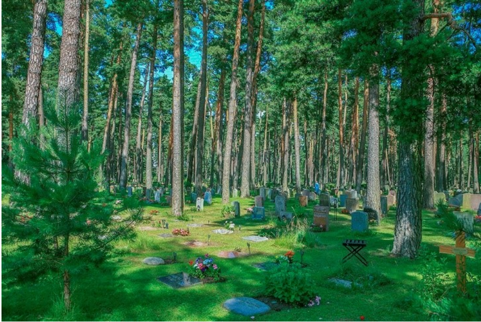
Slika 12. Skogskyrkogården (šumsko groblje)

Zabavni park Gröna Lund je najstariji zabavni park u Švedskoj. Nalazi se na otoku Djurgården i relativno je mali u usporedbi s drugim zabavnim parkovima, radi svog položaja koji mu ograničava širenje. Zabavni park ima preko 30 atrakcija i popularno je mjesto za koncerte ljeti. Gröna Lund otvoren je od kasnog proljeća do rujna, park je također otvoren i tijekom švedskih jesenskih praznika i Noći vještica. (Visit Sweden, 2021.)