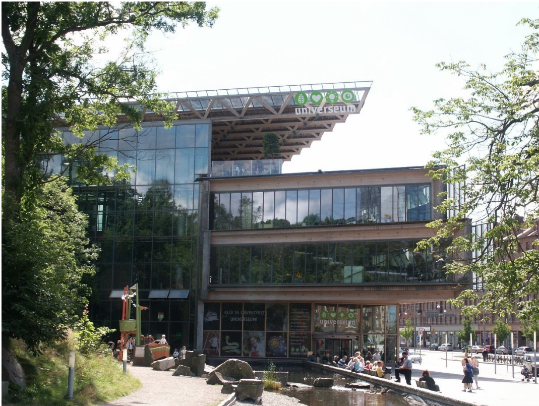
Slika 17. Universeum

Universeum je nacionalno znanstveno središte u Švedskoj i centar za obrazovanje u znanosti, tehnologiji i održivom razvoju. U velikoj zgradi usred Göteborga nalaze se nauka i iskustva o cijelom svijetu – od velikih svjetskih oceana i amazonske prašume do kemijskog laboratorija, tehnološkog laboratorija i svemira. (Universeum.se, 2021.)