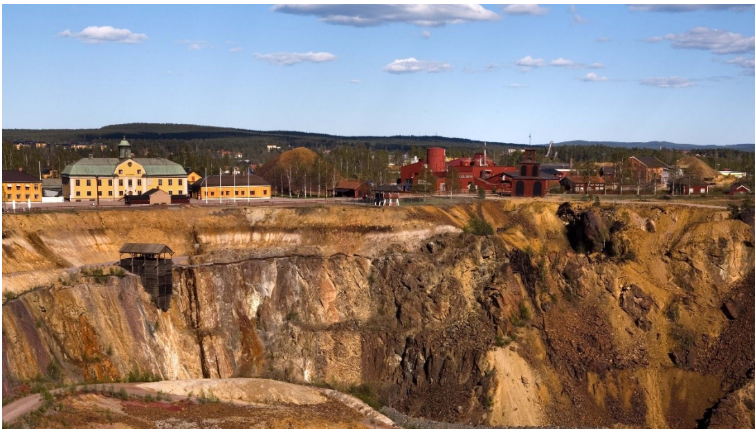
Slika 24. Velika jama u Falunu