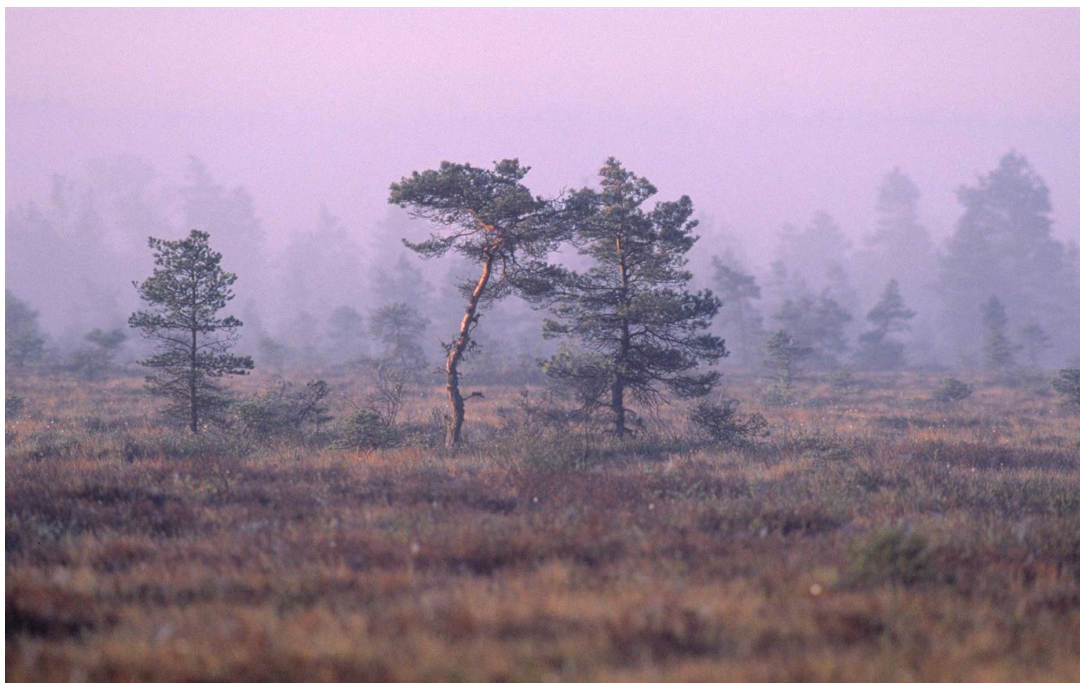
Slika 5. Nacionalni park Store Mosse

Kävsjön i Kalvasjön, ali mali bazeni u močvari lišeni su ribe zbog kiselih voda. (National Parks of Sweden, 2021.)