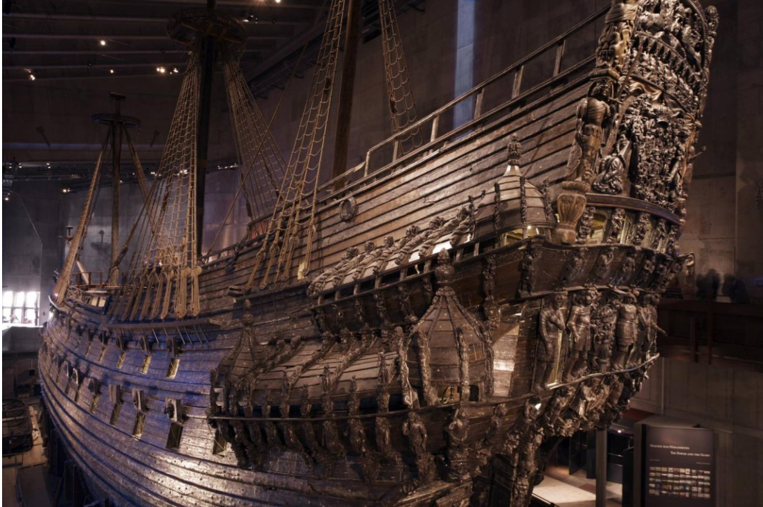
Slika 9. Brod Vasa u Vasa Muzeju (Visit Sweden, 2021.)

Kompleks Birka i srodni Hovgården odabran je kao dobro očuvano svjedočanstvo trgovačke mreže koju su uspostavili Vikinzi i jedan je od najcjelovitijih primjera trgovačkog naselja Vikinga 8. - 10. Stoljeća. Birka je lako dostupna brodom iz Stockholma, a nalazi se 30 kilometara zapadno od Stockholma na otoku u jezeru Mälaren, te je na popisu UNESCO-ve Svjetske baštine. Hovgården se nalazi na susjednom otoku Adelsö i nekoć je bio dom kraljevske rezidencije koja je upravljala Birkom. U Birki nema turističkog smještaja, ali za goste koji putuju vlastitim brodom postoji luka za goste. U Stockholmu, Mariefredu, Strängnäs i drugim polaznim mjestima za trajekt, u blizinu Birke ima hotela i ostalih turističkih smještajnih kapaciteta. (UNESCO, 2021.; Visit Sweden, 2021.)