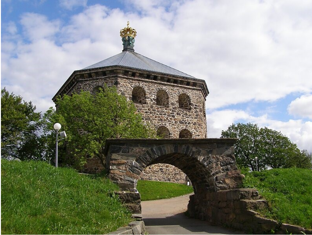
Slika 14. Skansen Lejonet

Katedrala u Göteborgu nalazi se u blizini centra grada. Katedrala je sagrađena 1815. godine i zamijenila je raniju katedralu sagrađenu u 17. stoljeću. Arhitekt je bio Carl Wilhelm Carlberg. Katedrala je primjer neoklasične arhitekture te je jedno je od najposijećenijih turističkih odredišta u gradu. Katedrala djeluje kao mjesto održavanja klasičnih koncerata i recitala, kao što je i domaćin redovnih službi. (Göteborg & Co, 2021.)