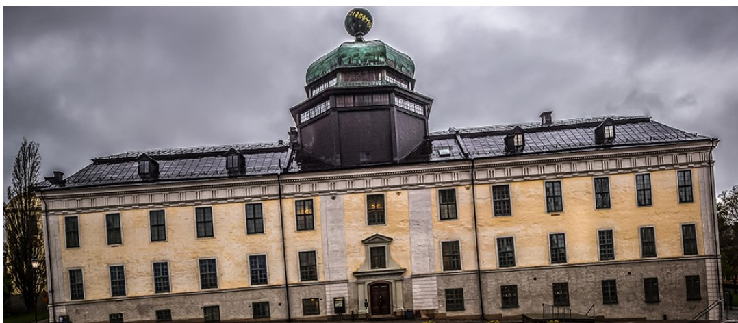
Slika 20 Sveučilišni muzej Gustavianum

Gustavianum , sveučilišni muzej u Uppsali, brine o sveučilišnim zbirkama arheoloških predmeta, umjetnosti, kovanica, povijesnih znanstvenih instrumenata i još mnogo toga. Zgrada muzeja, Gustavianum, arena je za interakciju između Sveučilišta i društva. Na izložbama važni i fascinantni predmeti iz zbirke prikazuju se javnosti, a izložbene ideje i program događaja nadahnuti su i odražavaju istraživanja na Sveučilištu Uppsala.