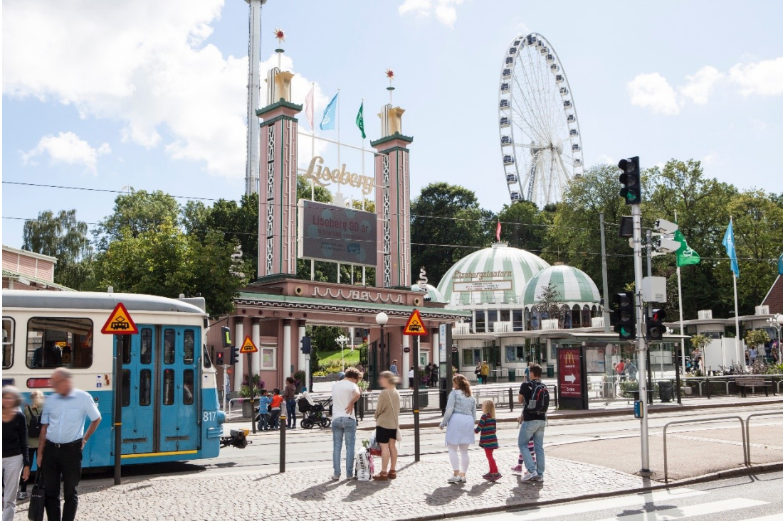
Slika 18. Zabavni park Liseberg

Zabavni park Liseberg je jedno od najpopularnijih turističkih odredišta u Švedskoj. Od 1923. Liseberg vodi zabavni park sa svoje 42 vožnje i atrakcije, igrama, igrama sreće, glazbenim pozornicama, plesnim podijem i brojnim restoranima i kafićima. (Liseberg, 2021.)