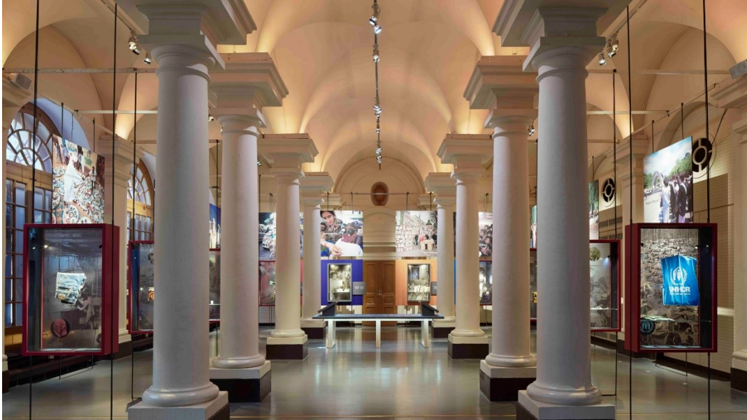
Slika 11. Slika Muzej Nobelove nagrade

ABBA Muzej je interaktivni muzej u kojem se može virtualno isprobati ABBA-ine kostime, pjevati, svirati i miješati izvornu glazbu. ABBA Muzej se nalazi na otoku Djurgården. Muzej prikazuje scensku odjeću poznatog švedskog benda, artefakte, snimke koncerata, intervjue itd. u suvremenom, interaktivnom okruženju. (Visit Sweden, 2021.; ABBA The Museum, 2021.)