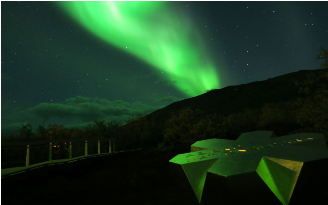
Slika 2. Sjeverna svjetla u Nacionalnom parku Abisko

teško ih je uočiti, ali tijekom zime mogu se pronaći njihovi tragovi. Zimi se također možete vidjeti losa. Lako im je pronaći hranu u Abisku jer snježni pokrivač ovdje nije toliko dubok. Sobovi se mogu naći na tom području veći dio godine. Iznad planine može se vidjeti zlatnog orla i orla bijelog repa. Močvarne ptice uspijevaju u močvarama, a ronoci s crvenim grlom u malim jezerima. Delta bogata pticama gdje se Abiskoječka ulijeva u Torneträsk, utočište je za ptice tijekom dijelova godine. U Abisku se također može vidjeti i sjeverno svjetlo bilo gdje između rujna i početka travnja koje privlači velik broj turista. (National Parks of Sweden, 2021.)