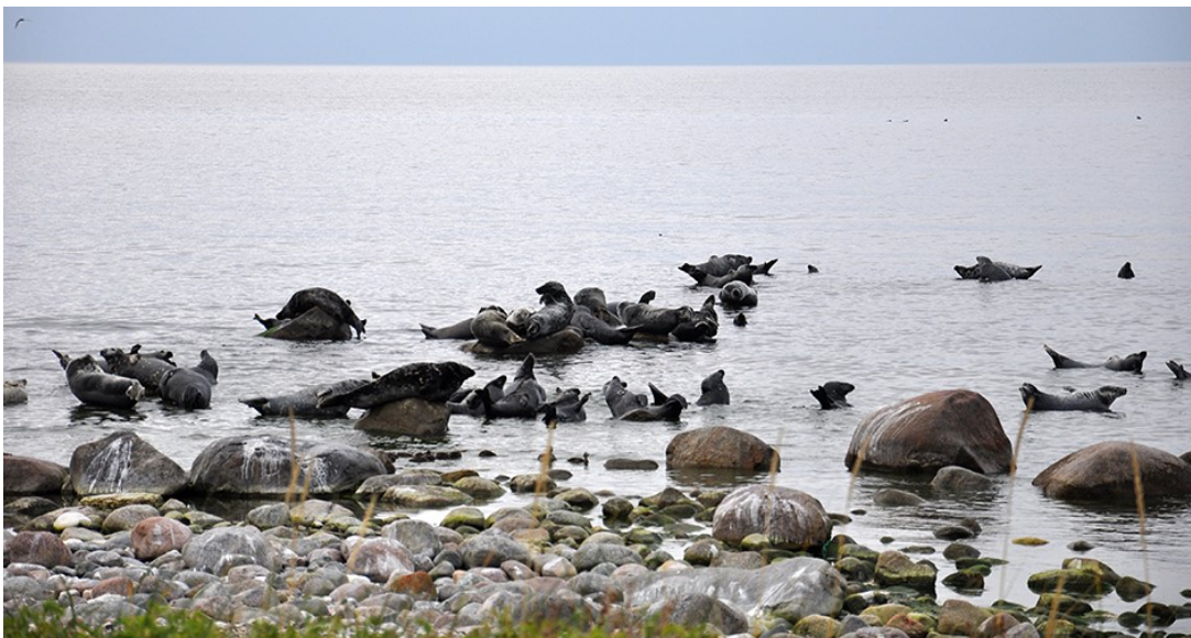
Slika 4. Sivi tuljani u NP Gotska Sandön