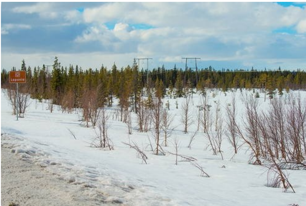
Slika 6. Laponija