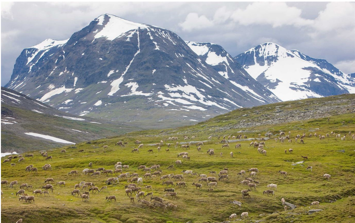
Slika 3. Nacionalni park Sarek

doline, proširujući ih i zaokružujući. Njoatsosvágge u Sareku primjer je takve klasične doline u obliku slova U gdje je ledena ploča zaokružila konture. Razlog zašto je krajolik toliko upečatljiv je amfibolitna podloga koja se posebno dobro odupire eroziji. Na neplodnim planinama i stjenovitim podlogama na visokim uzvišenjima ne raste puno. Međutim, lišajevi, mahovine, patuljaste vrbe i mala količina trave i drugih biljaka dobro se slažu u visokim alpskim dijelovima planina Sarek. Unutar planinskih brezovih šuma leže livade s visokim planinčicama, vučjom korom, ždralovom biljkom i crvenim kampom. U Sareku se mogu ugledati medvjedi, vukovi, risovi ili neke od neobično velikih losova. U zelenim brezovim šumama mogu se naći vrbove vrpce, trbušnjake, plave vrpce, plave grla i izmrvljene muholovce. U malim jezerima plivaju čupave patke i druge male ptice, također ima mnogo ptica grabljivica poput zlatnih orlova, grubonogih zubaca i merlina. (National Parks of Sweden, 2021.)