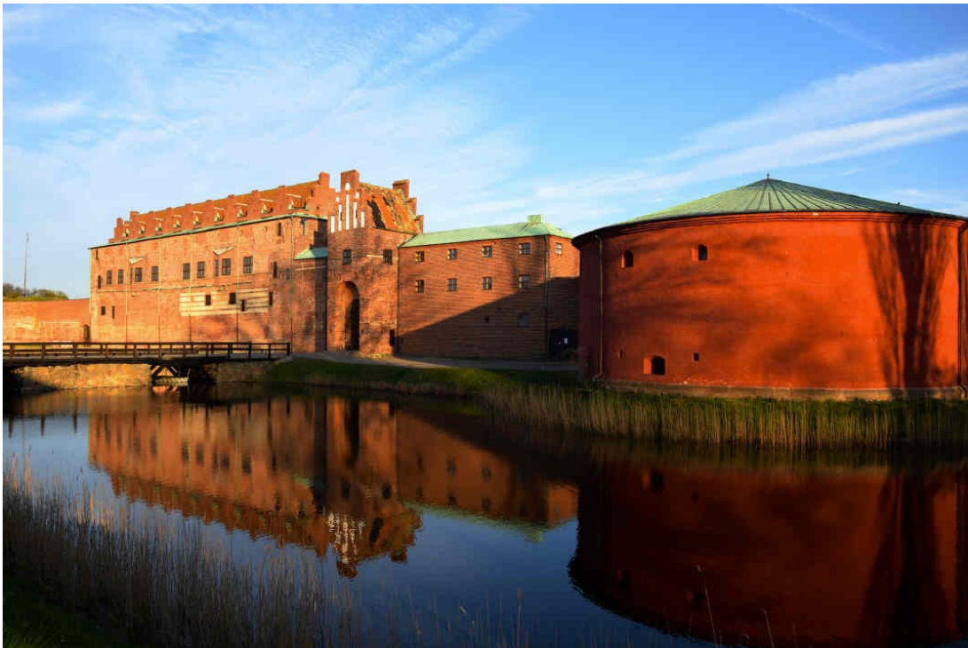
Slika 26. Malmöhus

Malmöhus. 1434. godine Erik Pomeranski, kralj Danske, Norveške i Švedske, sagradio je kaštel u gradu Malmö čiji se tragovi još uvijek mogu vidjeti u zidovima. Nakon 1658. Šveđani su dvorac modernizirali obrambenim sustavom nadahnutim Nizozemskom, a 1675. izdržao je dansku opsadu. Međutim, tvrđava je propala, a Malmöhus se uglavnom koristio kao žitnica i arsenal švedske vojske. Od 1828. do 1909. služio je kao zatvor. Od 1930-ih dvorac je obnovljen u renesansnom stilu, a danas je muzej.