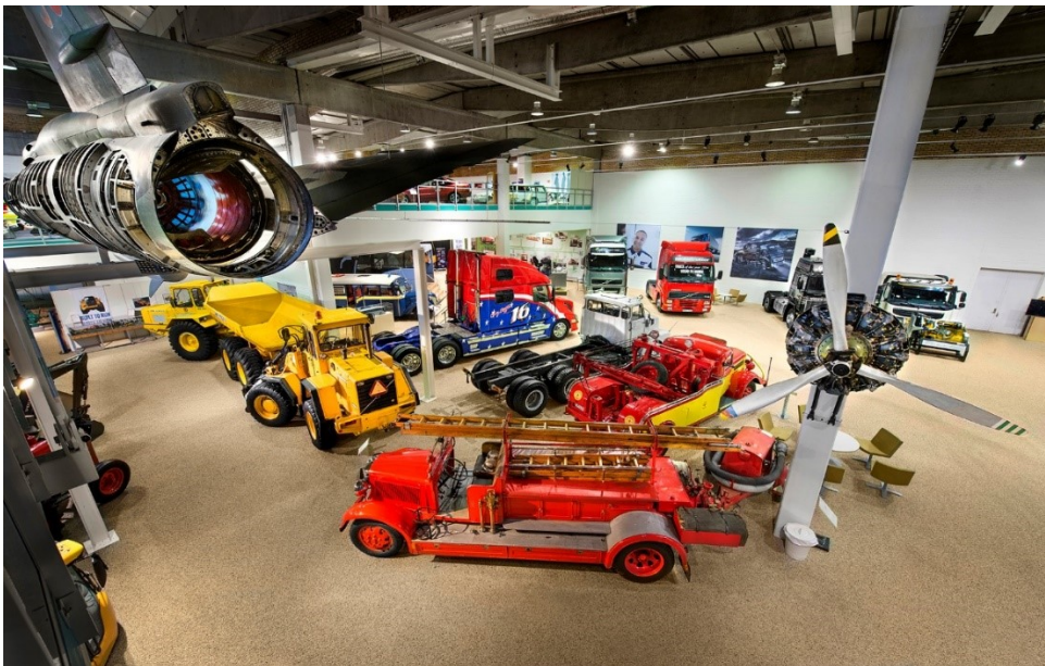
Slika 16. Volvo Muzej

Volvo Muzej koji se nalazi se u Göteborgu obuhvaća razvoj vodećeg švedskog proizvođača automobila Volvo, od prvih automobila do trenutnih automobila, kamiona, autobusa i ostalih proizvoda. U muzeju su izloženi proizvodi Volvo Aero i Volvo Penta, kao i mnogi drugi, uključujući zajednički stol Assara Gabrielssona i Gustafa Larsona, osnivača Volva. (Volvo Museum, 2021.)