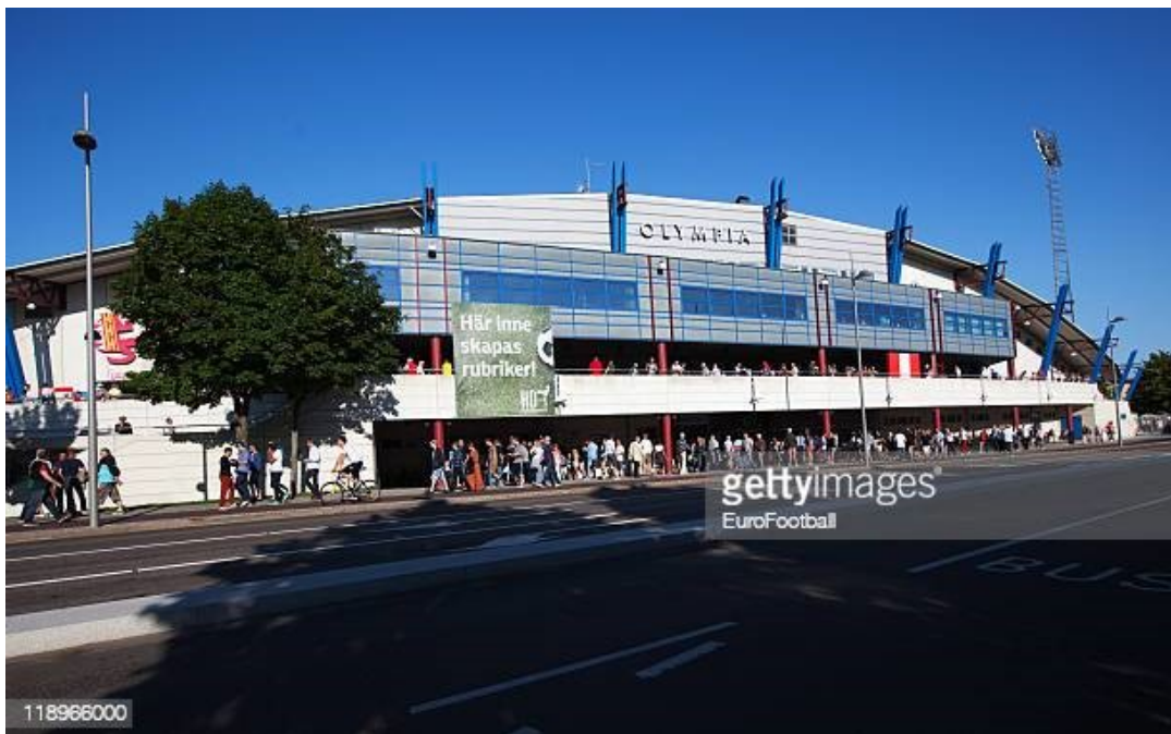
Slika 29. Stadion Olympia

Vikingsberg je vila s pripadajućim parkom smještena u seoskom dvorcu u Helsingborgu. Vila je nekad funkcionirala kao općinski muzej umjetnosti, kasnije privatna umjetnička galerija, ali danas je ured za kulturnu upravu grada Helsingborga. Vila je 1967. godine postala zaštićena zgrada. (Lansstyrelsen Skane, 2021.)