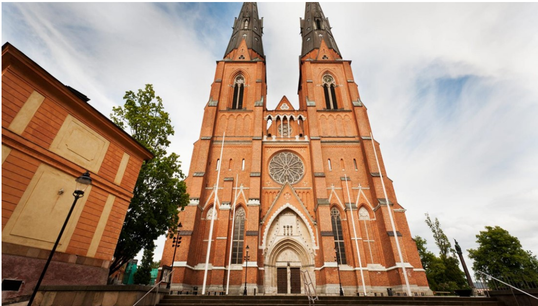
Slika 19. Katedrala Uppsala

Katedrala Uppsala. Izgradnja katedrale započela je oko 1270. godine, a posvećenje se dogodilo 1435. Crkveni tornjevi dodani su kasnije u 15. stoljeću. Zgrada je podvrgnuta nekoliko glavnih restauracija. Uppsala je sjedište švedskog nadbiskupa od 1164. godine i mjesto gdje se posvećuju biskupi drugih biskupija i zaređuju svećenici i đakoni uppsalske biskupije. Do 1719. godine u katedrali su se odvijala krunidba. Nekoliko važnih osoba pokopano je u katedrali u Uppsali, među njima kralj Gustav Vasa i kralj Johan III iz 16. stoljeća i njihove kraljice. Ostali primjeri su botaničar Carl Linnaeus i njegova supruga Sara Lisa Moraea, znanstvenik Emanuel Swedenborg i nobelovac, dobitnik nagrade za mir, nadbiskup Nathan Söderblom. Atrakcije katedrale uključuju relikvijar Svetog Erika (švedskog zaštitnika), srednjovjekovnu oltarnu sliku Svete Ane i baroknu govornicu iz 18. stoljeća, svijeće Olofa Hellströma i drvene skulpture Eve Spångberg cijenjeni su primjeri moderne umjetnosti u katedrali. (Svenska kyrkan Uppsala, 2021.)