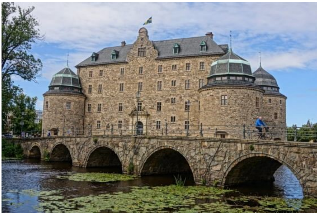
Slika 25. Dvorac Örebro

veće uporište. Pod švedskim kraljem Karlom IX. tvrđava je obnovljena u renesansni dvorac. Od 1764. dvorac služi kao rezidencija guvernera županije Örebro. (Örebro Slott, 2021.)