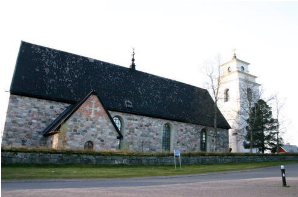
Slika 33. Crkveni grad Gammelstad, Luleå

zaštićenih zgrada, koje se sastoje od 404 crkvene kućice podijeljene u oko 552 zasebne komore i 116 drugih zgrada. Crkvene kućice koje se koriste kao kratkotrajni smještaj za vjernike suprotstavljene su većim, konvencionalnijim kućama za službenike i trgovce koji su stalno živjeli u naselju. Obje vrste stanova skupljene su oko crkve s kraja 15. stoljeća, jedine kamene zgrade u okrugu, čija veličina svjedoči o prosperitetu regije. Ostale značajne građevine su kapela Betel, vikendica separatista, župna kuća, desetina štala, gradonačelnikova rezidencija, kapetanova rezidencija i gostinjska kuća. Gammelstad, koji i danas djeluje kao crkveni grad, najstarije je, najcjelovitije i najbolje očuvano od ove vrste naselja koji je danas gotovo nestao. (UNESCO, 2021.)