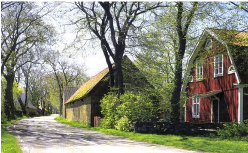
Slika 32. Agrarni krajolik južnog Ölanda