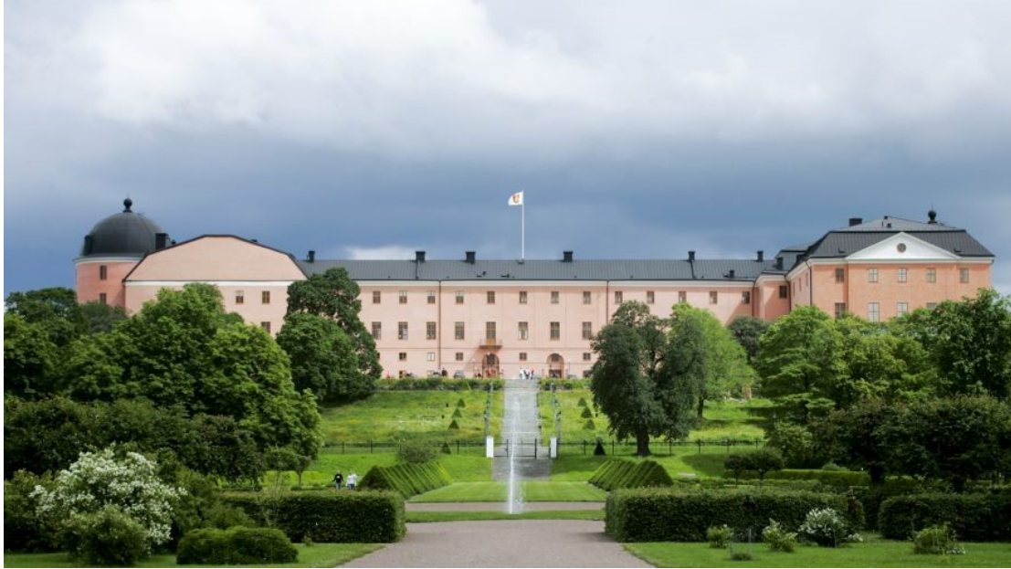
Slika 21. Uppsala Slott (dvorac Uppsala)

Linnaeus Hammarby je botanički vrt, točnije farma, a smješten je jugoistočno od Uppsale u kojoj je živio Carl Linnaeus. Carl Nilsson Linnaeus bio je švedski botaničar i liječnik. Bilo je to i mjesto na kojem je Linnaeus mogao rasti i eksperimentirati s brojnim biljkama za koje nije bilo mjesta u akademskom vrtu na Svartbäcksgatanu. Stilski je Hammarby jedna od najbolje očuvanih farmi iz 1700-ih. Izgrađena 1764. godine, kuća je otvorena za ljetne ture. Linnaeus je imao zidove i u radnoj sobi i u spavaćoj sobi prekrivene ilustracijama biljaka umjesto tapeta, nešto što je nadahnulo mnoge današnje dizajnere. Oko 40 linnejskih biljaka koje je zasadio Linnaeus ili njihovi izravni potomci i danas opstaju. To je najveća živa kolekcija biljaka Linnaean na svijetu, a Hammarby čini jedinstvenim. Stablo sibirske jabuke i dalje stoji u dvorištu, a Linnaeov vrt sada je park prepun njegovih egzotičnih biljaka. Nakon Linnejeve smrti, njegova se obitelj trajno preselila ovamo i preuzela farmu koju su do tada vodili stanari. (Uppsala Universitet, 2021.)