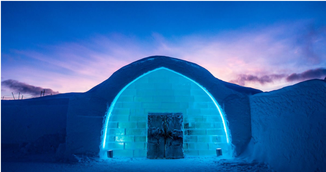
Slika 34. Ledeni hotel

Jedna od glavnih atrakcija Sjeverne Švedske je Ledeni hotel u Jukkasjärviu, koji se promovira kao 'najveći iglu na svijetu. Sobe i namještaj, koji su jedinstvena umjetnička djela, izrađeni su od 30 000 tona leda i zbijenog snijega koji se uzimaju svakog studenog iz zaleđene rijeke Torne, a struktura se koristi do ranog proljeća. Temperatura u hotelu održava se na konstantnoj -7^{\circ}\text{C} , dok vani može pasti na -35^{\circ}\text{C} . Krevetski namještaj izrađen je od sobove kože koji pružaju izolaciju od hladnoće. Od 2016. ovu privremenu strukturu nadopunjuje Icehotel 365, stalna zgrada koja ostaje otvorena tijekom cijele godine. (Bonafice i dr., 2020.)