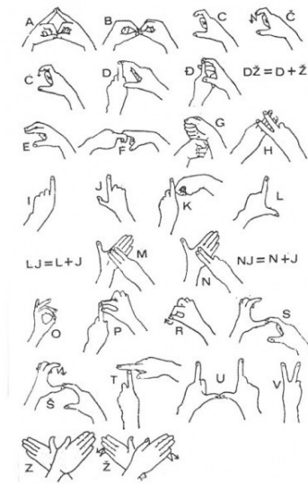
Slika 3 Dvoručna hrvatska abeceda

a) dvoručna znakovna abeceda koja je određena posebnim položajem prstiju obje ruke, a oponaša velika tiskana slova hrvatske abecede.