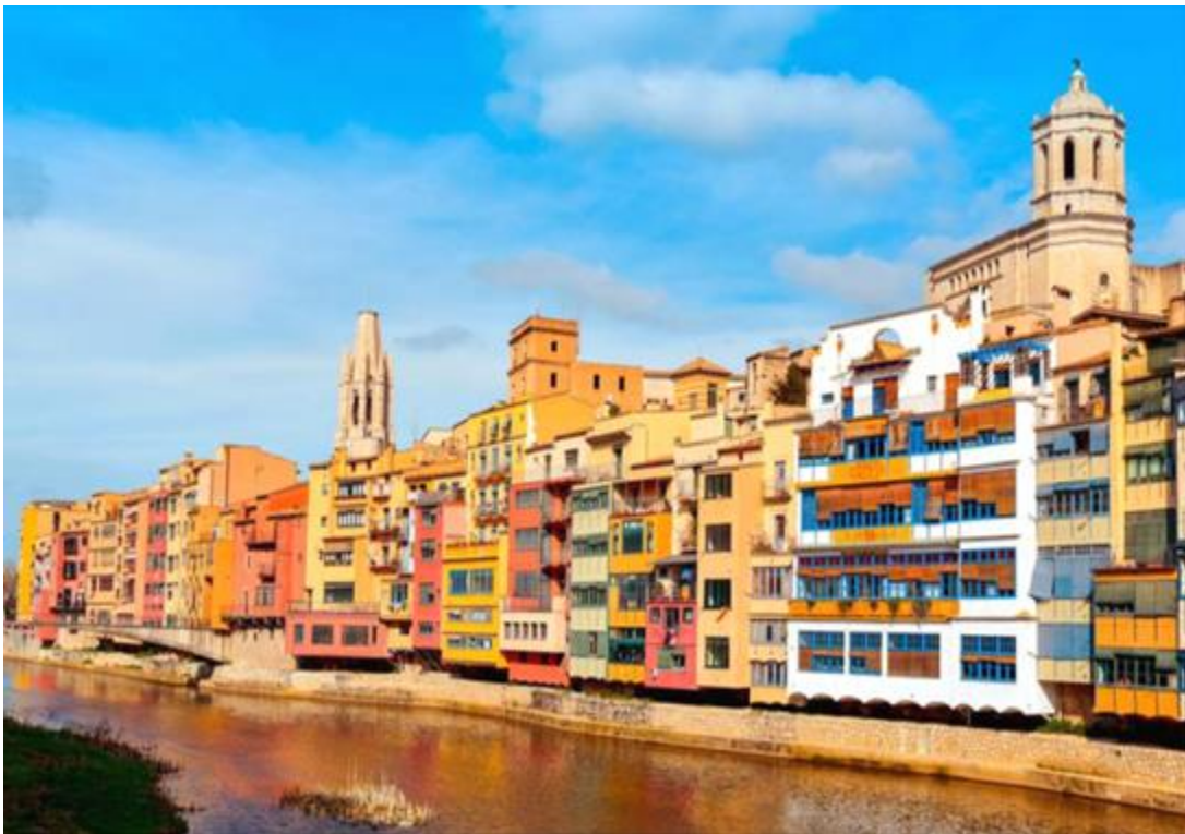
Slika 3. Girona, rijeka Onyar

područje je u doba 11. stoljeća bilo puno romaničkih mostova koji su danas uništeni. Danas su na rijeci Onyar sačuvani četiri glavna mosta: Isabel most ili kameni most koji je izgrađen u 19. stoljeću., Eiffelov most koji datira iz 1876. godine, zatim most San Augustina i na kraju Gomezov most. Iz svakog od njih pruža se pogled na rijeku i gradske kuće.