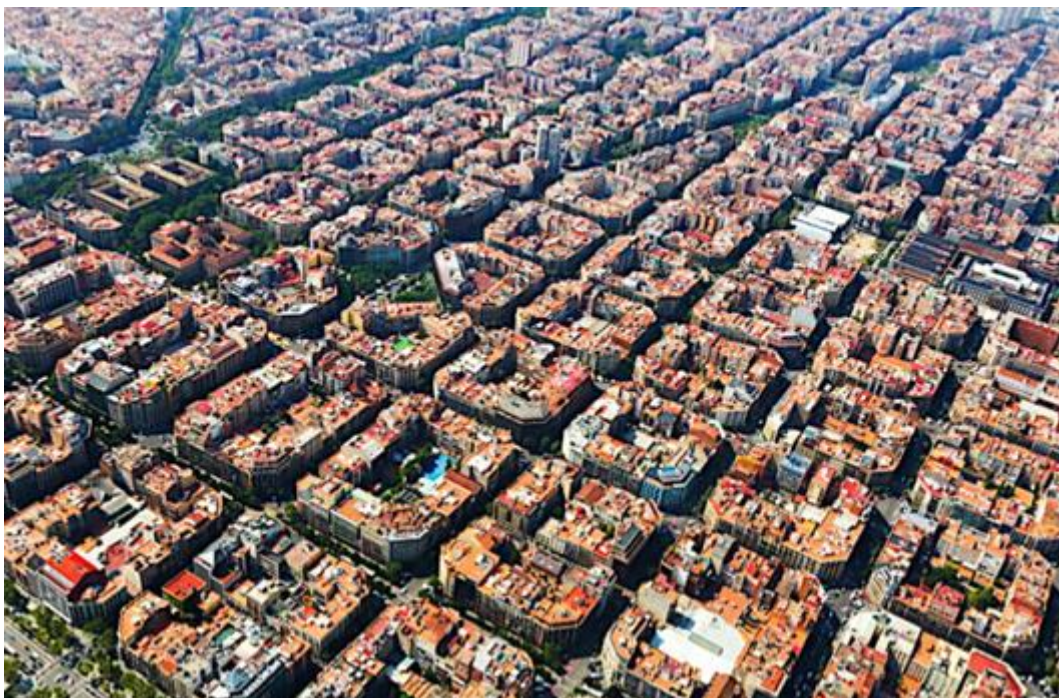
Slika 2. Primjer Eixample

Stil, poznat u Kataloniji kao modernizam, razvio se nakon 1854. godine kada je odlučeno da se sruše srednjovjekovne zidine radi proširivanja grada na nekadašnju vojnu zonu gdje se građevinski radovi nisu provodili. 1855. godine gradska vijećnica poziva na javni natječaj kako bi riješila potrebe grada za širenjem. Ildefons Cerda, građevinski inženjer, osvojio je projekt za Eixample (katalonski izraz za proširenje) i tako je započela izgradnja rešetkastog sistema koji je ispunio područje između gradskih zidina i okolnih gradova. 19