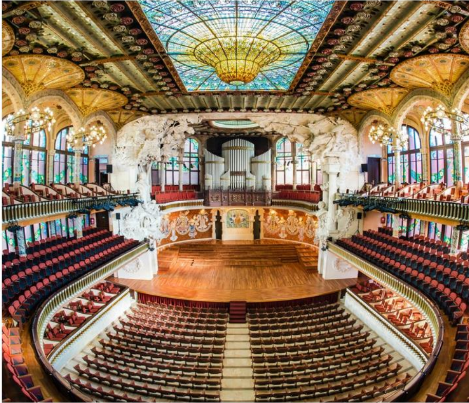
Slika 4. Unutrašnjost Palau de la Música

09.09.2020.