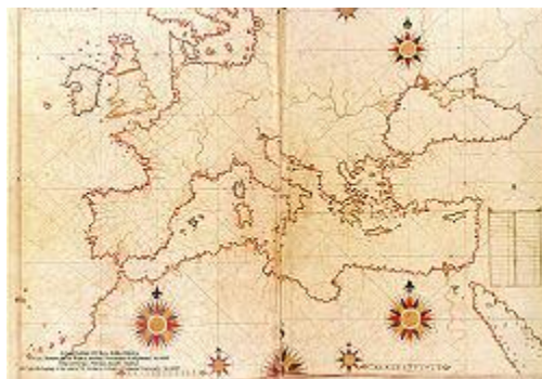
Slika 8. Karta Osmanlije Piri Reisa.