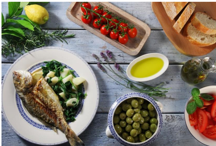
Slika 4. Mediteranska prehrana laganog je tipa s puno ribe i sezonskog povrća.