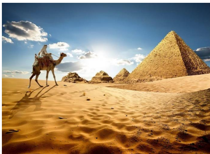
Slika 19. Egipat.

Ovakav itinerar trajao bi dugo vremena, zacijelo mjesec dana. Bilo bi puno putovanja i turisti bi morali biti fizički i psihički spremni na to. Također bi bilo skupo zbog hotelskih rezervacija i karata prijevoznih sredstava. Putovanje bi bilo namijenjeno onima koji mogu izuzeti mjesec dana svog života i pozamašan iznos da bi zauzvrat iskusili putovanje Mediteranom u stilu Predraga Matvejevića.