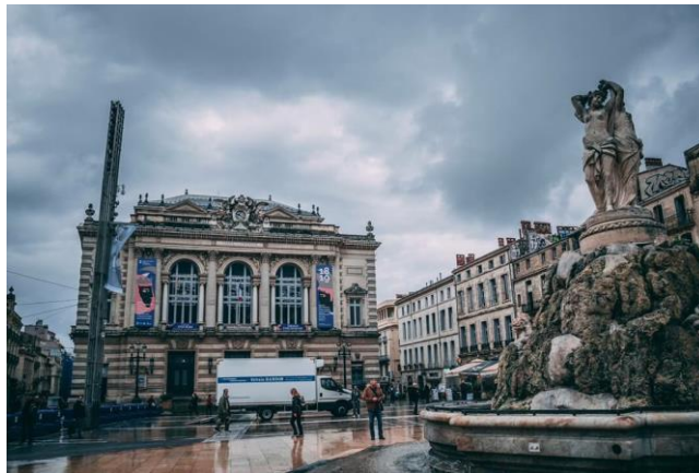
Slika 15. Montpellier, Francuska.

Avionom se odlazi u Provansu u Francuskoj u grad Montpellier. U Provansi je Matvejević čuo da vjetar mistral, koji je u Hrvatskoj inače blag i dolazi s mora, opisuju uzrečicom da „čupa magarcu rep“ jer je toliko jak, a također puše s kopna na more. Također je istaknuo provansalsko pjesništvo, a Provansalce je opisao kao narode Juga, ne kao pomorski narod. Zatim se vlakom dolazi do Azurne obale, koja je kratko spomenuta u Brevijaru, te se brodom odlazi na Calvi na Korzici.