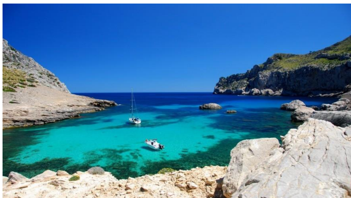
Slika 13. Majorka

Fokus bi bio na kulturnom, a potom i ostalim posebnim oblicima, primjerice gastronomskom, robinzonskom, cikloturizmu i sličnome valorizirajući nedovoljno iskorištene potencijale spomenutih otoka što bi turistima, koji traže aktivniji i dinamičniji odmor, pružilo odličnu priliku za bolje i pobliže upoznavanje otoka, njihovih posebnosti, domaćeg stanovništva, flore i faune. Jednako tako, njihovo bi turističko iskustvo bilo bliže onome Predraga Matvejevića jer bi bili dublje uronjeni u čari tih otoka, a bili bi lišeni pasivnog odmora trošeći vrijeme na plaži.