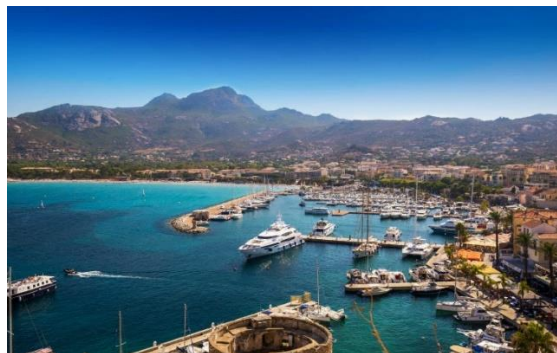
Slika 16. Calvi, Korzika.

U Calviju su Matvejevića uputili užaru koji se posvetio uzlovima i o njima znao više od ikoga drugoga. Navodno su tog užara ismijavali davši mu nadimak Turiddu zbog kojeg je trpio i koji ga je navodio da se još više preda svome djelu. Nakon Calvija odlazi se u Italiju u Genovu kratkim letom gdje se istražuju kartografske radionice koje je i sam autor posjećivao.