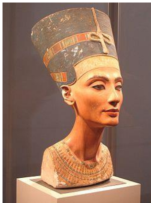
Slika 11. Portret Nefertiti, egipatsko kiparstvo.

Počelo se razvijati tek oko 3 000 g. p. n. e. u Egiptu i Mezopotamiji gdje je bilo povezano s graditeljstvom te je nosilo religiozno-simbolički značaj. Oblici su bili depersonalizirani i statični, izuzev portreta.