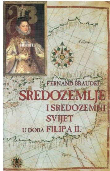
Slika 2. Sredozemlje i sredozemni svijet u doba Filipa II. francuskog povjesničara Fernanda Braudela.

nisu ucrtane ni u prostoru ni u vremenu. Ne vidimo kako bismo ih odredili, ni po čemu. Nisu ni gospodarske ni povijesne, ni državne ni nacionalne: nalik su na krug kredom koji se stalno opisuje i briše...“ 5