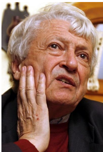
Slika 6. Predrag Matvejević.

Predrag Matvejević bio je hrvatski i bosanskohercegovački pisac i publicist. Rođen je u Mostaru sedmog listopada 1932. godine, a preminuo je u Zagrebu drugog veljače 2017. godine. Bio je hrvatski i talijanski državljanin te član Akademije nauka i umjetnosti BiH od 2002. godine te se nalazi među najviše prevedenim hrvatskim književnicima u svijetu. Njegovo najpoznatije djelo svakako je Mediterranski brevijar koje je u svijetu prevedeno na dvadeset i tri jezika. Za svoga života predavao je francusku književnost na Filozofskom fakultetu u Zagrebu. Kratko je vrijeme živio u Francuskoj gdje je na sveučilištu Sorbonne predavao na Odsjeku za opću i komparativnu književnost dok je od 1994. bio redovni profesor slavistike na Rimskom sveučilištu La Sapienza . U povodu šeststote obljetnice Sveučilišta u Perpignan, dobio je doktorat honoris causa . Jednako tako, počasne doktorate dobio je i na sveučilištima u Trstu, Genovi i rodnom gradu Mostaru. 29