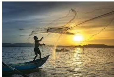
Slika 7. Ribarenje je najvažniji zanat na Mediteranu.

Ribare se prikazuje lica izbrazdanih od kiše i sunca, vjetrom i valovima bez da im ikad pokažu njihove ruke otvrdnule od soli i mreža, konopa i vesala. Pravi ribari psuju, no nisu lopovi. Srde se, ali ne nasrću jedni na druge niti se tuku kao što to ponekad čine lučki radnici i obični seljani. Usprkos međusobnim sporovima, lakše im je dijeliti more nego zemlju. 48