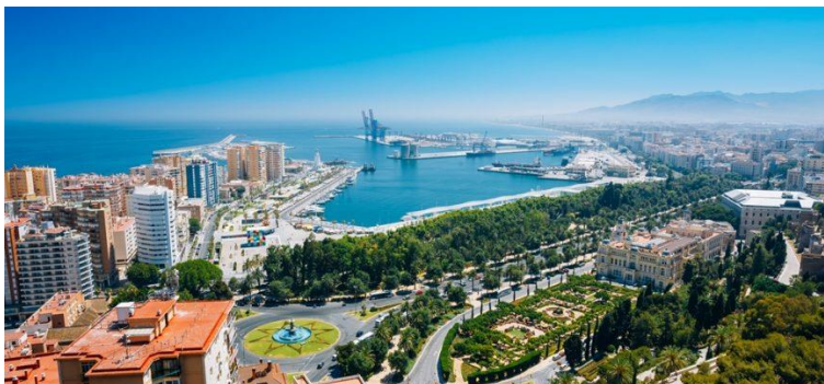
Slika 14. Malaga, Španjolska

Prema tome, ovo hipotetsko putovanje započelo bi na jugu Španjolske blizu Gibraltarskih vrata, to jest u gradu Malagi te bi se krenulo prema Valenciji gdje je Matvejević u domu gostoljubiva kolekcionara našao više vrsnih karata, među kojima i onu koja prikazuje španjolske obale. U Valenciji je također čuo da se stanovnike zaleđa naziva podrugljivim imenima, zapisao je riječ churros .