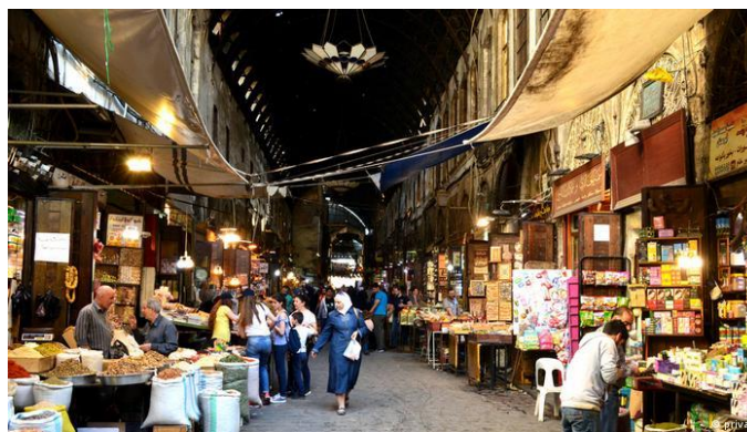
Slika 18. Tržnica u Damasku, Sirija.

Konačno, avionom se odlazi u Egipat na deltu Nila. Narod Kopti, koje spominje Matvejević, imaju egipatske pretke. Egipćani su bili više okrenuti Nilu i delti nego moru. Oni su jedan od najdugovječnijih naroda na Mediteranu, njihova povijest seže u biblijska vremena. Stariji su od Grka i Rimljana, ali su mlađi od naroda Plodnog polumjeseca, to jest Mezopotamije. Njihova je dugovječnost impresivna. Samo još Kina prati takvu dugovječnost i izdržljivost.