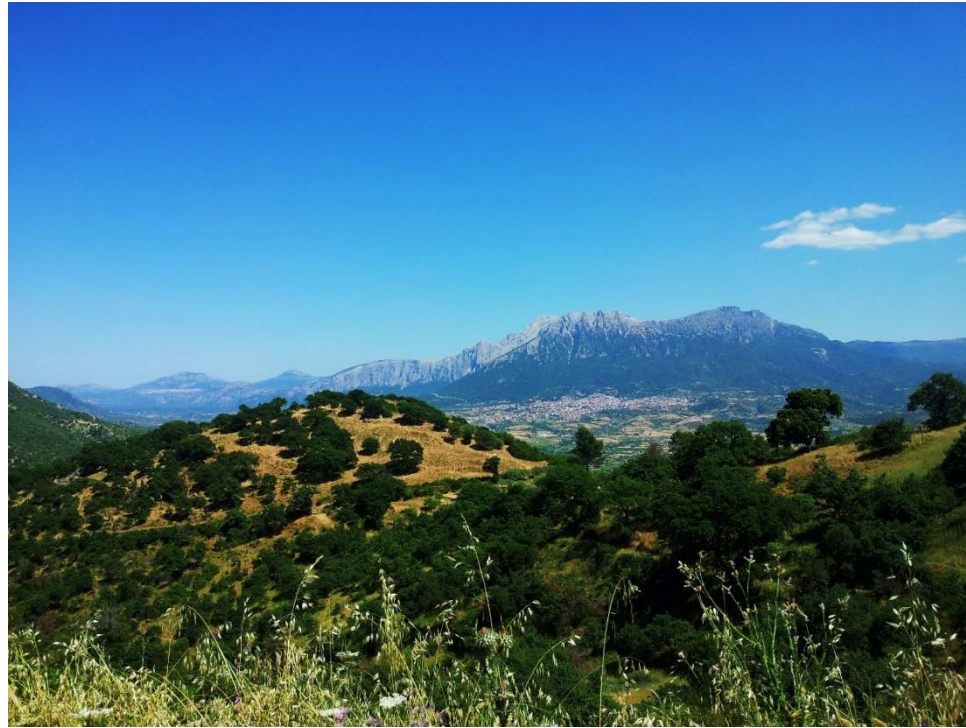
Slika 5. Brdovito područje Barbagie na Sardiniji gdje ljudi doživljavaju duboku starost.

Zajedničke značajke života tamo gdje ljudi dožive duboku starost pretežno su biljna prehrana, izbjegavanje pušenja, svakodnevna umjerena tjelesna aktivnost, popodnevno drijemanje, bogat društveni život i čvrste obiteljske veze. 23