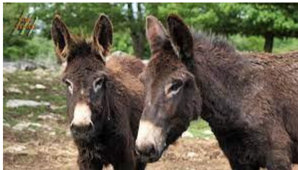
Slika 9. Dugouhi istarski magarac.

Neobičan je to završetak Mediterranskog brevijara , no možda i najprimjereniji. Svaki je detalj Mediterana bitan koliko god se čini smiješnim ili apsurdnim. Svaka napomena u knjizi kroji priču o Mediteranu i bez ijedne od njih Mediteran bi bio nepotpun. 70