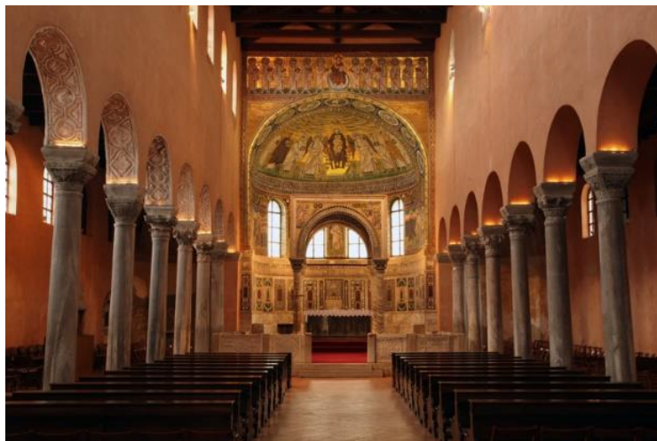
Slika 1. Eufrazijana, Poreč.