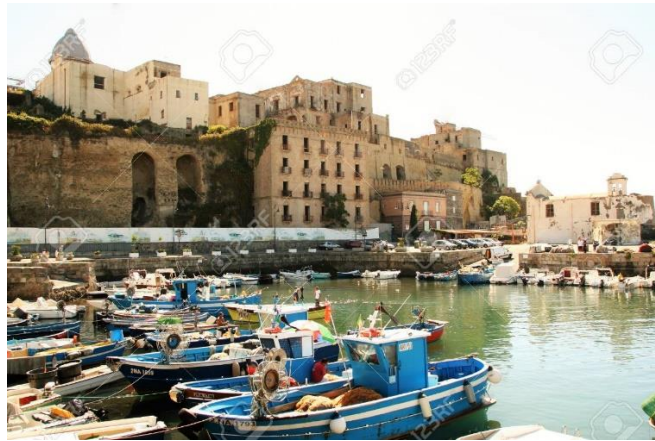
Slika 17. Luka u Pozzuoliju, Italija. (izvor:

Potom se vlakom spušta Apeninskim polutokom. Posjećuju se gradovi Firenza, Pisa i glavni grad Italije – Rim. Italija, zapisao je Matvejević, najviše je mediteranska zemlja u Sredozemlju. Nastavlja se prema Napulju u čijoj se neposrednoj blizini smjestio Pozzuoli u kojemu povijest bilježi jedan od najvećih pothvata lučke inženjerije. Luka se pravila uz pomoć vulkanskog pijeska koji se uz dodir s vodom pretvara u najtvrdi cement. Seneka je tu luku smatrao jednim od čuda ovoga svijeta.