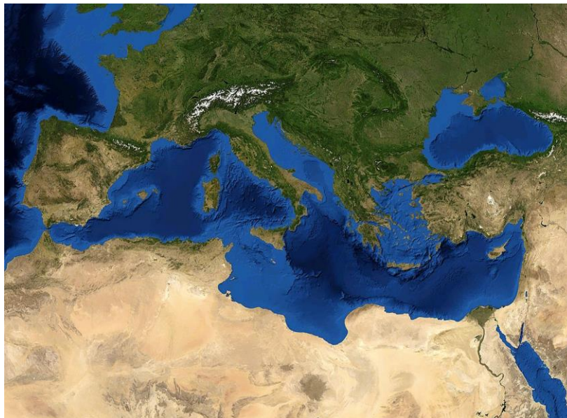
Slika 3. Reljefni prikaz Mediterana.

Tradicijska kultura Mediterana neizostavno, uz mnoge druge pojavnosti, uključuje i hranu – njen uzgoj, obradu, pripremu i konzumaciju. Hrana je kao svakodnevna potreba usko povezana s mnogim ljudskim djelatnostima. Posebno dinamične procese znala je potaknuti u godinama nestašice. Različiti povijesni kulturni slojevi, koji su ostavljali tragove na mediteranskom tlu, mogu se pažljivijim praćenjem uočiti i danas u tradicijskim, još uvijek prisutnim, prehrabnim navikama njegovih stanovnika.