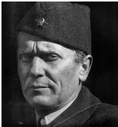
Slika 5. Josip Broz Tito

„To su razlozi što su Tita još za života mnoge zemlje svijeta proglasile državnikom 20. stoljeća. Zato nije slučajno da u 19 zemalja na svim kontinentima svijeta (osim Australije) u 57 gradova i svjetskih metropola, od New Delhija, Kaira, Alžira, Moskve, Londona, Washingtona, Mexica i drugih, trгови i ulice nose ime maršala Tita, povijesne osobe koje obilježila 20. stoljeće.“ 63