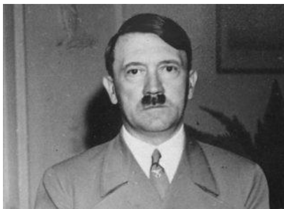
Slika 3. Adolf Hitler