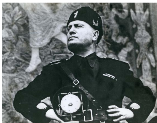
Slika 2. Benito Mussolini (Il Duce) – vođa talijanskog fašizma