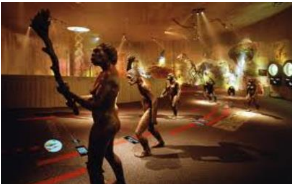
Slika 8: Muzej krapinskih neandertalaca

muzeja svijeta. Bogat najnovijim tehnološkim dostignućima uz brojne vizualne, olfaktivne i ine senzacije, donosi nam fascinantno svijet neandertalaca, ali i baca nas u vrijeme samog početka svijeta pa tako posjetitelji mogu uživati u rekonstrukciji kozmičke evolucije i bar na tren osjetiti svu snagu prapočetka. Jedan od najatraktivnijih detalja - prijelaz preko leda uklopljen je u dijelu Muzeja koji govori o duhovnom svijetu neandertalaca i njihovim navikama. Dok slušate krckanje leda i gledate kako navire voda, kao da u daljini riču mamuti, a vi svjedočite kraju jednog doba...Posebno je zanimljivo tijelo neandertalca na bolesničkom krevetu kojeg mogu "istraživati" čak četvero posjetitelja istodobno i na tri jezika doći o informacijama o njegovim ozljedama uz ilustrirane fotografije i rendgenske snimke. 57 Na Slici 8. prikazan je Krapinski čovjek u muzeju krapinskih neandertalaca u Krapini te se jasno mogu vidjeti prethodno opisani detalji izgleda muzeja.