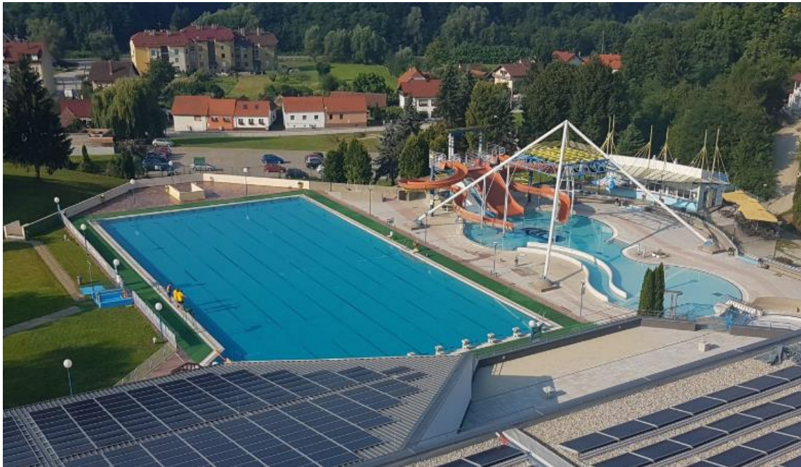
Slika 5.: Varaždinske toplice

Hrvatske. Rehabilitacijski centar Varaždinske toplice u ponudi ima medicinske procedure, fizikalne postupke, laboratorijske pretrage i termalne bazene, u kojima se izvodi hidromasaža, masaža putem vodenih slapova i opuštanje u termalnoj vodi.