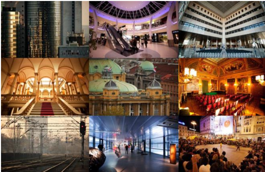
Slika 11.: Zagreb – grad kulturnog turizma