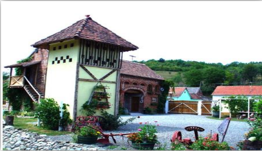
Slika 4.: Etno eko selo Stara Kapela (Brodsko – posavska županija)

obližnja lovišta.“ 49 Etno eko sela omogućavaju odmor u kućicama u prirodi, koje su udaljene od gradskih središta i buke, okružene zelenilom, cvrkutom ptica, ravnica, poljima, rijekama, dvorcima, mirisnom, svježom i zdravom hranom i pićem iz ekouzgoja seoskih domaćinstava (meso, sir, mlijeko, voće, povrće, vino, te dr.).