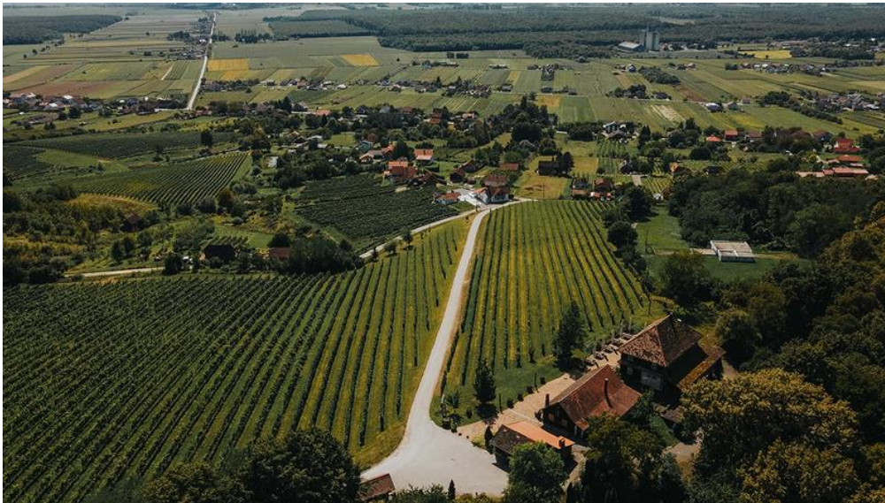
Slika 13. Moslavačka vinska cesta (Turistička zajednica grada Kutine, 2021.)

Na obroncima Moslavačke gore smjestile su se brojne kleti, seoska gospodarstva, vinarije i vinogradi. Vinova loza vrlo je važan identitet Sisačko-moslavačke županije. Moslavina raspolaže kvalitetnim vinogorjima koji su spojeni Moslavačkom vinskom cestom. Vinska cesta se smatra ljepotom prirodnog krajolika Moslavine i važnom turističkom atrakcijom Sisačko-moslavačke županije (Turistička zajednica grada Kutine, 2021).