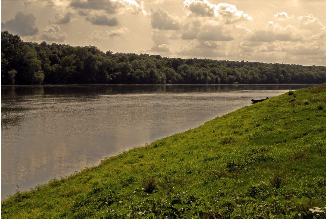
Slika 2. Rijeka Sava

su imale veliki značaj za lokalno stanovništvo te rast i razvoj zajednice. Sava ima veliki ekološki značaj, kako za Sisačko-moslavačku, tako i za susjedne županije (Jukić, 2008, str. 20-25).