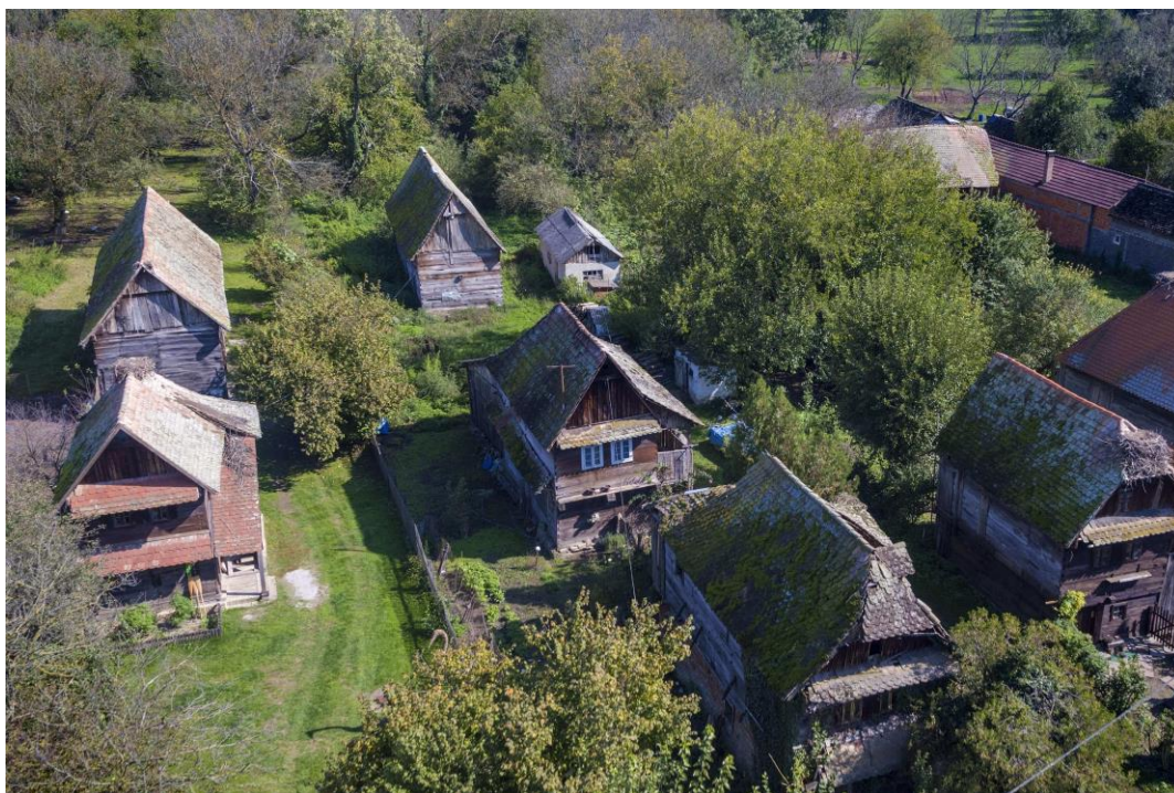
Slika 12. Selo Čigoč

Selo Čigoč, koje spada pod sustav grada Siska, smjestilo se u Sisačko-moslavačkoj županiji na desnoj obali rijeke Save. Proglašeno je, od strane njemačke Zaklade Euronatur, prvim europskim selom roda 1994. godine. Rode spadaju pod najpoznatije ptice selice u Europi. Na krovovima i dimnjacima većine selskih kuća rode obitavaju, grade i čuvaju svoja gnijezda zajedno sa svojim mladuncima. Selo Čigoč okruženo je pašnjacima, ravnicama i livadama te lokvama i barama u kojima rode pronalaze hranu za sebe i svoju mladunčad. Selo je dobilo ime po rodama jer ih je brojčano više nego stanovnika. Unutar Čigoča nalazi se nekoliko etnoloških zbirki, a poznatija je Etnološka zbirka obitelji Sučić. Selo je prepoznatljivo po tradicijskoj arhitekturi drveno građenih kućica (hiža) od kojih su neke starije i preko 200 godina (Park prirode Lonjsko polje, 2021).