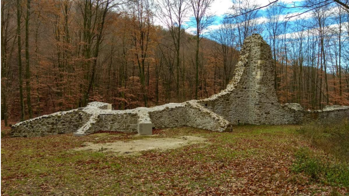
Slika 9. Pavlinski samostan blažene Djevice Marije (Hrvatsko planinarsko društvo Pliva, 2021.)

Pronašao je komad kamenog zida ukrašen značajnim ornamentima i zmajem kada je obilazio Samostan. Danas je taj komad kamenog zida pohranjen u Muzeju Moslavine. Do dana današnjeg, nisu provedena značajna arheološka istraživanja te Bela crkva i dalje krije mnoge tajne (Kovačević, 1991-1992, str. 57-64).