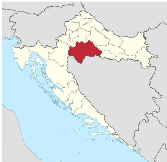
Slika 1. Geografski položaj Sisačko-moslavačke županije

Sisačko-moslavačka županija smještena je u središnjem dijelu Republike Hrvatske s administrativno-teritorijalnim središtem u gradu Sisku. Okružena je Karlovačkom, Zagrebačkom, Bjelovarsko-bilogorskom, Brodsko-posavskom i Požeško-slavonskom županijom. Sisačko-moslavačka županija obuhvaća Banovinu, Moslavinu, Posavinu te dijelove Slavonije i Korduna. Iznimno je dobro povezana s ostalim dijelovima Hrvatske te ima dobar prometno-geografski i prirodni položaj. Spada među najveće županije Republike Hrvatske zbog svoje površine od 4 468 km 2 . Ima razvijenu naftnu, prehrambenu, farmaceutsku i petrokemijsku industriju te šumarstvo, poljoprivredu, trgovinu, ugostiteljstvo i graditeljstvo (Turistička zajednica Sisačko-moslavačke županije, 2021). Sisačko-moslavačka županija bogata je kulturno-povijesnim i krajobraznim vrijednostima te geotermalnim izvorima koji predstavljaju veliki potencijal za njen ekonomski rast i razvoj. Turistički proizvodi selektivnog turizma okrenuti su, u sve većoj mjeri, prema kulturnom naslijeđu i njegovom vrednovanju. Razvoj selektivnih oblika turizma omogućen je zbog rijetke naseljenosti te očuvanosti moslavačke tradicije i prostora. Na prostoru Županije razvijen je zdravstveni, lovni, seoski, ruralni, cikloturizam i gastroturizam. Usprkos svemu, turistički potencijali nisu dovoljno dobro iskorišteni za daljnji napredak i razvoj Sisačko-moslavačke županije (Moslavac, 2020, str. 26-30).