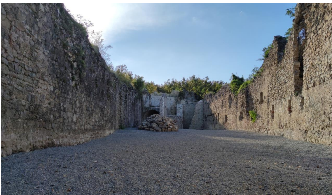
Slika 8. Unutrašnji prostor starog grada Jelengrada 2021. godine