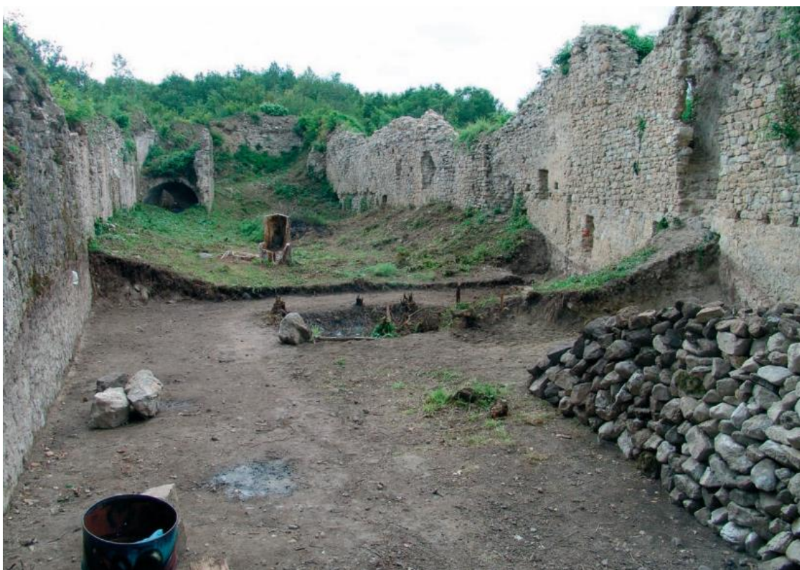
Slika 7. Unutrašnji prostor starog grada Jelengrada 2012. godine