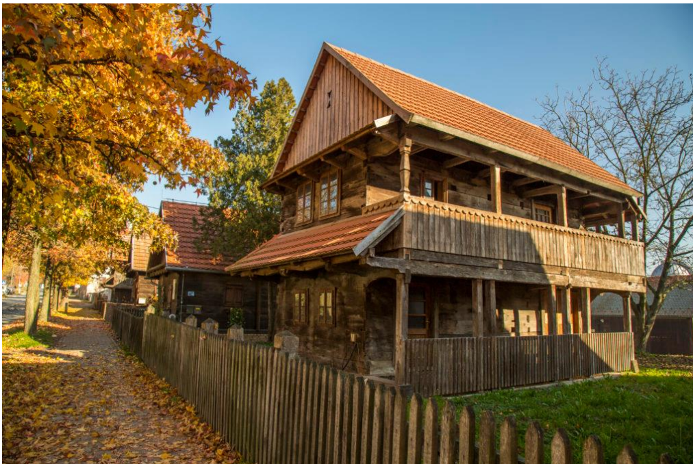
Slika 6. Tradicionalna drvena kuća

Tradicija se smatra oblikom povijesnog svjedočanstva o vjerovanjima neke zajednice, u ovom slučaju, Sisačko-moslavačke zajednice. Sva svjedočanstva zajednice manifestiraju se u tradicionalnoj arhitekturi koja se koristi mnogim drvenim detaljima. U tipičnom agrarnom prostoru izgled sela bio je karakteristične drvene građe. U takvom selu stanovništvo se bavilo obradom zemlje i stočarstvom. Iza širokih dvorišta nalazile su se oranice, pašnjaci, vrtovi, vinogradi, voćnjaci i šume (Moslavac, 2010, str. 91-93).