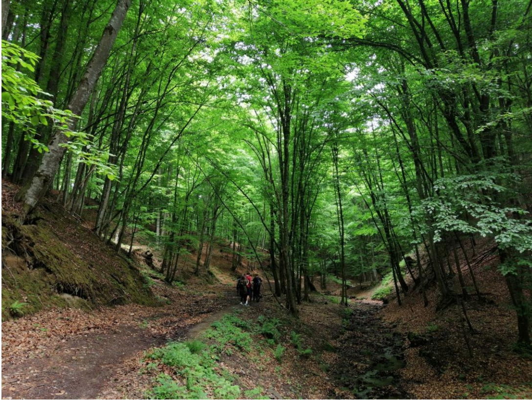
Slika 5. Šumska vegetacija Moslavačke gore (Turistička zajednica grada Kutine, 2021.)

povijesni gradovi kao što su Jelengrad, Košutgrad i Garić-grad (Turistička zajednica grada Kutine, 2021).