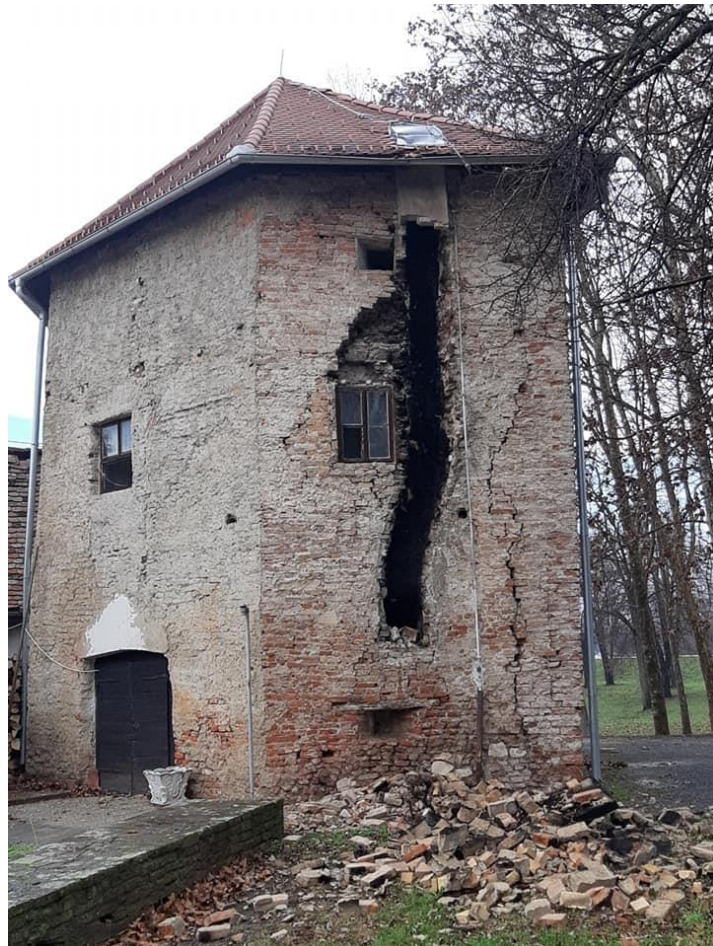
Slika 11. Kula tvrđave Sisak nakon potresa (Gradski muzej Sisak, 2020.)

Tvrđava Sisak ili Stari grad Sisak iz 16. stoljeća nalazi se na jugoistočnom rubu grada Siska te spada pod nizinsku fortifikaciju. Velikim dijelom je zaštićena vodenim tokom rijeke Kupe. Trokutastog je oblika te na rubovima ima masivne okrugle kule koje spajaju ravne zidine duljine oko 30 metara. Na kulama se nalaze kružni stožasti krovovi. Ulaz u Tvrđavu nalazi se kod sjeveroistočne kule. Na kulama se nalaze topovski otvori koji su služili u obrambene svrhe. Do dana današnjeg sačuvana je u gotovo izvornom obliku (Turistička zajednica grada Siska, 2021). Tijekom potresa koji se dogodio u prosincu 2020. godine tvrđava Sisak je stradala te su uzrokovane mnoge unutarnje i vanjske štete na njenim zidinama i krovu (Gradski muzej Sisak, 2021).