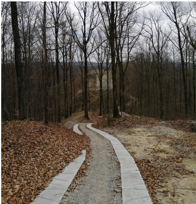
Slika 14. Betonski put za vozila do Jelengrada

nekoliko putokaza te su napravljene stube koje omogućuju kretanje do utvrde po dozvoljenom području i na taj način ju štite. Kako ne bi došlo do devastacije zidina Jelengrada, nije dozvoljeno uništavati bršljan koji prirodno raste po njima, učvršćuje ih i na taj način čuva od urušavanja. Na Jelengradu su pronađeni tragovi vučedolske kulture koja ima veliki značaj za razvoj kulturnog turizma (Moslavac, 2020, str. 46-53). Usprkos svemu, povijesni lokalitet Jelengrad potrebno je zaštititi od masovnog turizma kako ne bi došlo do neželjenih posljedica kao što su: dodatno propadanje Utvrde, neodgovorno ponašanje posjetitelja i onečišćenje prostora. Problem se javlja kada turizam krene uništavati kulturnu baštinu i mijenjati okolinu s ciljem veće zarade. Jelengrad ima veliki potencijal kada je u pitanju razvoj kulturnog turizma. Od 2020. godine posjetiteljima je omogućeno da se sa svojim osobnim vozilima spuste do Utvrde. Postavljeno je nekoliko klupica i stolova kako bi boravak u Jelengradu postao što udobniji posjetiteljima (Moslavac, 2020, str. 67-75).