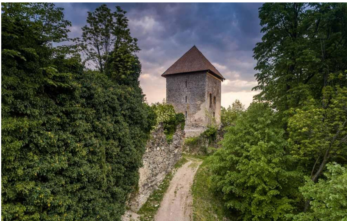
Slika 10. Garić-grad