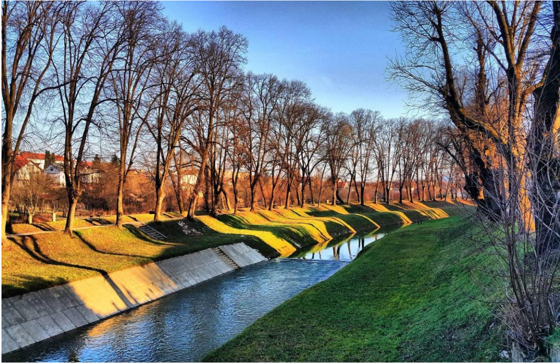
Slika 4. Rijeka Petrinjčica (Grad Petrinja, 2021.)