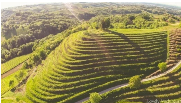
Slika 2: Mađerkin breg; izvor: www.lovelymedjimurje.com

Mađerkin breg zanimljiv je turistički lokalitet privlačan mnogim posjetiteljima. Nalazi se na 341 metar nadmorske visine u malom mjestu Robadje u gornjem Međimurju. Za vrijeme vedrog vremena pogled sa ove lokacije