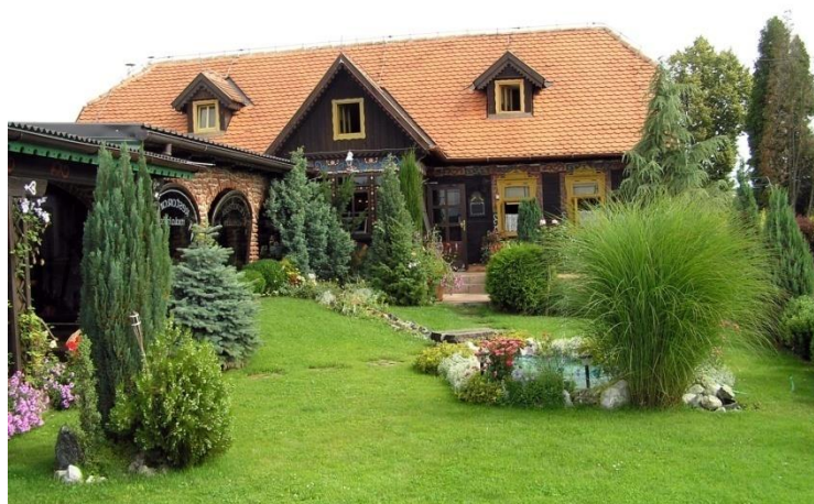
Slika 7: Restoran Mala hiža; izvor: www.mnovine.hr

Restoran Mala hiža nalazi se u Mačkovcu kraj Čakovca i slovi za jedan od najpoznatijih i najboljih restorana kontinentalne Hrvatske. Da to nije tek legenda, nego i istina govore brojne nagrade koje je ovaj restoran kroz godine rada prikupio. Restoran je usmjeren na ponudu domaće, tradicionalne hrane, ali se tu ne ograničavaju, već oplemenjuju tradicionalnu kuhinju modernom.