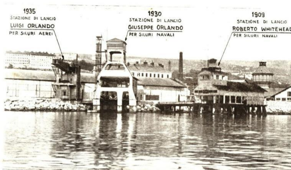
Slika 6 Pogled na građevinu lansirne rampe za ispitivanje torpeda u Rijeci