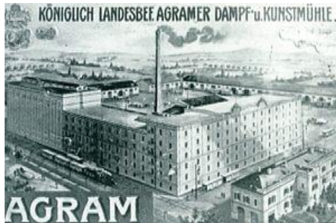
Slika 3 Paromlini kompleks 1914. godine