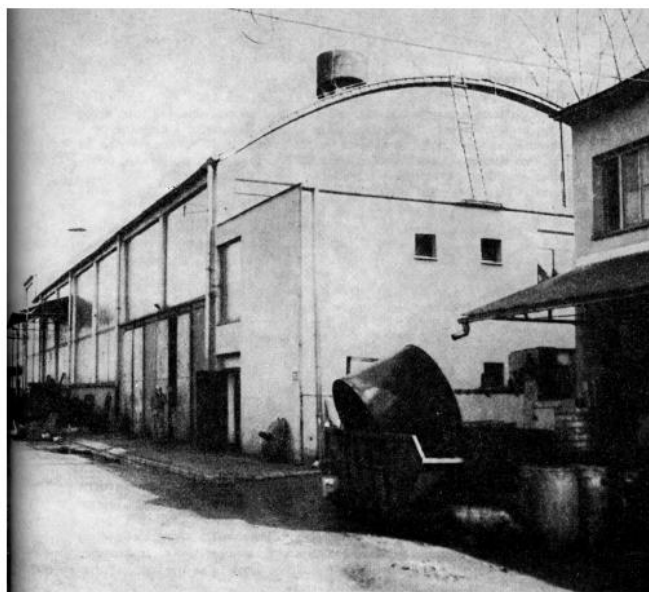
Slika 4 Pamučna industrija Duga Resa OOUR Ijevaonica i obrada metala