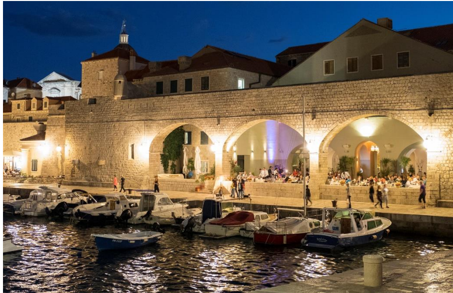
Slika 2 Gradska kavana Arsenal, Dubrovnik