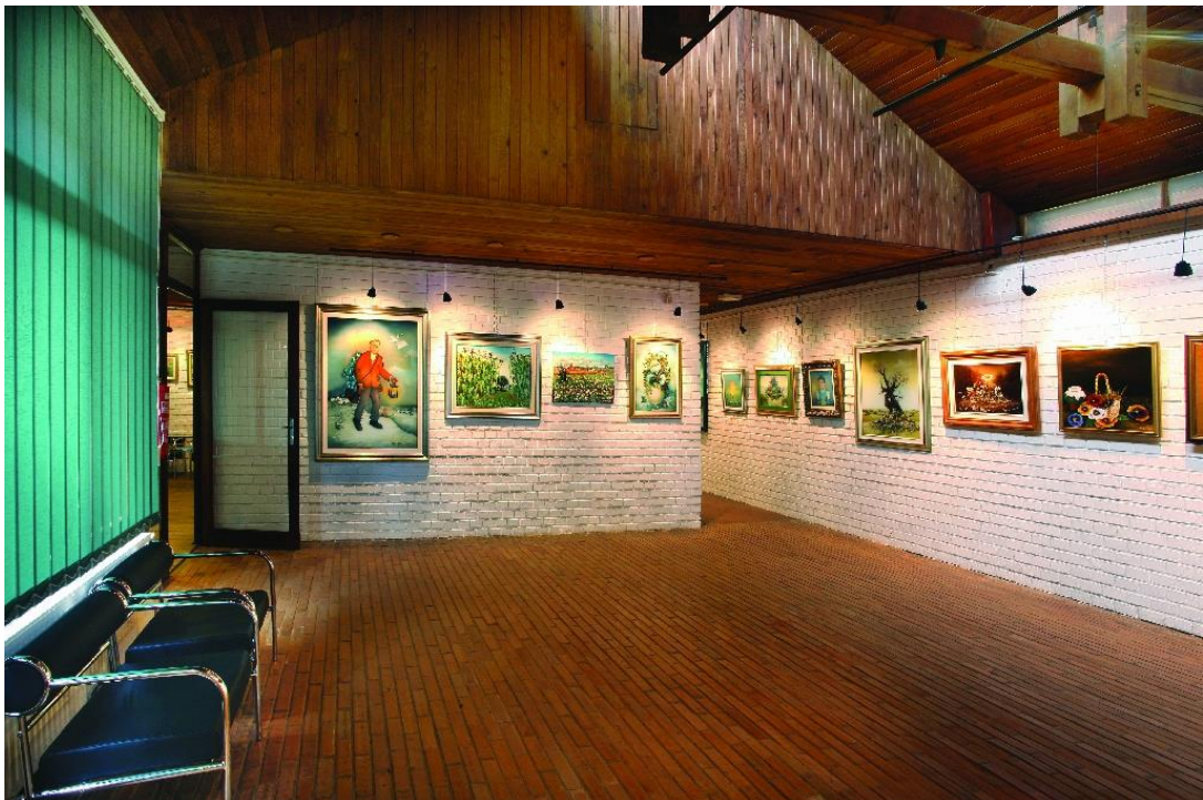
Slika 7. Galerija naivne umjetnosti u Hlebinama