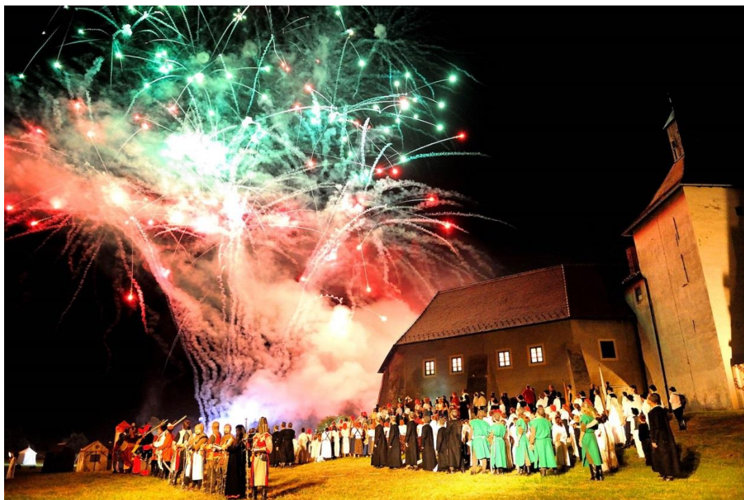
Slika 10. Scenski prikaz Picokijade

Legenda se od nastanka dopunjavala i scenski usavršavala, što je najvećim dijelom ovisilo o inovacijama redatelja i materijalnim mogućnostima organizatora. U izvođenju legende sudjeluje 300-400 glumaca i statista, uz tehničko osoblje, konjanike i zapregu, a svake godine oduševi više od 10 000 posjetitelja. S vremenom se Legenda obogaćivala tonskim, svjetlosnim i pirotehničkim efektima prema zamisli redatelja. Za izvođače se iznajmljuju posebni kostimi iz kazališnih kuća, a izrađuju se i vlastiti, kao i potrebni rekviziti i kulise. Legenda o Picokima bila je inspiracija mnogim piscima, glazbenicima i likovnim umjetnicima (slika 10).