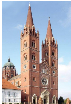
Slika 10 Pročelje katedrale

Tornjevi su u sklopu pročelja i sa srednjim dijelom čine jedinstvenu i skladnu crkvenu fasadu. Potpuno su isti, visoki 84 metra, četverokutni i razdijeljeni u 5 katova. Katovi su odijeljeni uskim obodom s ornamentikom po našim narodnim motivima. Zadnja dva kata imaju vrlo lijepe dvostruke romaničke prozore nadsvođene zajedničkim lukom. Zvonici završavaju s 28,45 metara visokim čunjevima od okrugle pečene opeke s kamenim tulipanskim vrškom. Na mjestu gdje se na četverokutne zvonike nasaduju čunjevi, u uglovima se nalaze ukrasni tornjići i visoki prozori s kojih se otvara predivan pogled na slavonske ravnice.