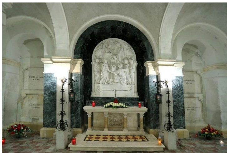
Slika 9 Oltar u kripti đakovačke katedrale