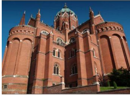
Slika 5 Pogled na katedralu iz ulice Luke Botića