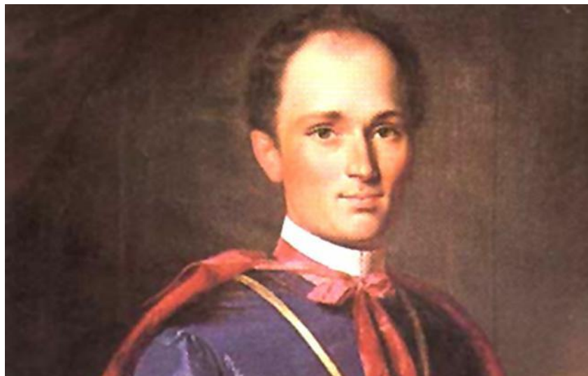
Slika 1 Mladi Strossmayer za vrijeme školovanja

enstvo bilo je za kapitularnog vikara dra. Josipa Josipa Matića. Jelačiću je tu prevagnuo na Strossmayerovu stranu, a uz to je i biskup Kuković pisao dopis caru i molio ga da Strossmayera postavi na mjesto biskupa. Zbog toga je 18. studenoga 1849. uslijedilo njegovo imenovanje.