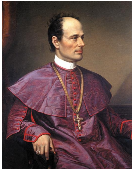
Slika 2 Strossmayer u biskupskoj odori

Strossmayer se istaknuo i u djelovanju i razvoju narodnjačkog pokreta u Istri, zajedno sa studentskim kolegom iz Augustineuma u Beču, biskupom J. Dobrilom. Bili su kolege, prijatelji i istomišljenici koji su se zajedno zalagali za podupiranje narodnjaštva na Istarskom poluotoku. Oni se smatraju jedinim ilircima koji su sva svoja ilirska, nacionalno-politička mišljenja ostvarili i proveli u djelo, dok su se ostali predstavnici više bazirali na književno i duhovno stvaralaštvo. Obojica su poticali kulturne institucije Hrvatskoj, a biskup Dobrila poticao je i izlaženje prve novine na hrvatskom jeziku u Istri. Njihovi slični stavovi, potaklo ih je i na poticanje čitaoničkog pokreta u Istri. Strossmayer se iznimno zalagao za podupiranje hrvatskih čitaonica s narodnjačkim obilježjima. Podupirao ih je samoinicijativno ili na zamolbu biskupa Dobrile s kojim je blisko surađivao. Strossmayer je čitaonice smatrao žarištem izvornih narodnjačkih misli i mjesto otpora protiv talijanizacije, mađarizacije i germanizacije, te je zbog toga slao financijsku potporu narodnjačkom pokretu u Istri.