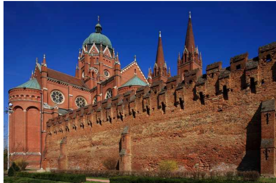
Slika 3 Ostaci zapadnog zida utvrde

atrakcija. Nakon rušenja postojeće crkve, bosanski biskupi izgradili su novu i u nju prenose stari titular slavne crkve iz Brda u Bosni. 24