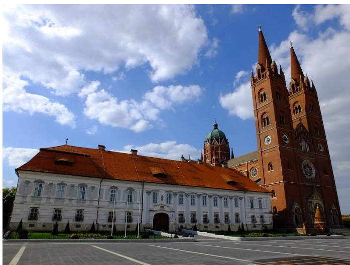
Slika 4 Đakovačka katedrala s biskupskim dvorom