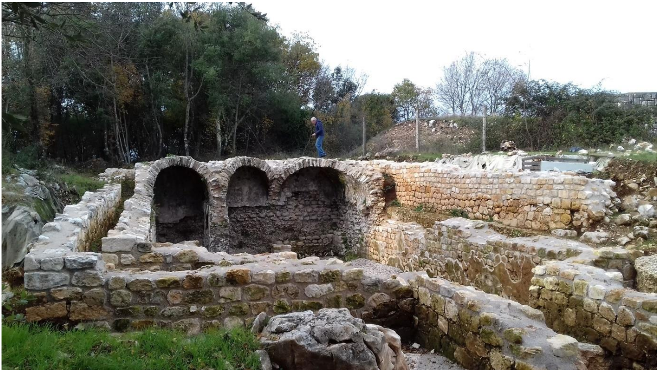
Slika 8. Prapovijesno nalazište Mukaba

Gradina Mukaba nalazi se na vrhu brda Moncalvo na nadmorskoj visini od 115 metara s koje se pruža pogled na otvoreno more na zapadu i gotovo čitav Linski kanal. Sa zapadne strane brda nalazi se rimsko nalazište nazvano Finida. Gradinu okružuju ruševine dvaju kamenih bedema, a na ovom prostoru nalaze se i dvije velike kamene gomile te treća na najsjevernijem dijelu u neposrednoj blizini. Sjeverozapadnom dijelu platoa relativno je lako prići te je tamo stratigrafija dobro očuvana. Prilikom istraživanja pronađeni su mnogobrojni ostatci keramike; ulomci dvaju plitkih zdjela što će naposljetku omogućiti rekonstrukciju čitavih posuda. Pronađeni su i ulomci s dodanom trakom ukrašenom otiscima prsta, aplikama kružića i obrnutog slova U. Osim brojne keramike, za koju je preliminarnom analizom utvrđeno da pripada srednje brončanom dobu, otkriveni su brojni nalazi životinjskih kostiju (Ibid., https://ffpu.unipu.hr/cirla/projekti/archaeocultour/nalazista , pristupljeno 21.7.2021.).