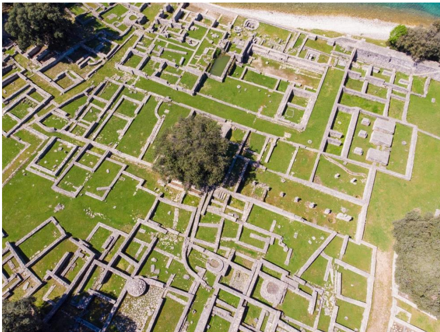
Slika 3. Nalazište na Brijunima