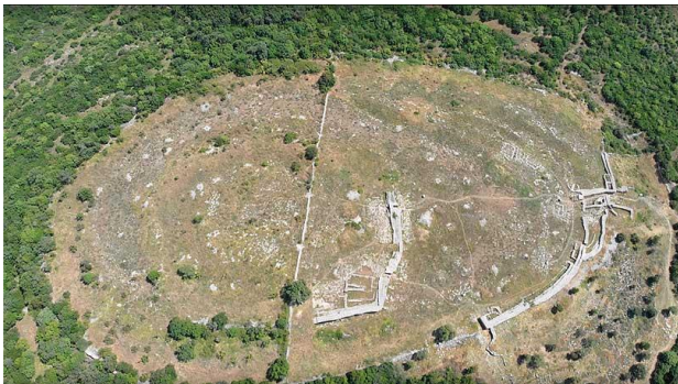
Slika 5. Monkodonja

Monkodonja je brončanodobno naselje smješteno na uzvisini iznad ravnice koja seže sve do mora, 5 kilometara istočno od Rovinja. Od 1997. najopsežnije istraživanje brončanodobnog naselja provodi tim na čelu s arheolozima Arheološkog muzeja Istre u Puli. Do sada su uspjeli otkriti tehnike i načine gradnje, pročitati urbani raster znanja, a iz toga i socijalnu sliku stanovnika. Lokalitet ima sve pretpostavke atraktivnog arheološkog parka. Naselje je smješteno na platou brijega 81 metar nad morem, te je u obliku nepravilne elipse i opasan trima koncentričnima bedemima. Istraživači pretpostavljaju da je na tri razine naselja živjelo oko tisuću ljudi, a da su na samom vrhu bile kuće najvišeg sloja zajednice. Utvrđene su značajne razlike između gradnje kuća, od kojih je svaka imala ognjište, a bile su odijeljene prolazima ili ulicama. Gradina je bila nastanjena od 18. do 12. st. pr. Kr. (Ibid., str. 39.). Monkodonja je danas opremljena osnovnim informacijama uz pomoć kojih posjetitelji mogu samostalno obilaziti prezentirano nalazište. 2001. tiskana je popularna knjižnica s prezentacijom rezultata iskopavanja Monkodonje i podacima o prapovijesti šireg prostora Rovinjštine. U najavi je izgradnja muzeja u kojem bi trebali biti pohranjeni i prezentirani nalazi te u sklopu kojeg bi se nastavilo istraživanje brončanog razdoblja Istre (Ibid., 2011;120.).