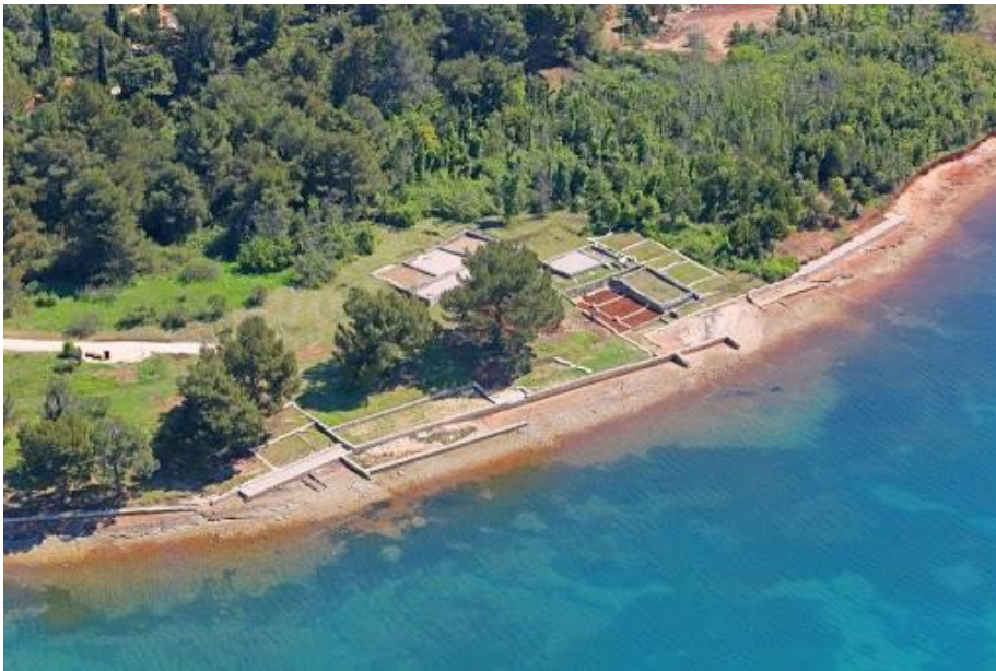
Slika 4. Arheološki park Vižula

Vižula je arheološki lokalitet pokraj Medulina za koji je potvrđeno da je bio naseljen od neolitka do ranog srednjeg vijeka. Istraživači su prvo istražili ostatke neolitičkog naselja koliba od šiblja oblijepljenih zemljom i blatom. Pronašli su ulomke keramike i dijelova posuđa iz tog vremena. Već nekoliko godina istražuje se rezidencijalna obalna vila iz 1.-2. st. za koju su utvrđene tri faze gradnje do 6. st. Ostatci arhitekture govore da je vila bila trijemom otvorena prema moru, a djelomično je sačuvan pod koji je ukrašen mozaikom. Zatim, jasni obrisi bazena, vodospreme, sanitarnog čvora, olovne i zidne kanalizacije. Pronađeni ostatci infrastrukture govore da se u vili živjelo vrlo komotno, imala je sustav podnog grijanja kakav se koristi i u suvremenoj gradnji. Vižula ima dobre izgleda da postane arheološki park u pravom smislu riječi, nakon što istraživači zaokruže cjelinu svojih nalaza.