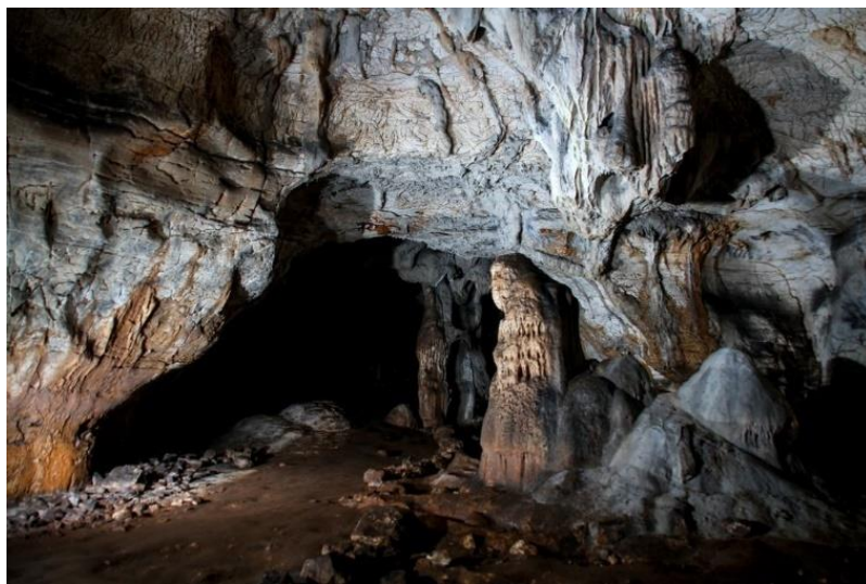
Slika 6. Romualdova pećina

Romualdova pećina ime je dobila po svetom Romualdu, koji je u njoj boravio od 1001. do 1003. On oko 1000. dolazi u Istru, u obližnji samostan Sv. Mihovila. Kako bi se posvetio asketskom i isposničkom životu sklanja se u jednu manju pećinu na sjevernoj strani Limskog kanala, nedaleko od spomenutog samostana. No, pošto je u toj pećini bio često posjećivan od strane okolnog stanovništva, povlači se u izoliranu pećinu – Romualdovu. Posljednjih 10ak godina Romualdova se pećina počela koristiti u turističke svrhe, a svake je godine posjećuje sve veći broj turista. Uređena je pristupna staza od dna Limskog kanala, koja vodi do same pećine. Na početku staze, uz nju te na ulazu nalazi se više info panoa u kojima se nalaze opisi Limskog kanala, Romualdove pećine, njene faune te detalji i zgrade iz njene prošlosti, koja seže više od 40 000 godina unatrag. Turiste po pećini vode speleolozi, a posjetitelji mogu vidjeti geomorfološke spiljske ukrase, mjesto na kojem je po predanju obitavao sveti Romauld, brojne šišmiše te arheološke sonde u kojima su vidljivi ostatci proteklih vremena. Novi pristupi, poput obogaćivanja ponude, bolje prezentacija kroz raznovrsne kombinirane arheološko-turističke projekte te naglasak na rijetko prisutnu višeslojnost sadržaja samog lokaliteta mogli bi višestruko povećati broj posjetitelja te unijeti raznolikost u turističku ponudu (Arheološki muzej, 2011;360.).