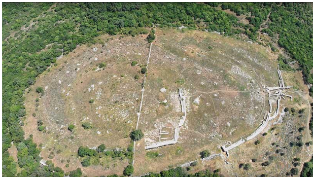
Slika 5. Monkodonja (Izvor: Rovinje, https://rovinj.com.hr/monkodonja/ , pristupljeno 14.7.2021.)

Monkodonja je brončanodobno naselje smješteno na uzvisini iznad ravnice koja seže sve do mora, 5 kilometara istočno od Rovinja. Od 1997. najopsežnije istraživanje brončanodobnog naselja provodi tim na čelu s arheolozima Arheološkog muzeja Istre u Puli. Do sada su uspjeli otkriti tehnike i načine gradnje, pročitati urbani raster znanja, a iz toga i socijalnu sliku stanovnika. Lokalitet ima sve pretpostavke atraktivnog arheološkog parka. Naselje je smješteno na platou brijega 81 metar nad morem, te je u obliku nepravilne elipse i opasan trima koncentričnima bedemima. Istraživači pretpostavljaju da je na tri razine naselja živjelo oko tisuću ljudi, a da su na samom vrhu bile kuće najvišeg sloja zajednice. Utvrđene su značajne razlike između gradnje kuća, od kojih je svaka imala ognjište, a bile su odijeljene prolazima ili ulicama. Gradina je bila nastanjena od 18. do 12. st. pr. Kr. (Ibid., str. 39.). Monkodonja je danas opremljena osnovnim informacijama uz pomoć kojih posjetitelji mogu samostalno obilaziti prezentirano nalazište. 2001. tiskana je popularna knjižnica s prezentacijom rezultata iskopavanja Monkodonje i podacima o prapovijesti šireg prostora Rovinjštine. U najavi je izgradnja muzeja u kojem bi trebali biti pohranjeni i prezentirani nalazi te u sklopu kojeg bi se nastavilo istraživanje brončanog razdoblja Istre (Ibid., 2011;120.).