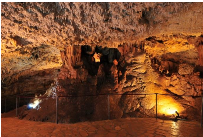
Slika 7. Špilja Mramornica

Špilja Mramornica jedna je od najvećih špilja na području istarskog poluotoka, a smještena je nedaleko od Brtonigle, u sjeverozapadnoj Istri. Mramornice se prvi put spominje još 1770. kada ju je posjetio, a potom i opisao poznati putopisac Alberto Fortis. Dubina špilje na ulazu je 10 metara, a spušta se do 20 metara. Temperatura u špilji je konstantna na 14 °C. Špilju je moguće posjetiti. Špiljske staze su uređene i osigurane pa se s njih mogu vidjeti nedostupni dijelovi Mramornice. Cijene se kreću od 50 kuna za odrasle do 25 kuna za djecu, 40 kuna za studente te 40 kuna za seniore (65+). U špilju se ulazi u pratnji vodiča, a jezici vođenja su hrvatski, talijanski, engleski i njemački (Agroturizam Sterle. http://www.agroturizamsterle.hr/hr/spilja-hr.html , pristupljeno 1.2.2021.).