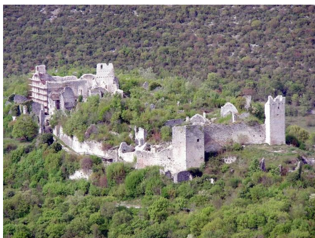
Slika 2. Dvigrad

Dvigrad se počeo istraživati 2001. te su u isto vrijeme istražene dijelove i konzervirali. Riječ je o nekadašnjem utvrđenom srednjovjekovnom naselju, odnosno kaštelu, od kojeg su ostale samo ruševine jer se stanovništvo s vremenom iselilo zbog epidemija i ratnih razaranja. Dvigrad je nastao na jednom od najbitnijih puteva od mora prema unutrašnjosti Istre. U 17. st. u gradu je živjelo tek nekoliko obitelji, a preseljenje župe u obližnji Kanfanar 1714. označilo je kraj Dvigrada. Nalazi keramike govore da je mjesto bilo naseljeno u prehistoriji, a postoji kontinuitet života u antici. Pronađeno je oružje, novac, epigrafski spomenici iz doba kada je Dvigrad bio uključen u sustav obrane sjeverne granice pulskog agera. Oružani sukobi s Venecijom uzrokovali su masovna iseljenja (Heart of Istria, str. 28.)