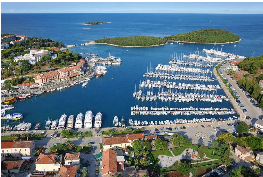
Slika 1. Marina Vrsar

Marina Vrsar smještena je na zapadnoj obali Istre, oko tri kilometra sjeverno od Linskog kanala. Marina se nalazi u samom centru mjesta, a ispred marine proteže se vrsarski arhipelag s 18 otoka i otočića. Izgradnja marine započela je 2000. godine, a temeljila se na prilagodbi postojeće ribarske luke i izgradnji vezova za prihvat plovila bez narušavanja i degradacije fizičkog prostora. Marina Vrsar započela je s radom 2001. godine, a zahvaljujući stalnim ulaganjima u razinu kvalitete i sadržaj turističkog proizvoda, ulaganjima u ljudske potencijale i u samu opremljenost marine, marina Vrsar uspješno posluje dugi niz godina te ispunjava potrebe nautičara, uz uvažavanje i doprinos ispunjenju potreba lokalne zajednice (Montraker d.o.o., Marina Vrsar).