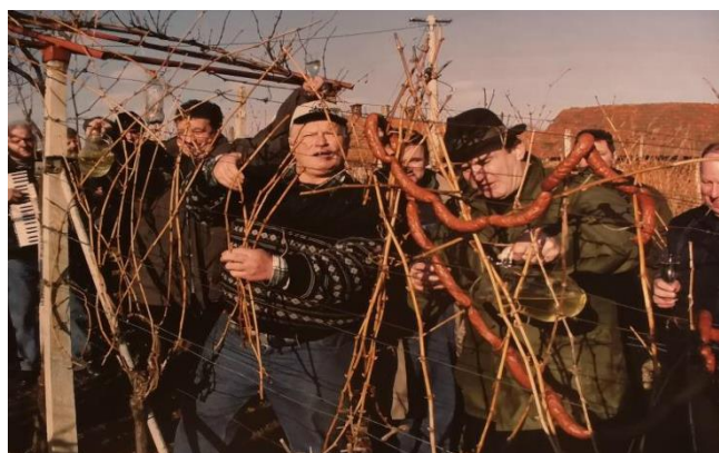
Slika 3. Zalijevanje trsa i kobasica vinom