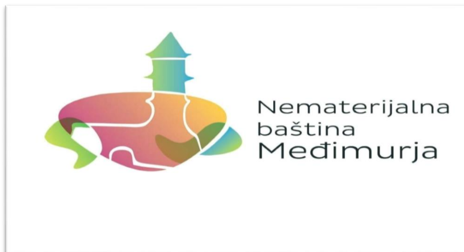
Slika 1. Logo projekta Nematerijalna baština Međimurja