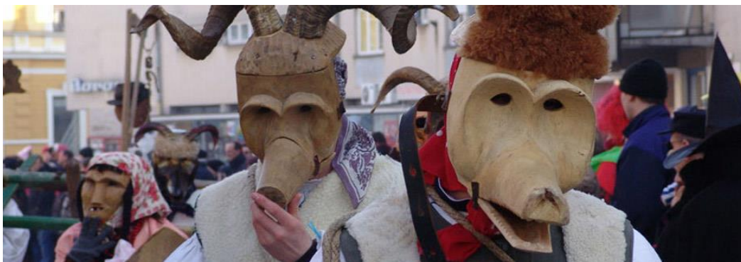
Slika 4. Fašnik u Međimurju

Izvor: (Hranjec, Stjepan: Međimurski narodni običaji , 2011., str. 91.)