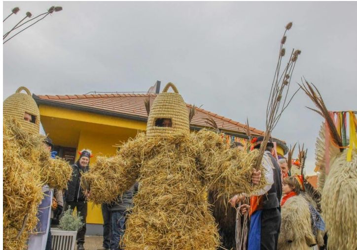
Slika 5. Pikač