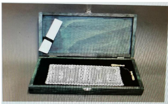
Slika 8. Svetomarska čipka

Izvor: (Kovač, Janja: Ljudstvo moje međimursko, imaš blaga i bogatstva , 2018., str. 29.).