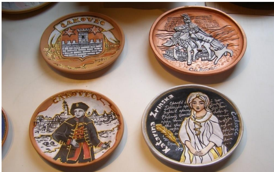
Slika 9. Keramičarski tanjuri s motivima Međimurja