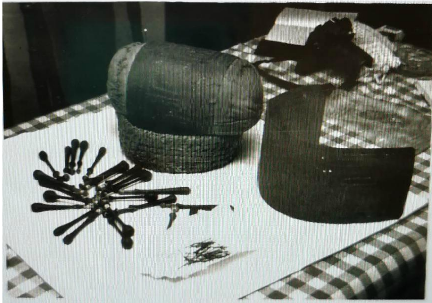
Slika 7. Oprema za izradu čipke