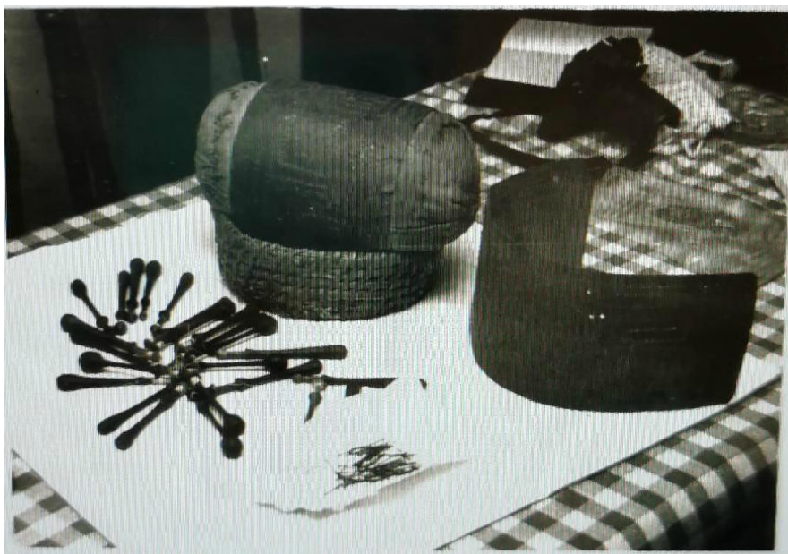
Slika 7. Oprema za izradu čipke