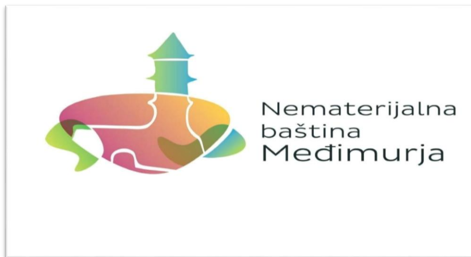
Slika 1. Logo projekta Nematerijalna baština Međimurja

Izvor: (Kovač, Janja: Ljudstvo moje međimursko imaš blaga i bogatstva , 2018., str. 11.).