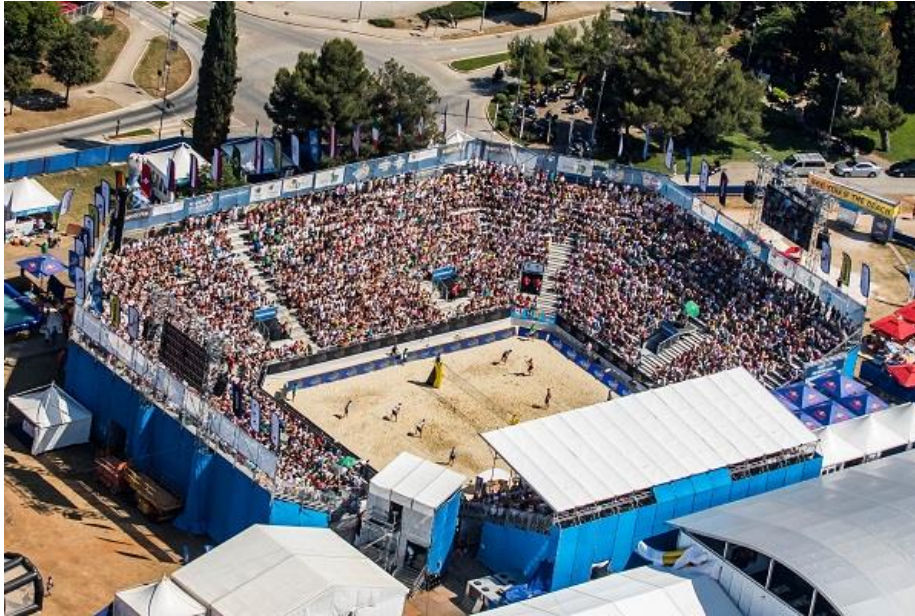
Slika 6. Swatch Beach Volleyball Major Series Poreč

nagradnom fondu, dolaze odbojkaši na pijesku iz cijelog svijeta, to uključuje prvake svijeta i Europe. Turnir je veoma važan za razvoj odbojke na pijesku u Hrvatskoj te i same odbojke općenito. 19