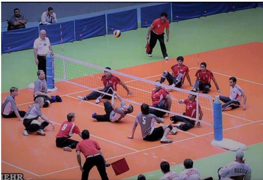
Slika 4. Sjedeća odbojka

Sjedeća odbojka je ušla u paraolimpijski program kao sport za ljude s invaliditetom u Torontu 1976. godine. Iste godine je osnovan WOWD, organizacija za osobe s invaliditetom (World Organization Volleyball for Disabled). Teren je znatno manje, mreža je na visina od jednog metra te igrači moraju biti uvijek na terenu kada dodiruju loptu. 16