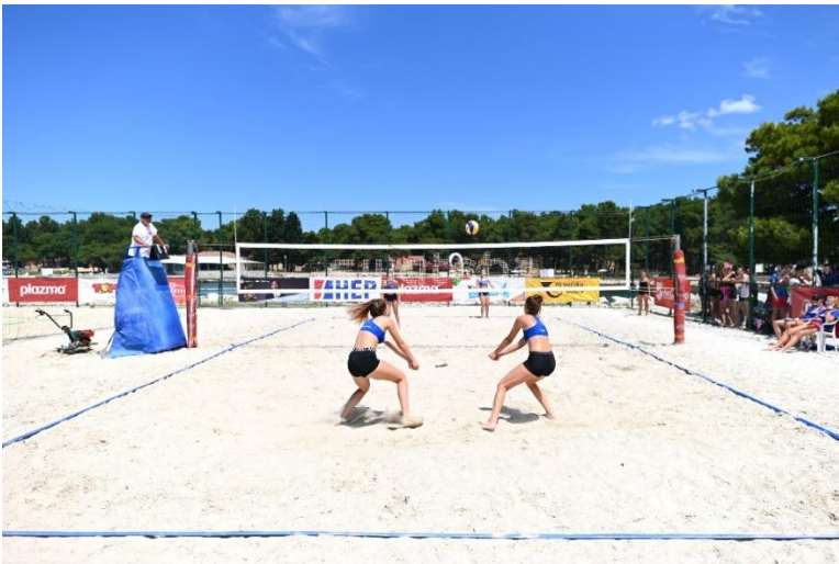
Slika 7. Natjecanje u odbojci na pijesku u sklopu Sportskih igara mladih u Splitu

„Sportske igre mladih najveća su amaterska sportska manifestacija u Europi i svojevrsni fenomen koji svojom tradicijom dugom 24 godine svjedoči kako dobra vizija, sustavan rad i upornost mogu prevladati sve izazove i stvoriti jedinstven brend koji su prepoznale i podržale mnogobrojne svjetske institucije, vrhunski sportaši i dužnosnici i sponzori. Povezuju sve svoje dionike i uključuju ih u pozitivnu sliku i ugled koji grade godinama kao promotor zdravog načina života i društvenih vrijednosti među djecom i roditeljima. Iako se Igre bave amaterskim sportom, sve aktivnosti se rade prema standardima profesionalnih natjecanja koja uključuju profesionalne sportske terene, educirane suradnike kineziologe i profesore tjelesnog odgoja, profesionalne suce, delegate i vrhunski event management.“ 21 U sklopu sportskih igara mladih u Splitu organiziraju se i natjecanja u odbojci i odbojci na pijesku. Regionalna natjecanja održavaju se u par gradova u Hrvatskoj u određenim skupinama i pobjednici svakog regionalnog natjecanja plasiraju se na Državnu završnicu koja se održava u Splitu.