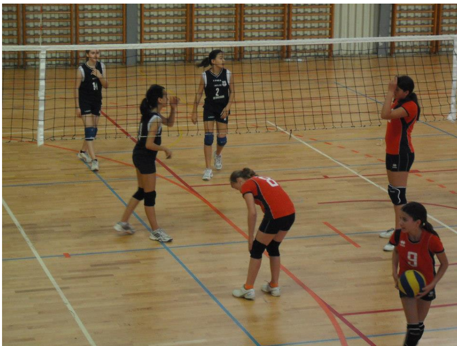
Slika 3. Mini odbojka

Mini odbojka je namijenjena za mlađe uzraštaje, pravila su znatno drugačija od prave odbojke i igra se na manjem terenu s manje igrača, tri igrača te se igra s laganijom loptom. Praktično rješenje da se uključi što više mlađih naraštaja u odbojkašku aktivnost. „Pojednostavljeno rečeno „ Mini odbojka didaktičko je prilagođavanje igre odraslih na djecu“. Mini odbojka omogućuje djeci da imitiranjem igre po pravilima odraslih, veselom i privlačnom igrom, lagano i brzo usvoje osnovnu tehniku i elementarnu taktiku odbojkaške igre.“ 15