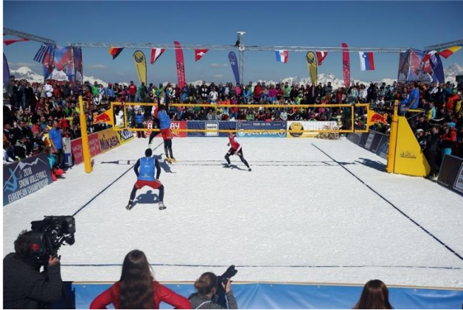
Slika 5. Odbojka na snijegu