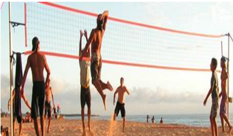
Slika 2. Odbojka na pijesku

Prva utakmica odbojke na pijesku odigrana je 1915. godine u SAD – u, no FIVB je prihvatio odbojku na pijesku kao službenu vrstu odbojke tek 1987. godine te je time i 1996. godine dodana u Olimpijske igre. Kao i što samo ime govori, ova vrste odbojke se igra na pijesku i s manje igrača, dva igrača, pravila su ista kao i kod dvoranske odbojke. 14