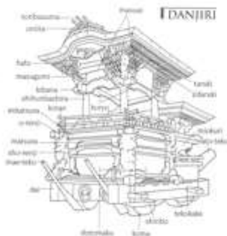
Slika 5: Danjiri

Osim yame i hoko, još jedna splav koja se koristi u matorijima je danjiri . Kishidawa festival je poznat upravo po brojnim danjirijima, odnosno u ovom festivalu, koji čuva svoju tradiciju preko 280 godina, koristi se 32 danjirija te svaki mjeri četiri metra u visinu, dva i pol metra u širinu i teži oko četiri tone, a krasi ih reljefni ukrasi koji opisuju slave epizode iz dobro poznatih borbenih priča prošlosti (Ozawa, 1999: 115).