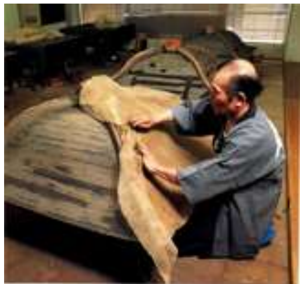
Slika 8: Restauracija mikoshija