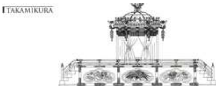
Slika 3: Takamikura

Ozawa u svojoj knjizi također pobliže opisuje same vrste i stilove mikoshija. Sam mikoshi se može opisati kao „kočija“ božanstva do svetišta u kojem pripada, a postoje dvije vrste: miya mikoshi ili službeni mikoshi svetišta te machi mikoshi ili mikoshi udruge lokalnog susjedstva (Ozawa, 1999: 113). Što se tiče stila mikoshija, postoje također dvije vrste, a to su Kansai stil i Kanto stil. Kansai stil je stariji te se smatra kako je potekao iz imitacije takamikura 9 , dok kod Kanto stila, područje odmah iznad daiwa , odnosno baze na kojoj gornja struktura leži, namijenjeno je kako bi se sugerirala oblast šintoističkih svetišta (Ozawa, 1999: 113).