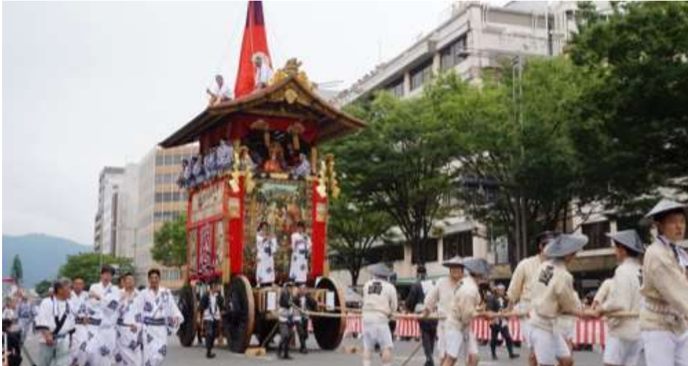
Slika 1: Splav korištena tijekom Gion Matsuria