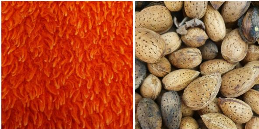
Slika 4: Primjer tekstura

Teksturu se može opisati kao vanjski izgled ili vizualni osjećaj neke površine. Ona može biti mat i/ili sjajna te isto tako glatka i/ili hrapava, a već samo gledajući u nju imamo osjećaj kao da ju dodirujemo jer smo poučeni prošlim iskustvom kada smo takvu površinu osjetili drugim osjetilom odnosno dodirom. Kod računalnog vida tekstura je zapravo niz ponavljajućih uzoraka koji se pojavljuju na površini, a moguće ih je uočiti. Opća definicija koju je ponudio Davies (2018.) glasi da je tekstura u računalnom vidu zapravo karakteristična varijacija u intenzitetu dijela slike koja nam omogućava da ju prepoznamo, opišemo i definiramo njezine granice. To su npr. domine poslagane u neku formu, valovi na površini mora ili lišće na stablima. Tekstura se najčešće dobije od manjih komponenti ili predmeta koji su po strukturi slični, ali su zajedno posloženi na različite načine. Tekstura se promatra na većem uzorku piksela za razliku od npr. svjetline koja je karakteristika pojedinog piksela. Na slici 4 prikazane su dvije teksture. Na lijevoj slici je prikazana tekstura deke ovaj tip teksture raspoznaje ljudsko oko, a na desnoj bademi koji čine teksturu kakvu raspoznaje računalni vid.