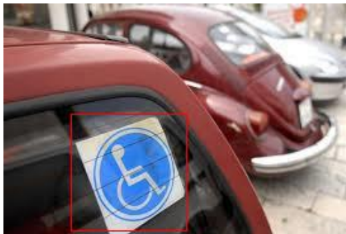
Slika 7: Naljepnica za parkiranje vozila osoba s invaliditetom

Kao primjer toga mogu biti javna parkirališta, gdje bi se nadzirala parkirna mjesta, a posebno ona predviđena za osobe s invaliditetom. Osobe s invaliditetom na vjetrobranu svojih vozila imaju naljepnicu s oznakom koju bi sustav vrlo lako moglo prepoznati. Ukoliko bi se vozilo bez takve oznake parkiralo na invalidsko mjesto, kamerom bi se slikala tablica koju bi strojno učenje pročitalo te bi na osnovu nje sustav poslao kaznu vlasniku nepropisno parkiranog vozila. Isto tako mogu se očitavati parkirne karte, bile one papirnate, kada bi promatrali kokpit automobila ili plaćene drugim metodama, kada bi prepoznajući tablice čitali u sustavu ima li zapisa za njih. S uvođenjem navedenog ne bi bilo potrebe za fizičkim prisustvom zaposlenika na parkiralištima. Slika 7 prikazuje naljepnicu koja označava da je vozilo osobe s invaliditetom.