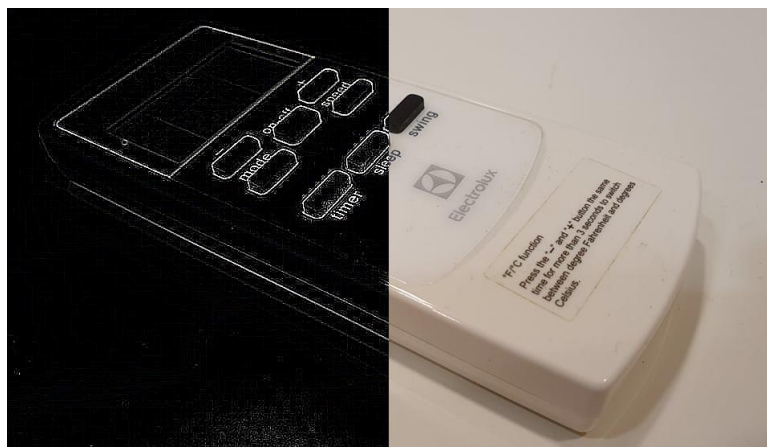
Slika 3: Slika daljinskog upravljača s primjenom detekcije ruba

Slika 3 prikazuje primjenu detekcije ruba na slici daljinskog upravljača. Na lijevoj polovici slike bijelim linijama označen je detektirani rub.