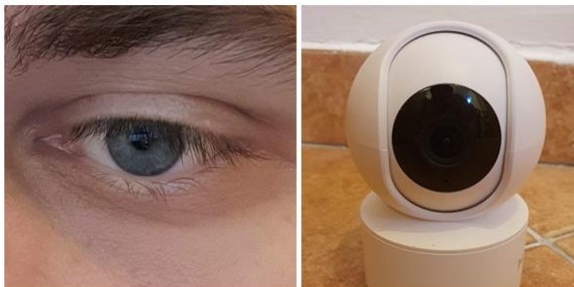
Slika 1: Ljudski i strojni organi vida

Većina ljudi podarena je s pet osjetila kojima doživljavamo okolinu. Naravno radi se o dodiru, njuhu, okusu, sluhu i vidu. Osjetilo koje se među njima možda najviše ističe je osjetilo vida s obzirom da se na njega najčešće i oslanjamo u raznim situacijama. Korištenje vida vrši se organom oka uz čiju pomoć razaznajemo boje, oblike, svjetlo i udaljenosti. Vidom ljudski mozak prima enormnu količinu informacija te je zanimljivo kako zapravo ljudski mozak s velikom lakoćom interpretira sve dobivene informacije. Tako nam ne treba dugo da shvatimo gledamo li u psa, kuću ili slično. Razvojem tehnologija stvorila se želja i potreba da i računala „progledaju“, međutim tu dolazi do velikih izazova s obzirom da je ljudski vid rezultat evolucije i to ne samo oka već i mozga koji procesira sve što dolazi iz oka. Mozak sa svojim neuronima djeluje poput kompleksnog super-računala s ogromnim brojem mikroprocesora koji čine vid takvim kakav jest te na svijetu ne postoji elektronsko računalo koje bi ga moglo nadmašiti. Svakim danom nastoji se omogućiti računalima da zamijene čovjeka u raznovrsnim zadacima i to uglavnom s uspjehom, pa će tako računalo izvršiti većinu repetitivnih zadataka, dok za neke kompleksnije zadatke koji zahtijevaju interakciju s okolinom, potrebno mu je omogućiti da vidi. Mnogo je izazova na putu za ostvarivanje navedenog. Slika 1 na lijevo prikazuje oko što je ljudski organ vida, dok na desno je strojni „organ“ vida tj. kamera.