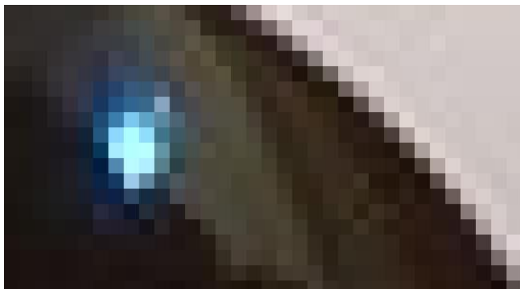
Slika 2: Pikseli

Singh (2019.) je dao definiciju slike kao dvodimenzionalni vizualni prikaz objekta iz naše okoline s kojima se susrećemo svakodnevno, a to mogu biti životinje, osobe, razni predmeti ili bilo kakav drugi objekt. Slika je zapravo skup piksela koji mogu biti različitih boja i bilo koje boje. Pikel je dakle najmanji element svake digitalne slike, a potpuna slika dobije se udruživanjem velikog broja piksela. Svaka slika je predstavljena rezolucijom, a to je ukupni zbroj piksela koji su prisutni na slici. Što je veći broj piksela prisutan na slici, to će slika biti kvalitetnija. Primjer rezolucije je 800x600 što znači da će takva slika imati 480.000 piksela, što se dobije množenjem ta dva broja. Na slici 2 vidljivi su pikseli raznih boja na uvećanoj slici.