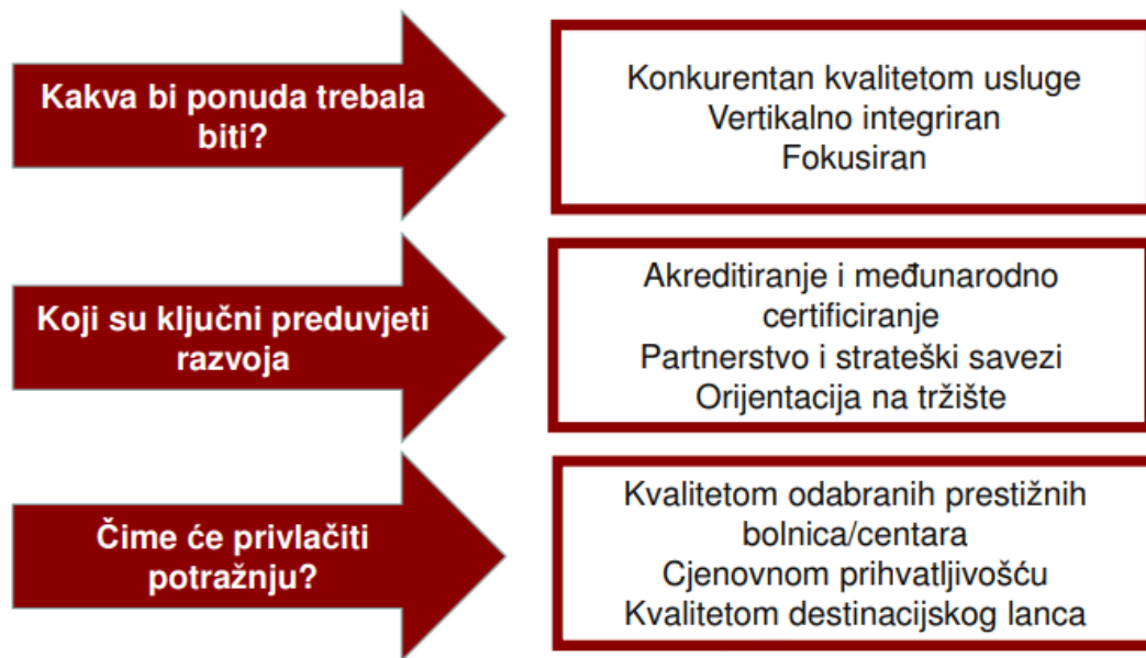
Slika 6. Vizija razvoja medicinskog turizma