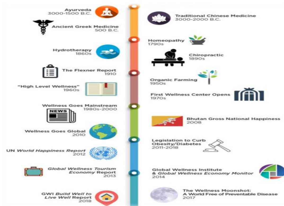
Slika 2. Povijesni razvoj wellnessa