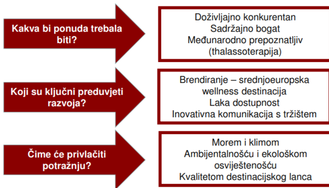
Slika 4. Vizija razvoja wellness turizma