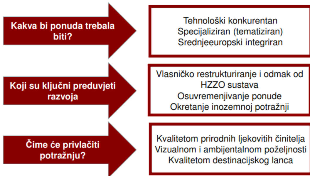
Slika 5. Vizija razvoja lječilišnog turizma