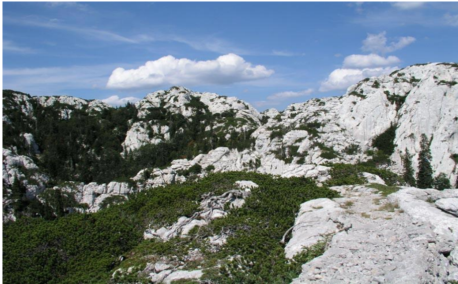
Slika 9. Nacionalni park Sjeverni Velebit

U parku obitavaju veliki predatori – smeđi medvjed, ris i vuk. Moguće aktivnosti posjetitelja u parku jesu: pješaćenje kroz prirodu, planinarenje, snimanje žive i nežive prirode, vožnja biciklom i jahanje.