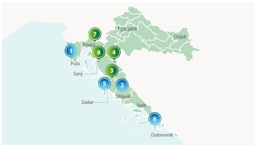
Slika 1. Karta nacionalnih parkova u Republici Hrvatskoj

Po očuvanoj prirodi Hrvatska je među najbogatijim zemljama Europe, a zaštićena priroda jedan je od najjačih hrvatskih brendova. To potvrđuje i činjenica kako je trećina teritorija Hrvatske dio najveće svjetske mreže zaštićenih područja – europske ekološke mreže Natura 2000. Zbog iznimnih prirodnih i krajobraznih vrijednosti, naših osam nacionalnih parkova i jedanaest parkova prirode prepoznati su na karti svijeta kao mjesta koje se mora vidjeti i doživjeti.