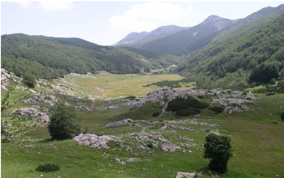
Slika 3. Nacionalni park Paklenica

Park plijeni pozornost prirodnim ljepotama i rijetkostima među kojima su špilje, od kojih su najpoznatije: Manita peć, Veliki sklop i jama Vodarica. Špilje su bogate brojnim i zanimljivim sigama koje privlače znanstvenike i speleologe radi istraživanja, a gospodarski obogaćuju turističku ponudu parka.