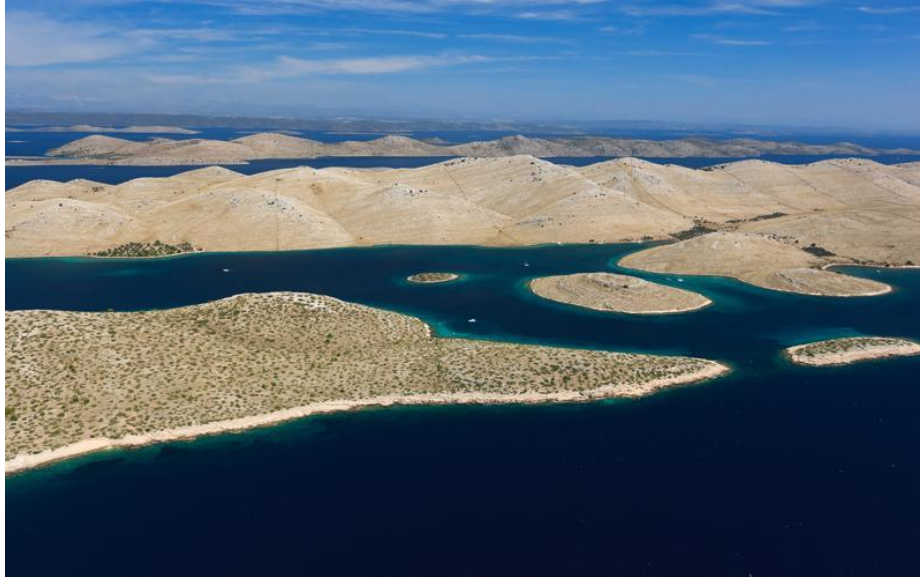
Slika 6. Nacionalni park Kornati

Arheološke iskopine otkrile su ostatke ilirskog naselja, rimske vile iz 1. stoljeća, rimske solane, crkvice iz 12. stoljeća i ilirske utvrde. Tragova naselja na Kornatima ima čak od neolita. 24