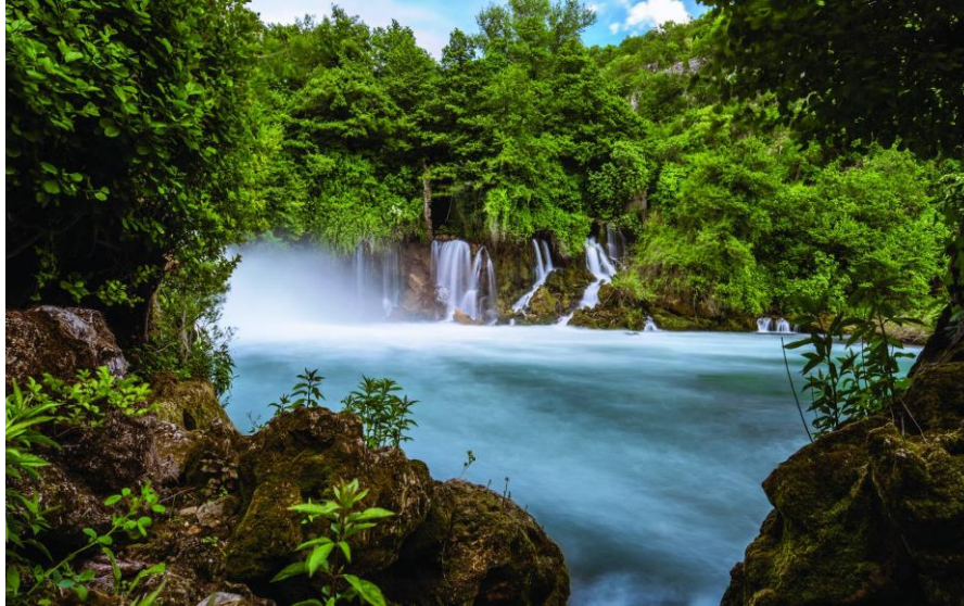
Slika 8. Nacionalni park Krka

s oskudnom vegetacijom i šume gmazovima i manjim sisavcima. Zbog proljetne i jesenske seobe ptica Krka je uvrštena u ornitološki važna područja Europe. 29