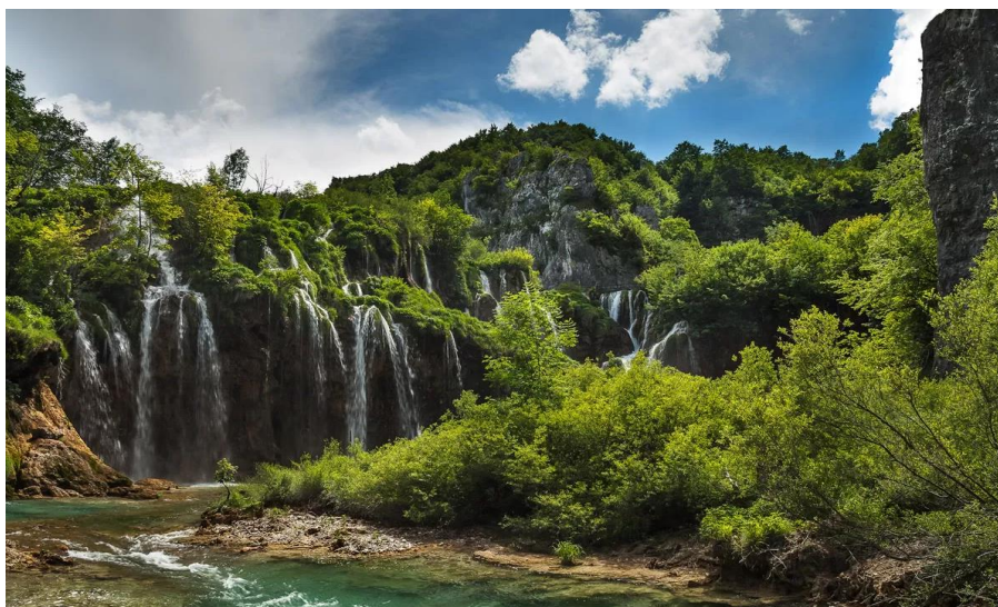
Slika 2. Nacionalni park Plitvička jezera