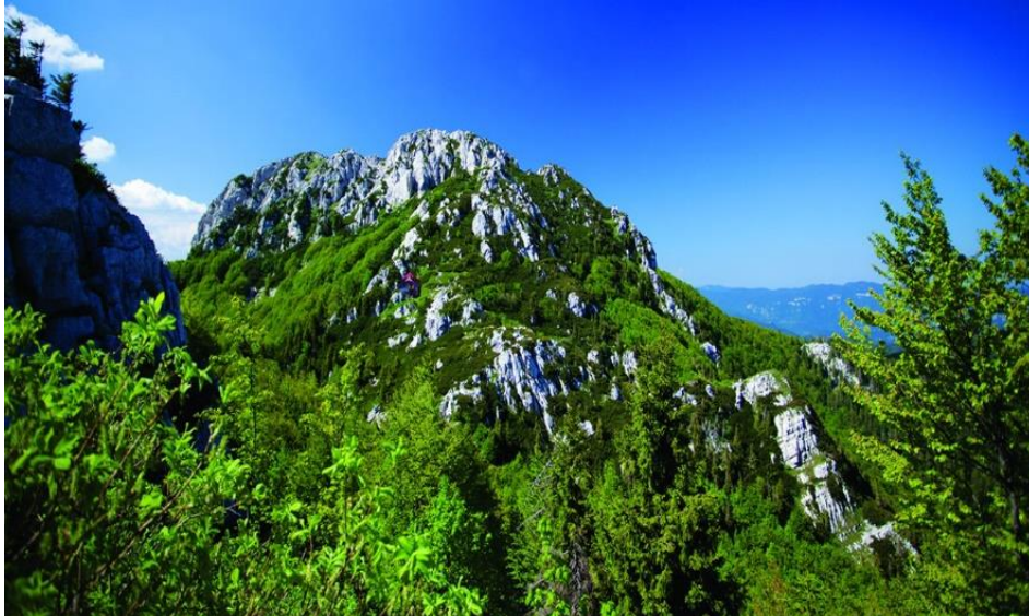
Slika 4. Nacionalni park Risnjak

Uz bogatstvo vegetacijskog pokrova, usko je povezana i raznolikost životinjskog svijeta. Obitavaju tri velike zvijeri Europe: ris ( Lynx lynx ) po kojem je i Risnjak dobio ime, vuk ( Canis lupus ) i smeđi medvjed ( Urus arctos ). Također, tu je čitav niz sisavaca, vodozemaca i ostalih predstavnika faune. Potrebno je spomenuti više od 130 vrsta leptira od kojih je nekoliko endemskih vrsta. 21