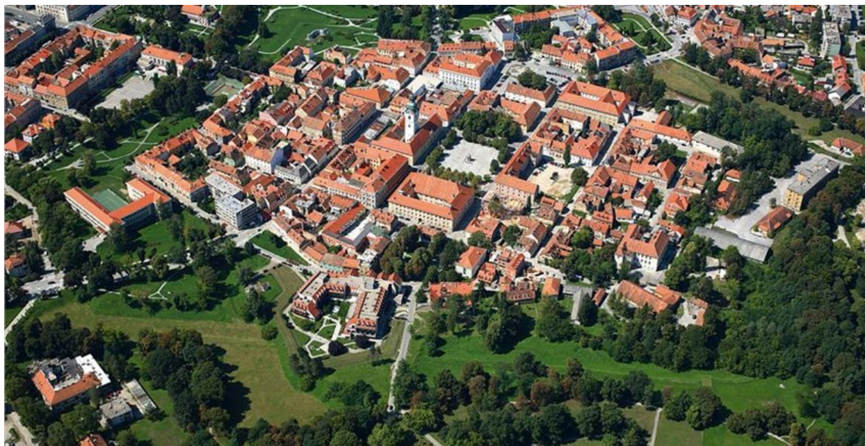
Slika 1- Karlovačka zvijezda