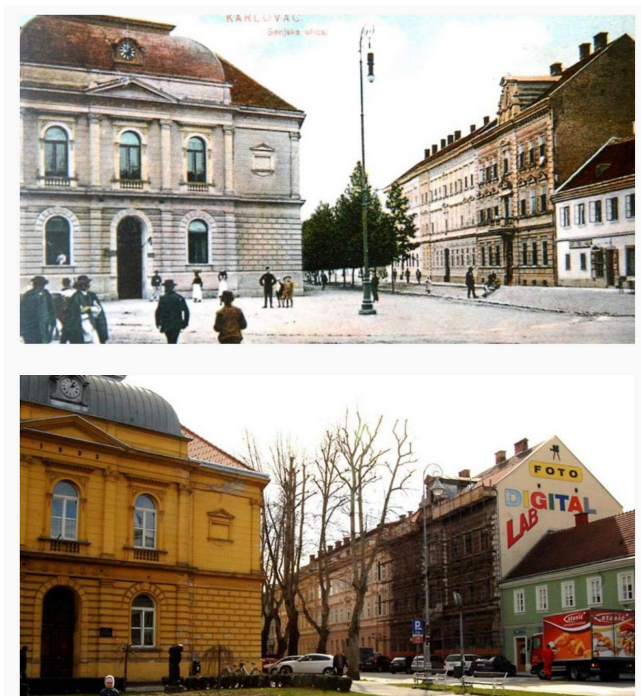
Slika 9- viša djevojačka škola prije i poslije