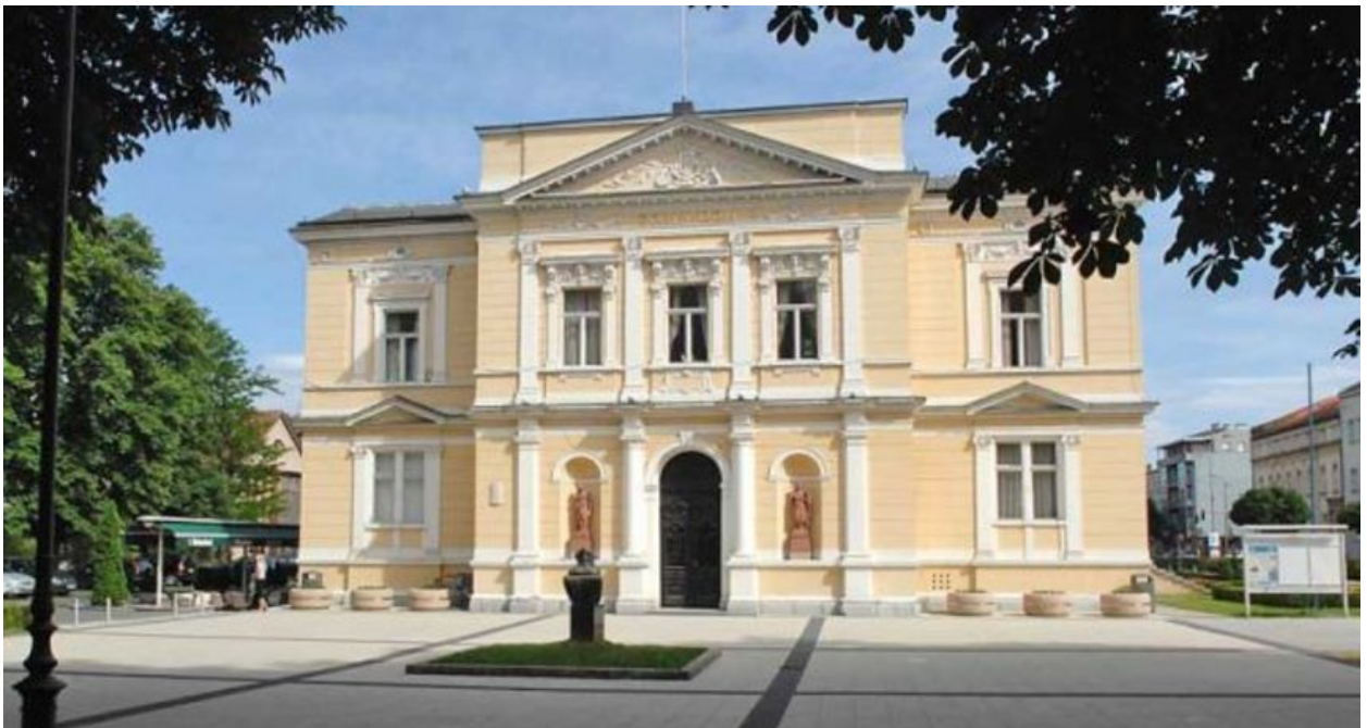
Slika 2- Gradsko kazalište Zorin dom