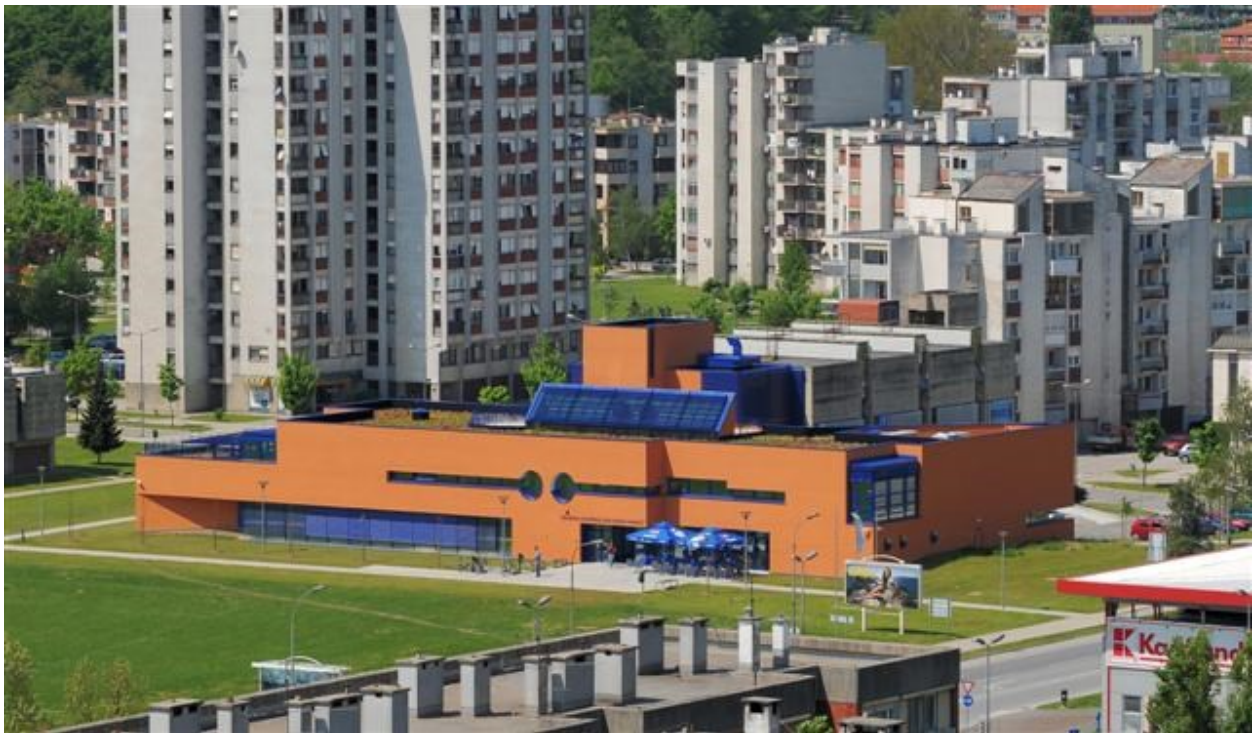
Slika 11- Knjižnica Ivana Gorana Kovačića