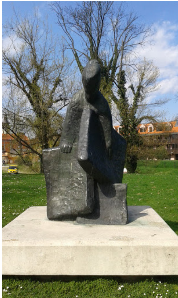
Slika 7- spomenik Vjekoslavu Karasu