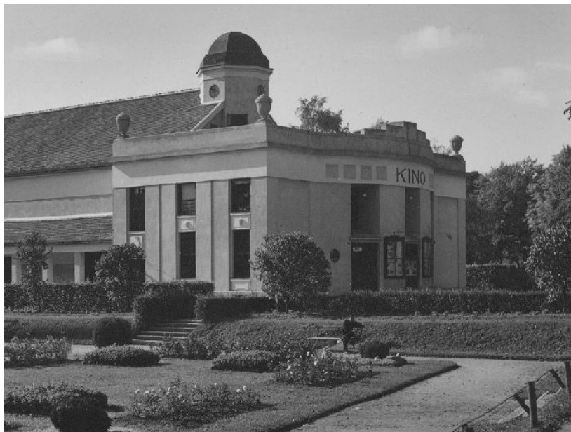
Slika 3- Kino Edison prije 20 godina