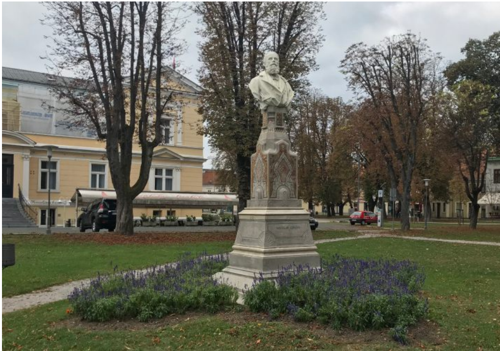
Slika 8- spomenik Radoslavu Lopašiću