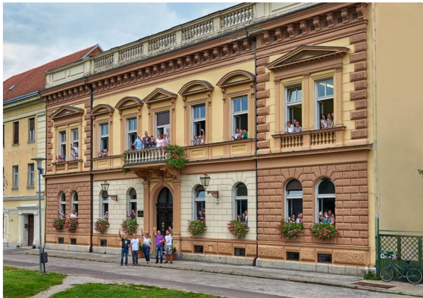
Slika 10- Glazbena škola Karlovac