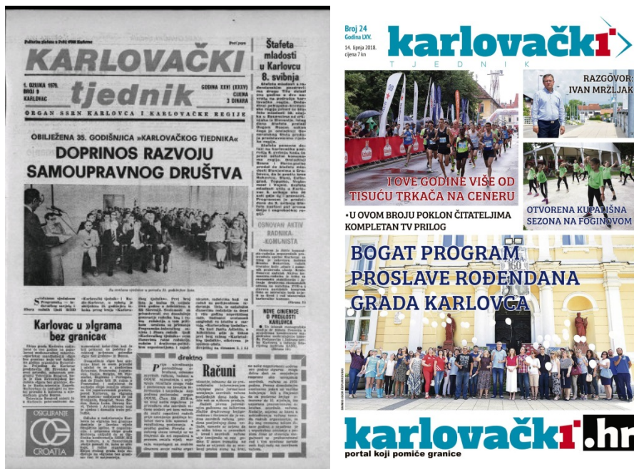
Slika 15- naslovne stranice Karlovačkog tjednika