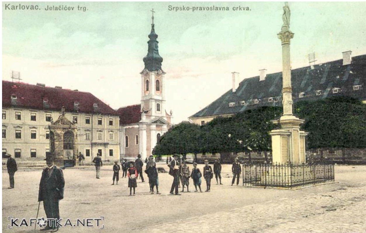
Slika 6- Kužni pil