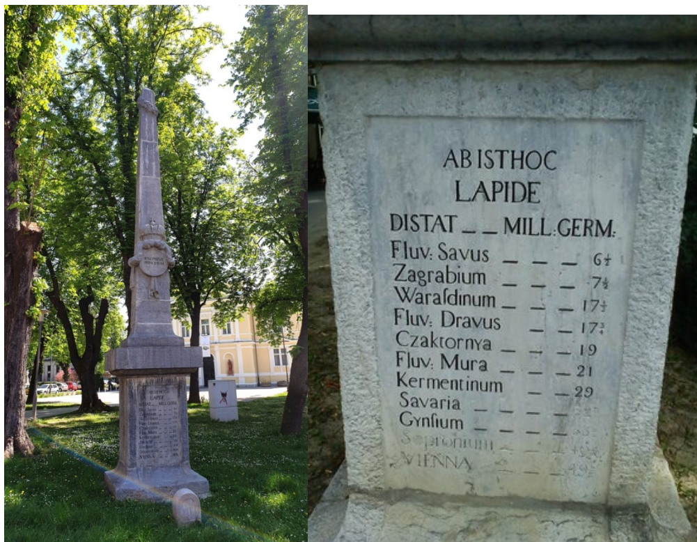
Slike 4 i 5- Miljokaz u pravoj veličini i uvećani detalj