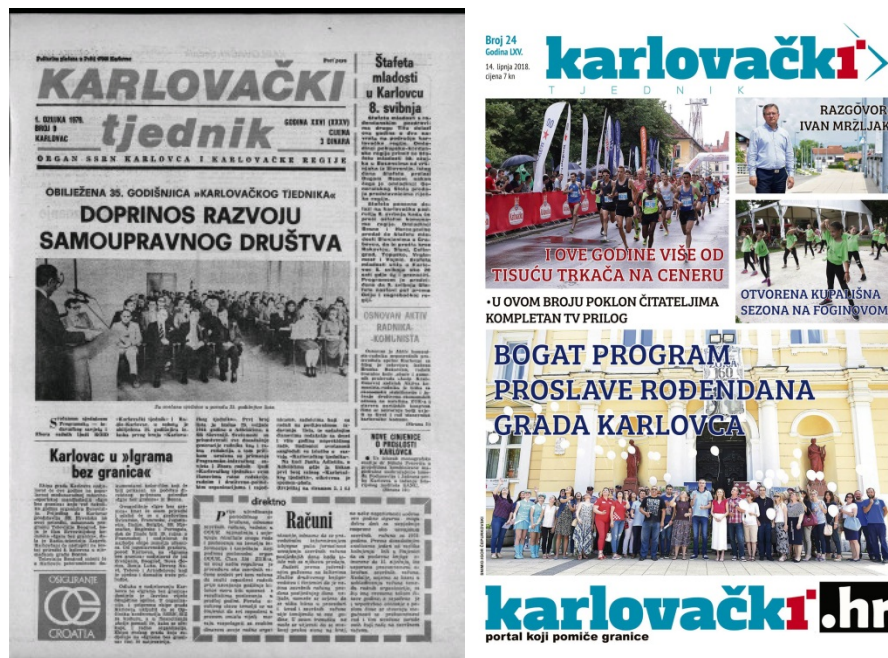
Slika 15- naslovne stranice Karlovačkog tjednika