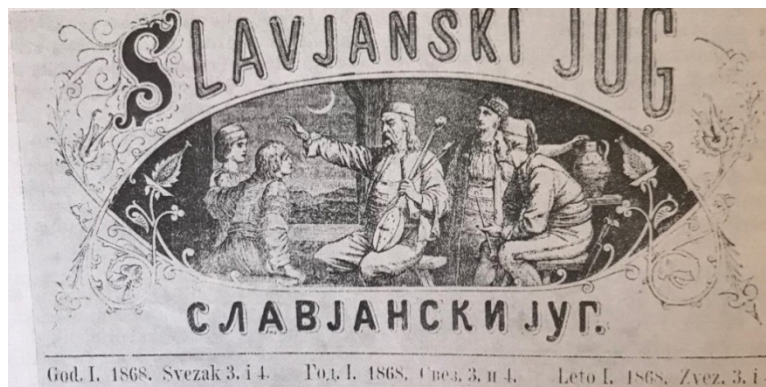
Slika 13- naslovna stranica Slavjanskog juga