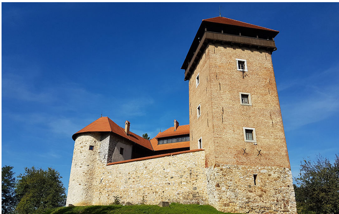
Slika 12- Stari grad Dubovac