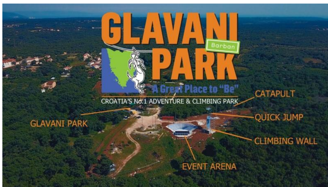
Slika 4. Glavani park