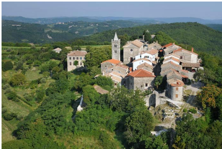
Slika 7. Hum - najmanji grad na svijetu

Istra je prepuna povijesnih priča, povijesnih građevina i malih gradića u kojima su se tijekom godina izmijenile mnogobrojne civilizacije. Na primjer, najmanji grad na svijetu, Hum (Slika 7.), smješten je u Istri.