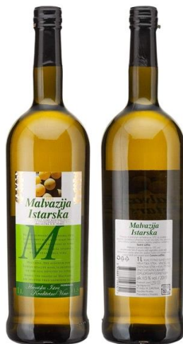
Slika 13. Malvazija Istarska

„Istarska vina imaju poseban okus zbog prirodnih posebnosti ove regije - vrste tla, reljefa i specifične klime nastale na mjestu gdje se susreću alpski i mediteranski zrak“ (istra.hr, 2021.).