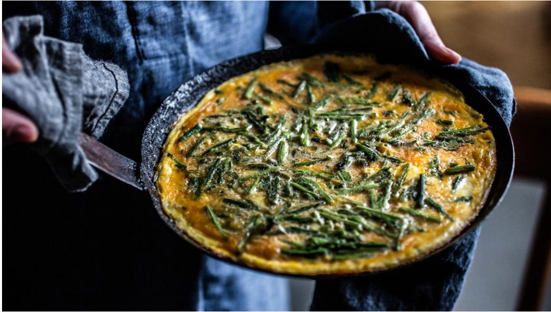
Slika 23. Istarska fritaja sa šparogama