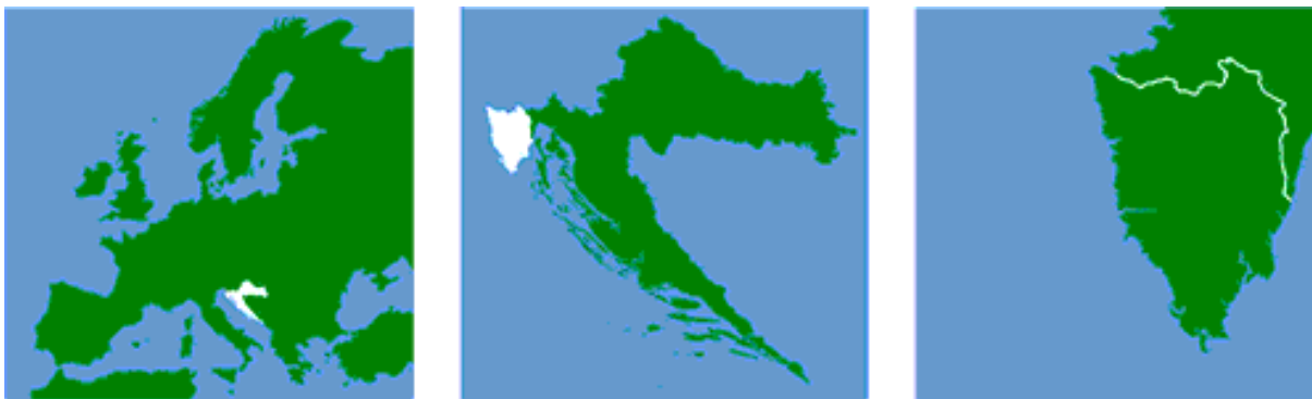
Slika 5. Istarska županija - geografski položaj

Ima izuzetno povoljan zemljopisni položaj – smještena je na pola puta između ekvatora i sjevernog pola. Klima je, također, izuzetno pogodna, duž obale je sredozemna klima, a u unutrašnjosti je kontinentalna. Što znači da su ljeta suha i topla, a zime su blage i ugodne. Upravo zbog povoljnog zemljopisnog položaja i pogodne klime Istarska županija postala je omiljena turistička destinacija domaćih i inozemnih turista koji istu posjećuju tijekom sva četiri godišnja doba.