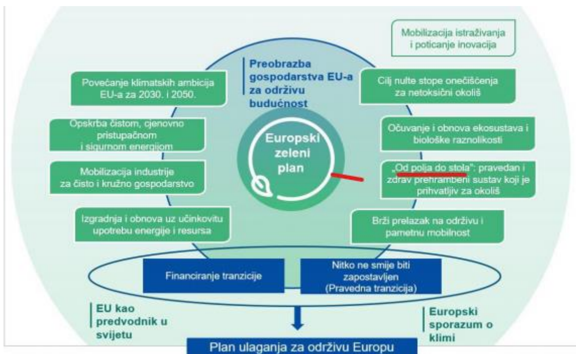
Slika 1. Elementi europskog zelenog plana

Novе mjere samo po sebi nisu dovoljne da se postignu ciljevi Europskog zelenog plana. Komisija mora pokrenuti nove inicijative i surađivati s državama članicama kako bi pojačala nastojanja Europske Unije da se važeće zakonodavstvo i politike koje se odnose na zeleni plan provedbe i djelotvorno primjenjuju.