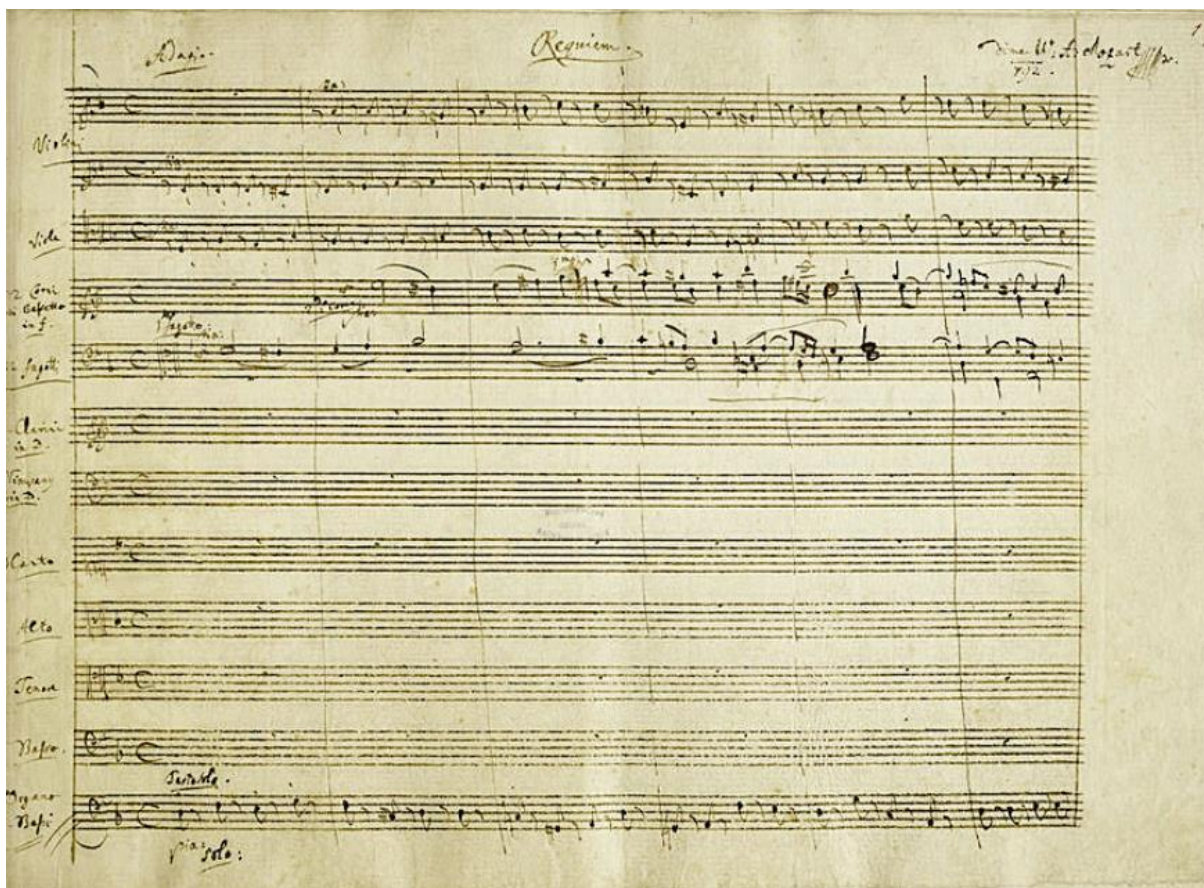
Slika: Primjer partiture nestandardnog rasporeda. U primjeru se vidi sljedeći raspored dionica: na vrhu su violine i viole, ispod njih su drveni puhači, slijedi zbor te kontrabas na dnu.

U nakladničkoj djelatnosti postoje velike, srednje i male partiture, ovisno o formatu. Velike su dirigentske, a ostale su za studij. Normalna je praksa u partiturama da se zbog uštede prostora ne zapisuju one dionice koje trenutno paziraju. Obično se na početku kompozicije ili stavka navede pun raspored instrumenata i sustava pa se kasnije koriste skraćenja (Romanić, 1982:52).