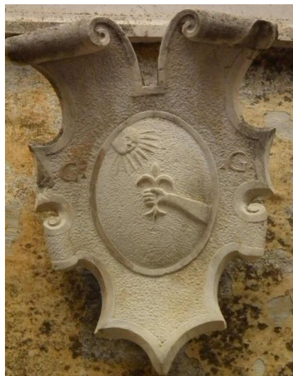
Slika 1. Grb Grožnjana