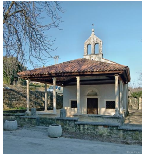
Slika 4. Crkva Sv. Kuzme i Damjana