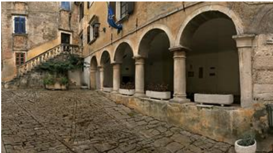
Slika 3. Današnji oblik fontika i palača Briani

Izvor: www.lokalnahrvatska.hr , 5. ožujka 2016.