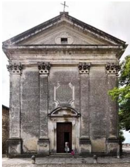
Slika 2. Crkva Sv. Vida, Modesta i Krešencije