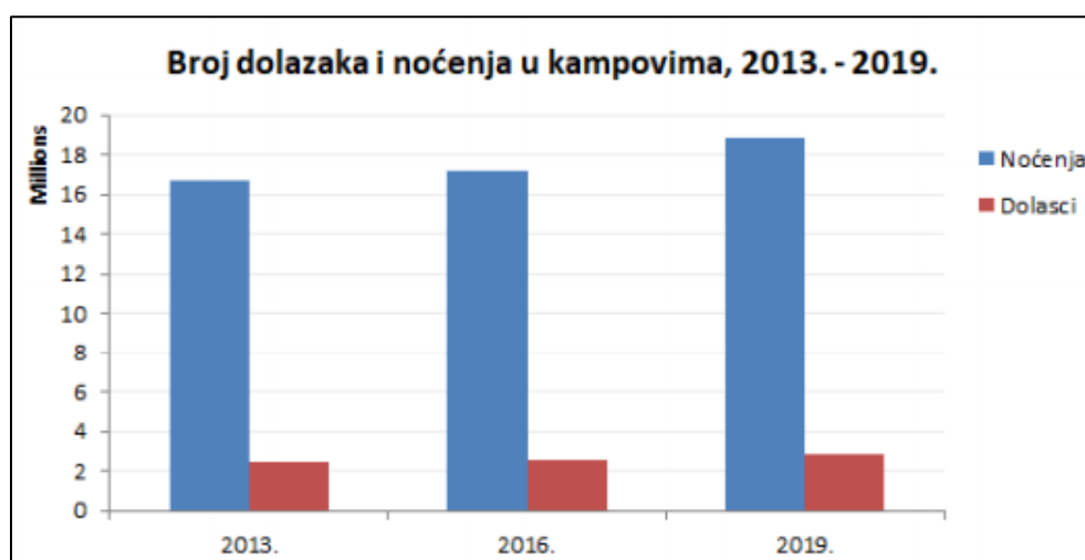
Slika 6. Broj dolazaka i noćenja u kampovima, 2013. - 2019.

Izvor: https://www.htz.hr/sites/default/files/2021-02/Kamping%20turizam%20Hrvatske%20-%20izdanje%202020_0.pdf (preuzeto 03. svibnja 2021.)