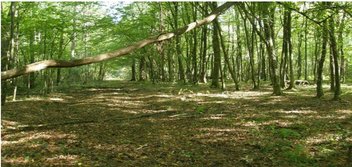
Slika 1. Prašuma Prašnik