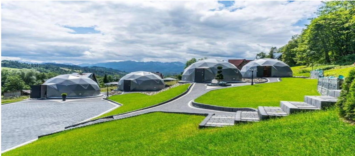
Slika 4. Primjer glamping kućice