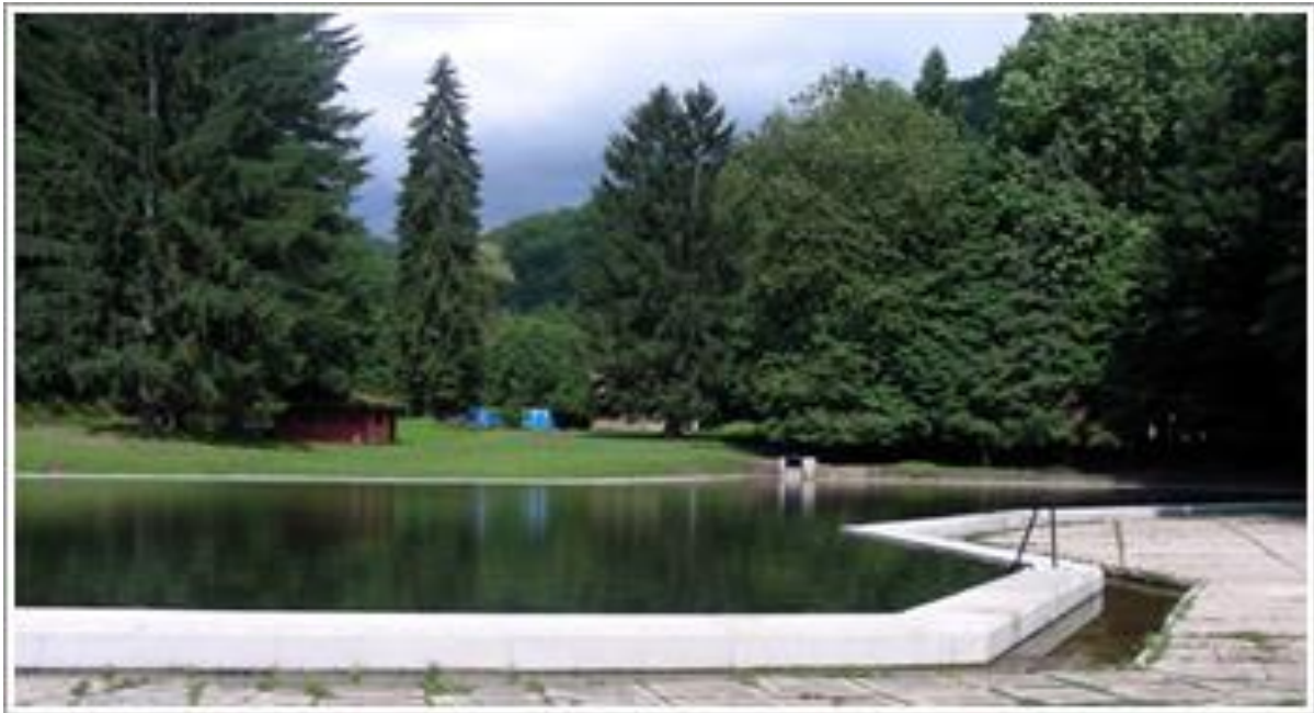
Slika 5. Primjer raspoloživog područja za razvoj glamping turizma