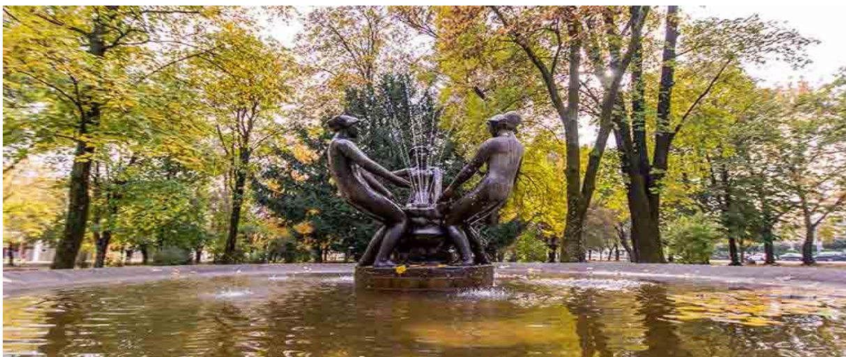
Slika 2. Gradski park