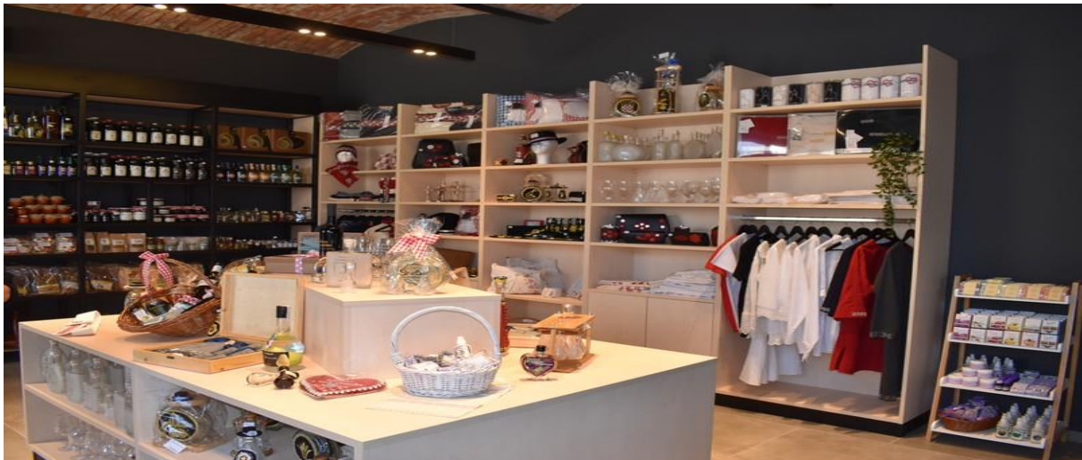
Slika 3. Slavonski dućan